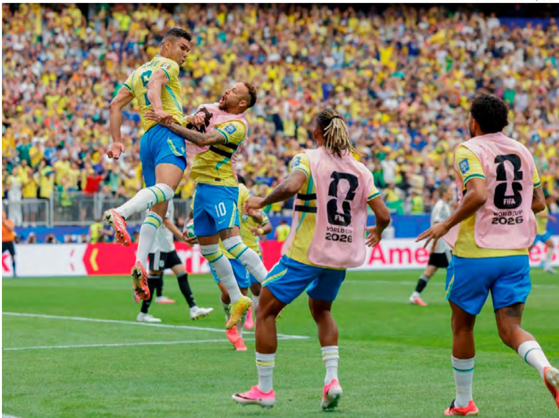
Casemiro marcou um dos gols da vitória do Brasil sobre o Japão, por 2 a 1, no estádio de Houston (EUA)