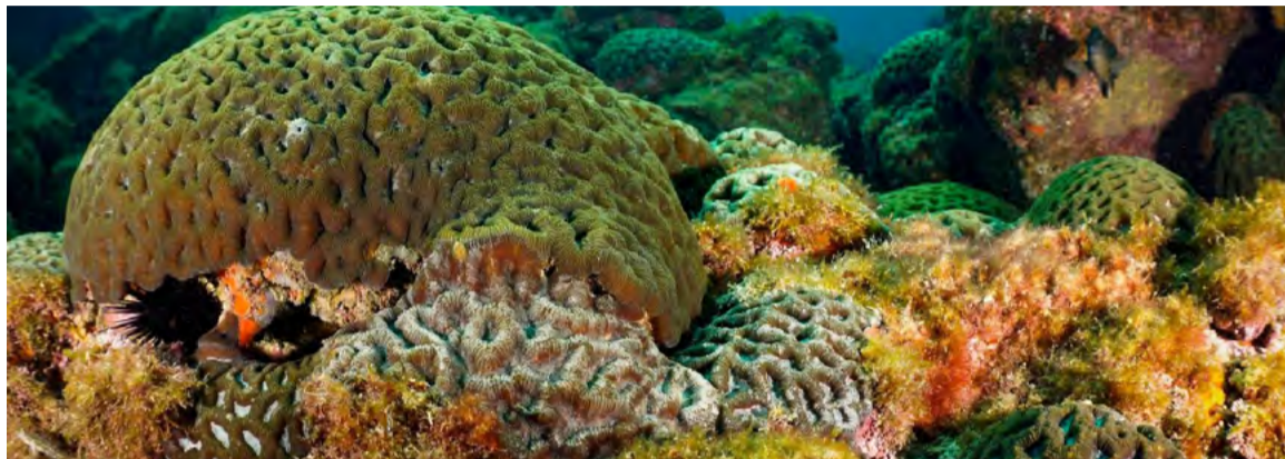
Espécies de coral que ocorrem no país tiveram sua classificação de risco elevada