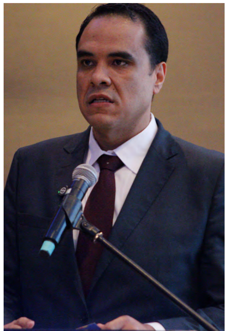
Ministro Gustavo Feliciano: “Vamos promover o RN”