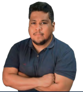
DIEGO BRENO O BRASIL E SEU DIA DE REAL MADRID PÁGINA 11

Município também não cumpre a exigência legal de aplicar recursos em obras e reformas PÁGINA 4