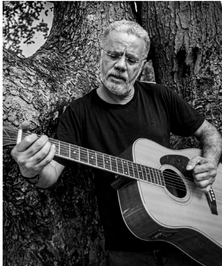
Moisés de Lima é um dos expoentes do rock e do blues no RN