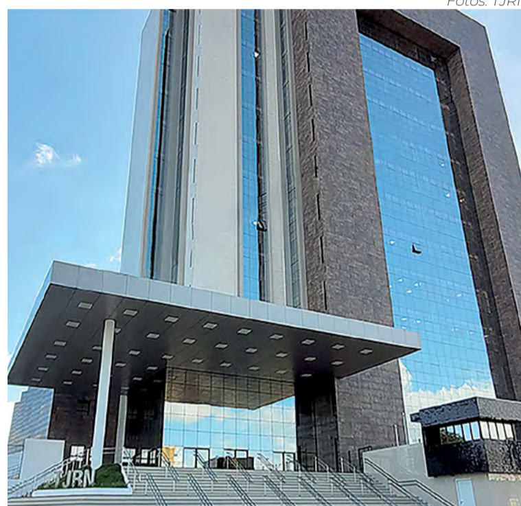
TJRN registrou em abril redução de 64% nos “penduricalhos”

O despacho reforça a obrigatoriedade de os órgãos públicos divulgarem em seus sites oficiais os valores exatos recebidos pelos servidores. Caso haja divergência entre o montante publicado e o efetivamente pago, os gestores estarão sujeitos a punições. A decisão do Supremo confronta uma resolução conjunta editada em abril pelo Conselho Nacional de Justiça (CNJ) e pelo Conselho Nacional do Ministério Público (CNMP). Segundo o despacho dos ministros, a norma dos conselhos abriu brechas para gratificações de proteção à primeira infância e auxílio-moradia, instrumentos que poderiam ser utilizados para contornar o teto remuneratório nacional.