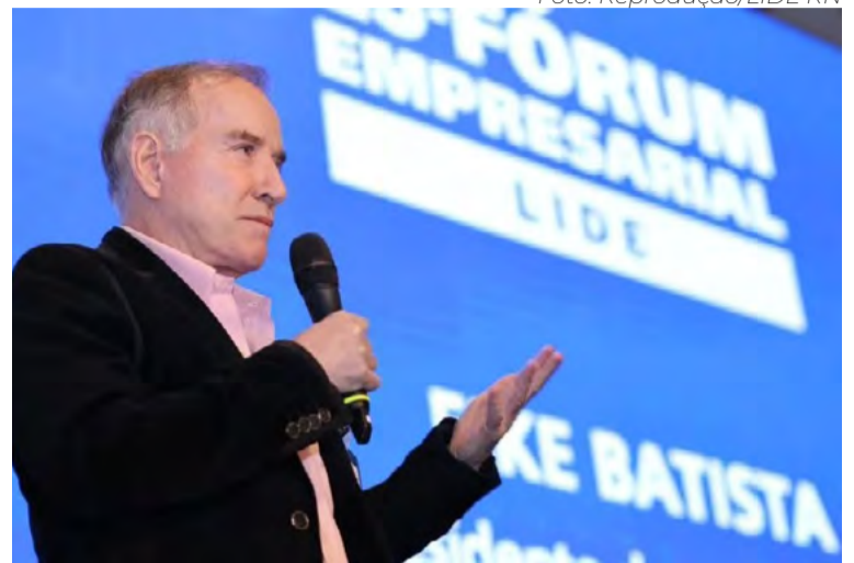
O empresário e investidor Eike Batista é fundador do Grupo EBX

Ao longo de sua carreira, Eike Batista fundou mais de 20 empresas que se tornaram bilionárias e realizou seis IPOs na bolsa de valores brasileira, um feito alcançado por poucos empresários no país. Sua atuação abrange segmentos como mineração, energia, petróleo, logística e indústria naval, tendo liderado projetos de grande impacto econômico e estrutural, como o desenvolvimento do Porto do Açu, um dos maiores complexos portuários privados da