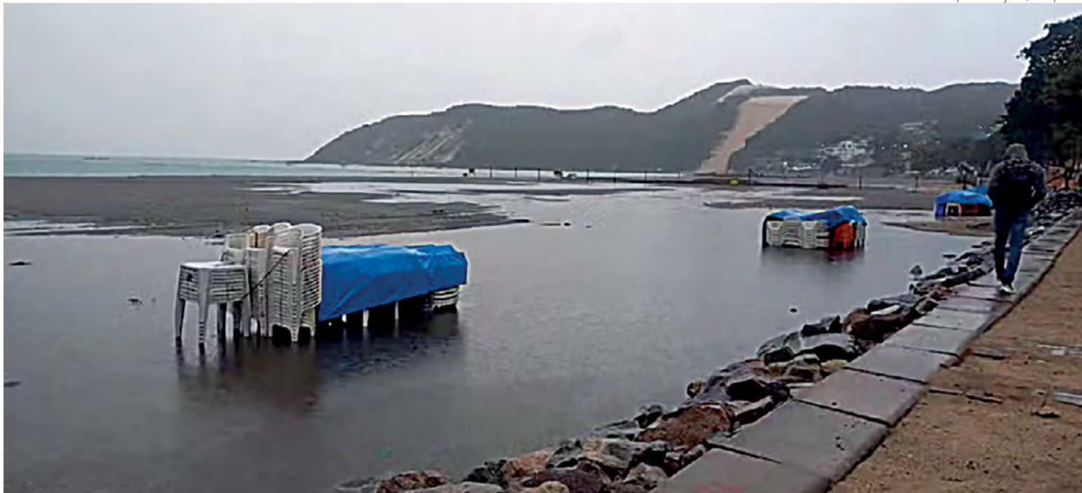
Ação civil do MPF chama a atenção para falta de drenagem adequada que prejudica a engorda de Ponta Negra

isso ocorre porque “a obra de drenagem pluvial tornou-se o cerne de uma gravíssima crise socioambiental e técnica”.