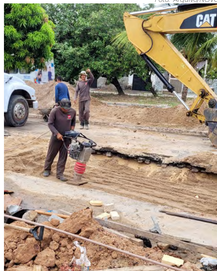
Expectativa é a de financiar obras de drenagem e mobilidade

De acordo com dados do portal de transparência do Judiciário potiguar, os rendimentos brutos pagos aos 14 desembargadores somaram R$ 1,032 milhão em abril. No mês de março, o montante havia atingido R$ 1,219 milhão.