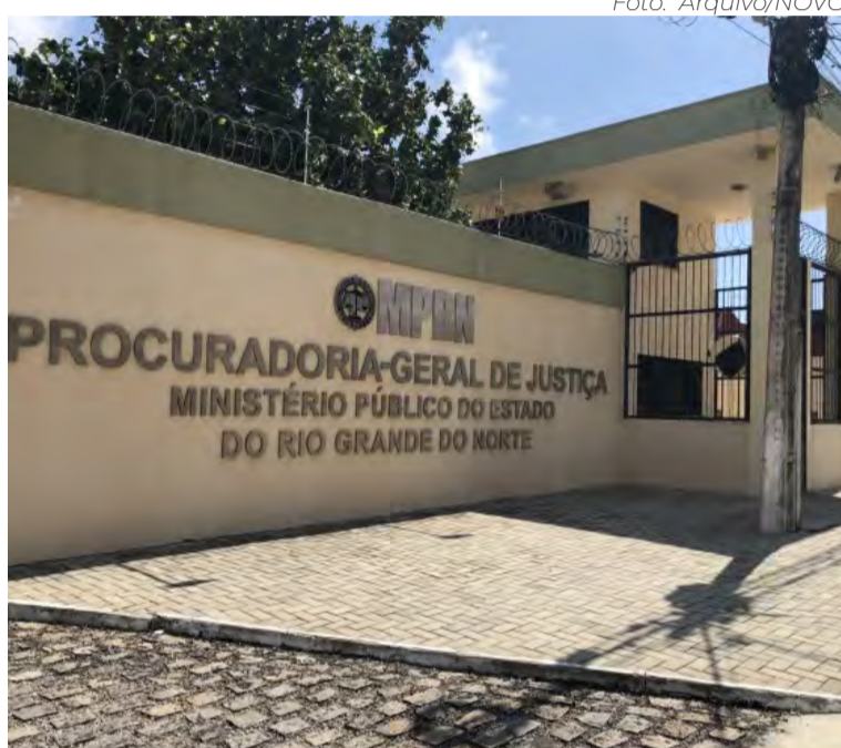
A média de rendimentos brutos no MPRN foi de R$ 92 mil

A tese fixada pelo STF sobre a remuneração de magistrados e membros do Ministério Público (MP) previa que os efeitos finan-