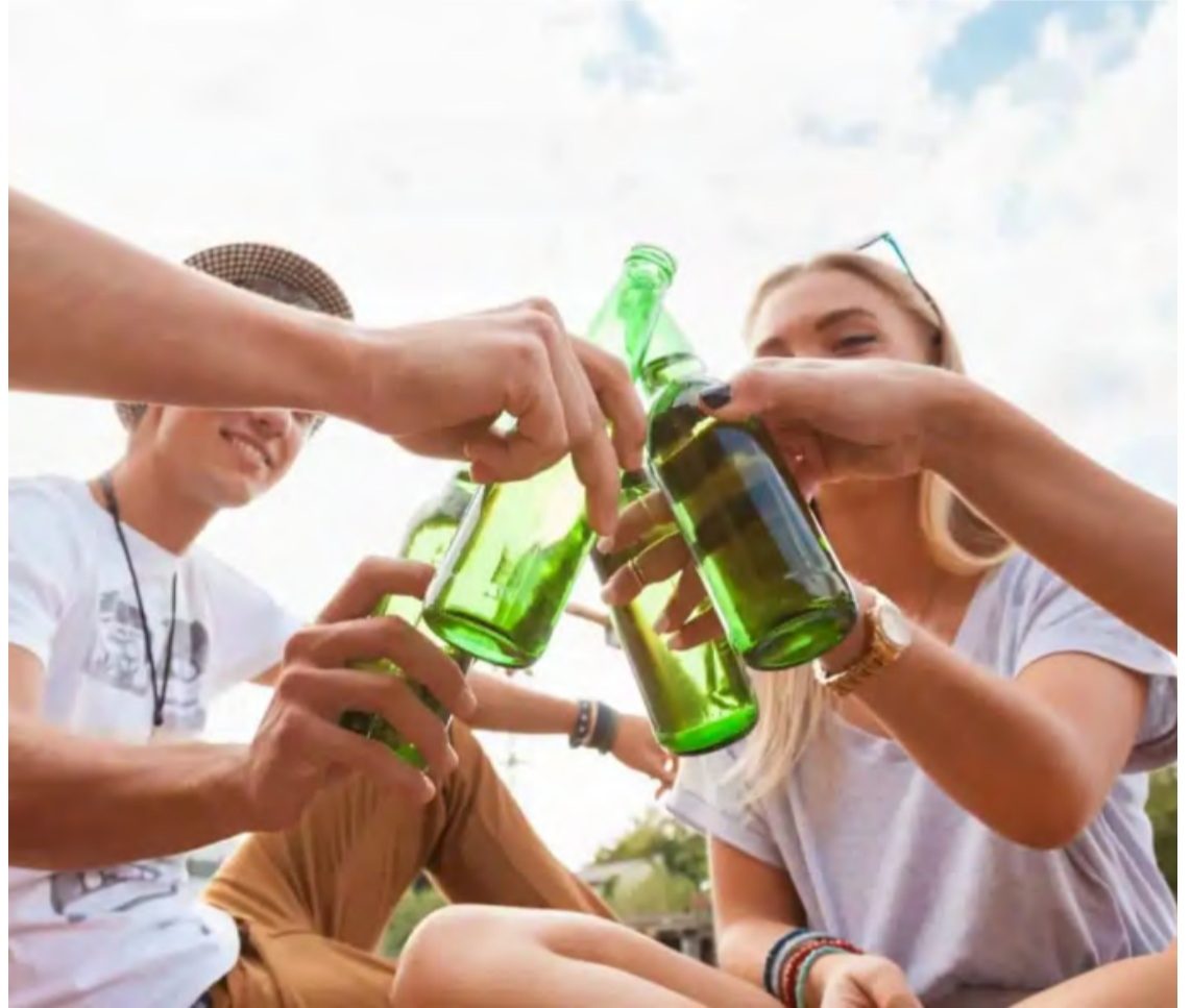
No RN, segundo o IBGE, 20,6% dos estudantes disseram ter experimentado álcool aos 13 anos ou antes

O avanço desses dispositivos entre jovens tem despertado atenção de profissionais da área de saúde, principalmente devido à popularização desses produtos e à percepção equivocada de que seriam menos nocivos do que o cigarro convencional.