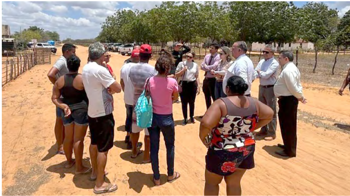
O imóvel, com cerca de 1.600 hectares, é utilizado para pesquisa agropecuária desde 1983