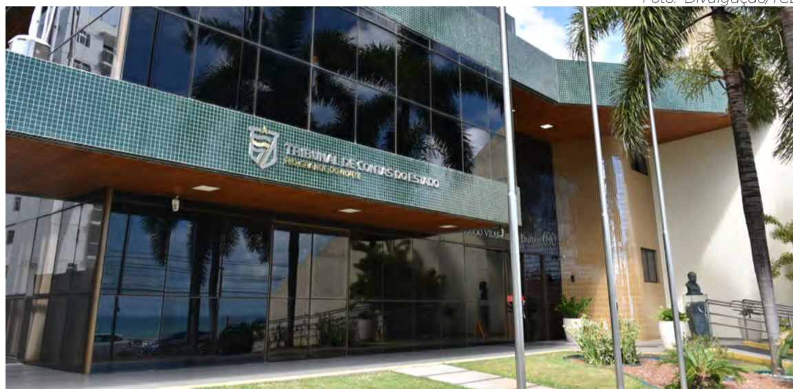
TCE suspendeu atos administrativos que concederam novos prazos a concessionárias de terrenos na Via Costeira

Em seu voto, o conselheiro do TCE-RN já anota que “tal conduta configura alienação de coisa alheia” e que uma das obrigações