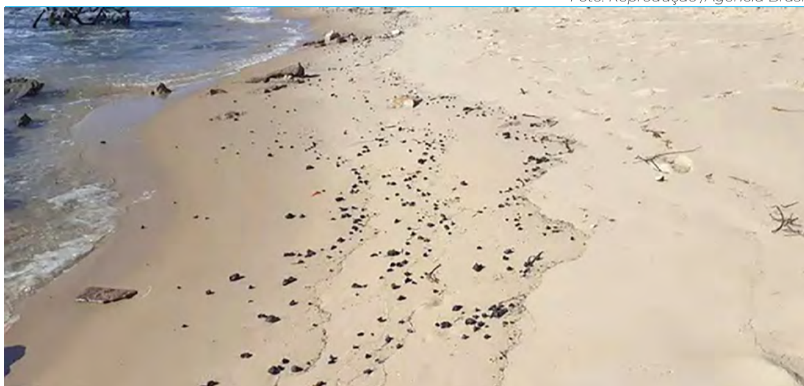
No RN, já foram identificados 24 pontos com manchas de óleo desde 2019

Cerca de 90% das informações de localização foram obtidas a partir de legendas e comen-