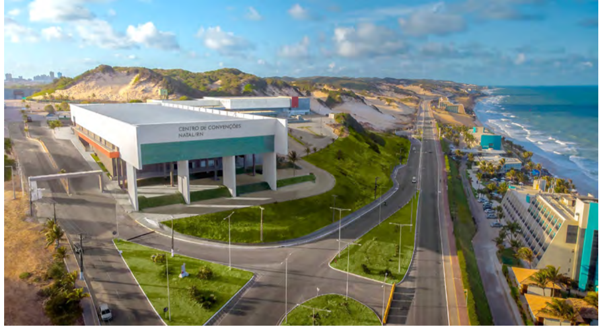
Centro de Convenções de Natal é considerado um dos principais equipamentos turísticos do Estado

Após a conclusão da análise técnica, o projeto ainda passará por outras fases formais antes da abertura da licitação. A primeira delas será a realização de uma