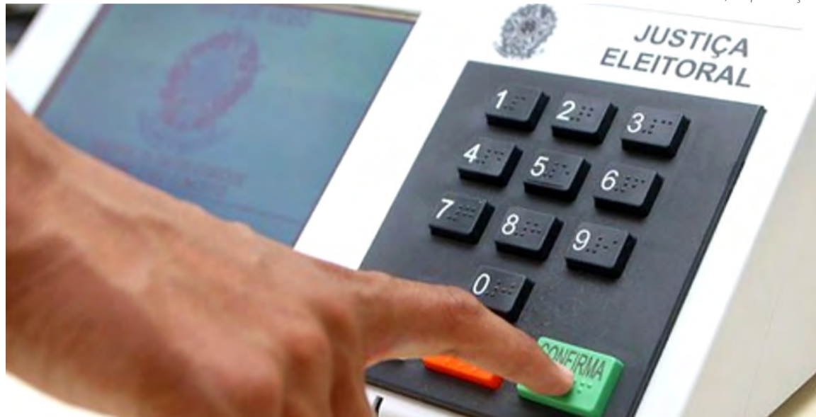
Trocas de partido, novas filiações e movimentações de lideranças redesenharam alianças de olho na eleição de 06 de outubro