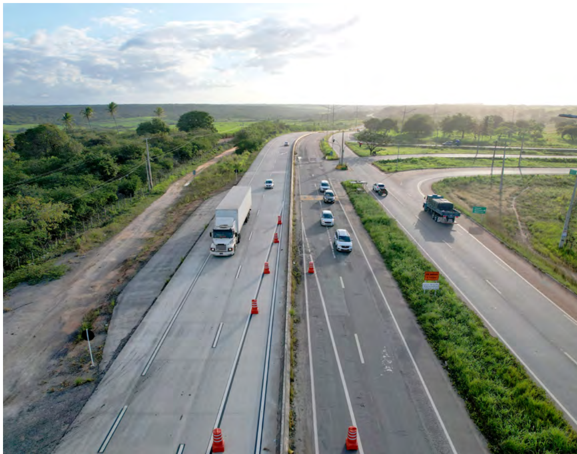
Trecho entre Assú e Mossoró concentra alto número de acidentes e será o primeiro a ser duplicado

Durante o anúncio, Renan Filho elogiou a articulação do governo estadual. “Parabéns, Fátima, por vencer essa batalha e conseguir fazer com que a obra saísse do papel. É um projeto estruturante para o Rio Grande do Norte”, declarou.