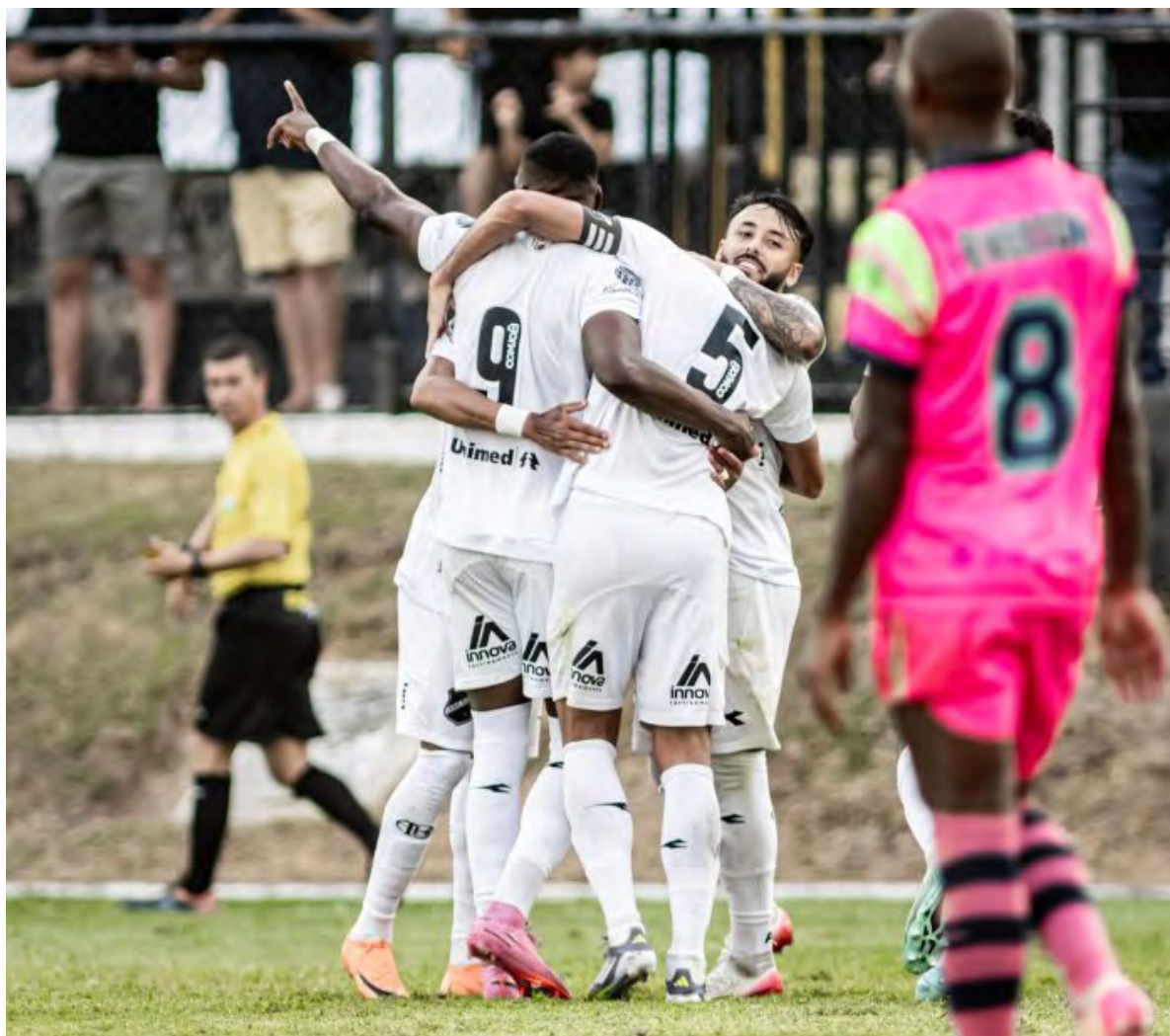
O Alvinegro venceu o Laguna por 2 a 0 no Frasqueirão, em jogo marcado por controle de jogo e eficiência