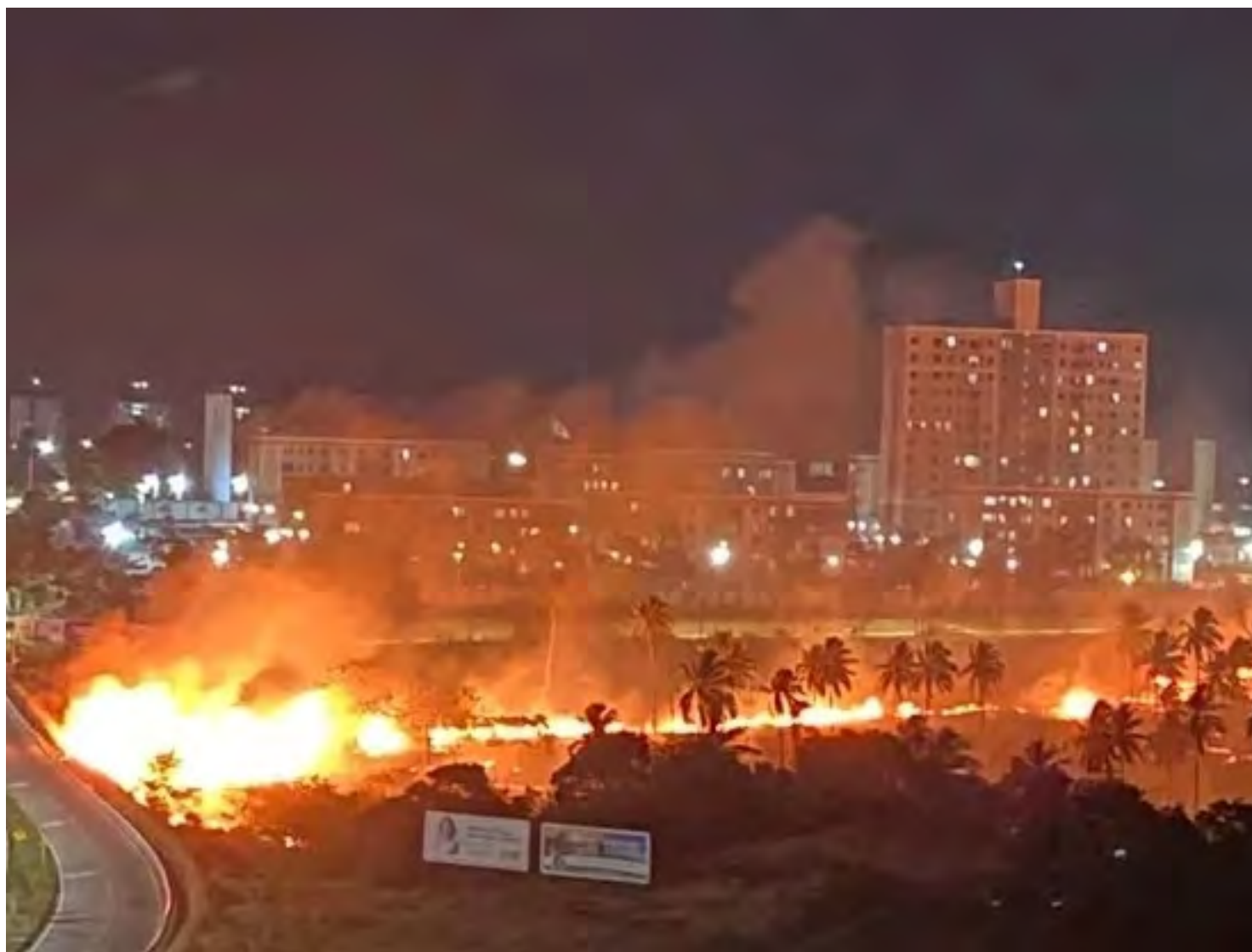
Incêndio em área de vegetação seca mobilizou bombeiros, Defesa Civil e moradores de Emaús, na divisa de Natal e Parnamirim

Além do risco direto de incêndio atingir residências, a fumaça tóxica gerada pela queima da vegetação representa um perigo à saúde, especialmente para crianças, idosos e pessoas com doenças respiratórias, como asma e bronquite.