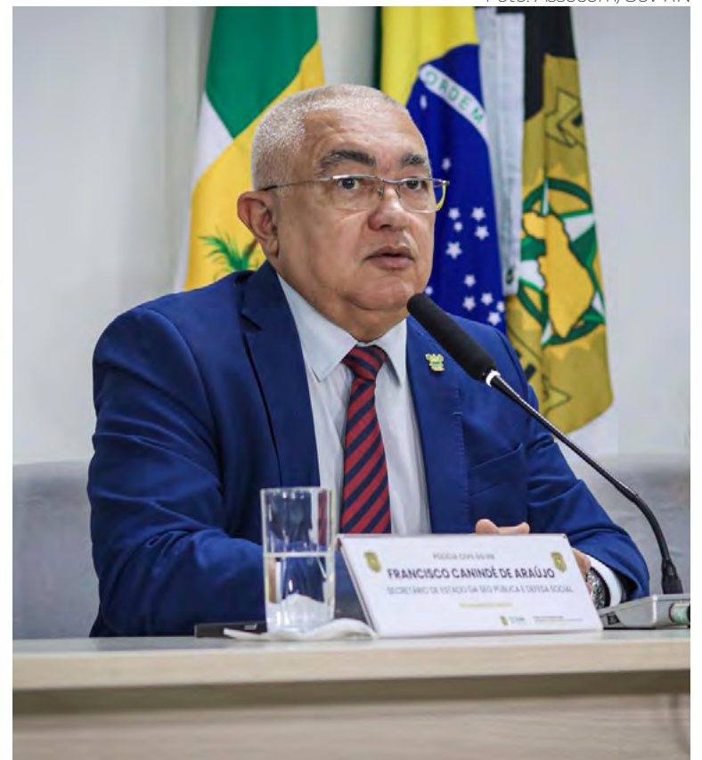
Secretário de Segurança Pública, coronel Francisco Araújo

também prevê envolvimento de políticas sociais, incluindo programas de educação, saúde e aproveitamento de espaços urbanos. “A integração entre segurança pública e políticas sociais é essencial para resultados duradouros. Não se trata de ação pontual”, reforçou Rocha.