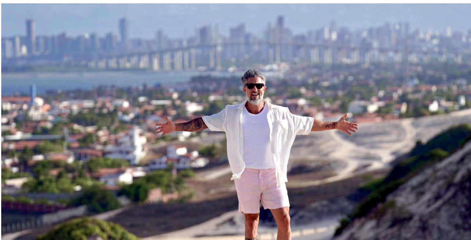
‘Caldeirão com Mion’, da TV Globo, teve gravações em diversas cidades potigües em novembro

Mas o trabalho não pode parar. Precisamos ativar cada ponto da jornada na indústria do turismo, para que ela se fortaleça, crie estrutura sólida e a gente tenha em 2025 mais que um bom momento, mas o ponto de inflexão para um futuro promissor e sustentável.