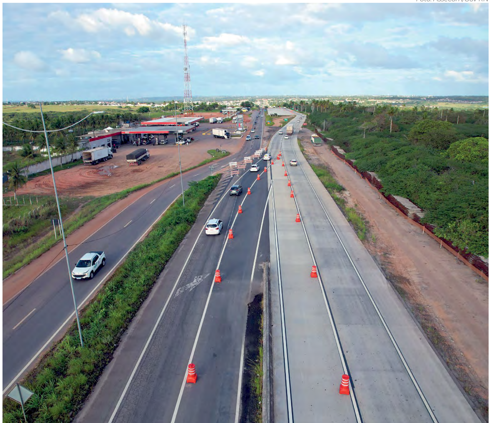
Obra de duplicação da rodovia BR-304 deve gerar aproximadamente 5,5 mil empregos diretos e indiretos

Na área de influência de Mossoró e Assú está concentrada grande parte da produção de frutas e de sal marinho do estado, dois itens relevantes das exportações potiguares.