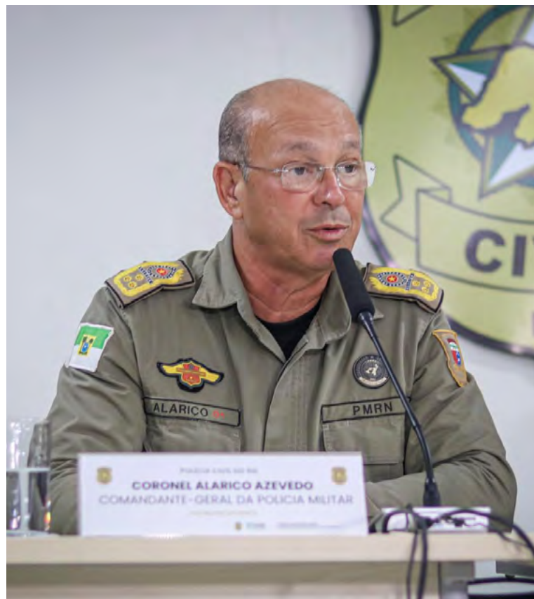
Comandante-geral da Polícia Militar, coronel Alarico Azevedo

O comandante-geral da Polícia Militar, coronel Alarico Azevedo, destacou que conhecimento do terreno e planejamento detalhado são essenciais. “A ope-