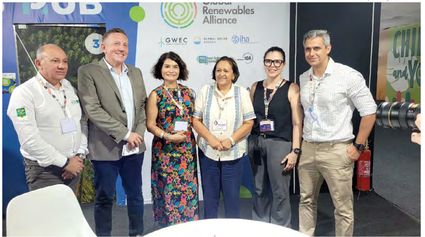
Governadora Fátima Bezerra assinou a adesão ao Compromisso Global de Redes e Armazenamento

A governadora enfatizou o pioneirismo do Rio Grande do Norte ao se tornar o primeiro estado a regulamentar um Fundo Estadual de Combate à Desertificação, um marco para garantir recursos para a recuperação de áreas degradadas. Ela defendeu que essa ação local fortalece a proposta regional do Fundo Caatinga, inspirado no Fundo Amazônia e proposto pelo Consórcio Nordeste para ser gerido pelo BNDES. Segundo Fátima Bezerra, o potencial do Nordeste na transição energética torna “imperativo e obrigatório” o cuidado com a Caatinga, bioma que cobre 90% do território potiguar.