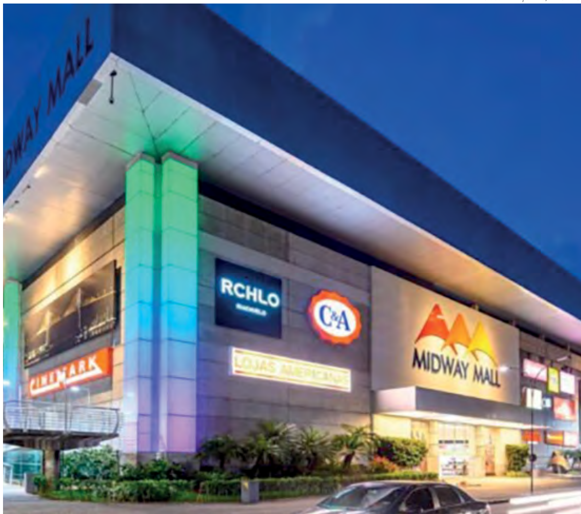
O shopping possui 66,2 mil m² de área bruta locável (ABL) e 235,9 mil m² de área construída