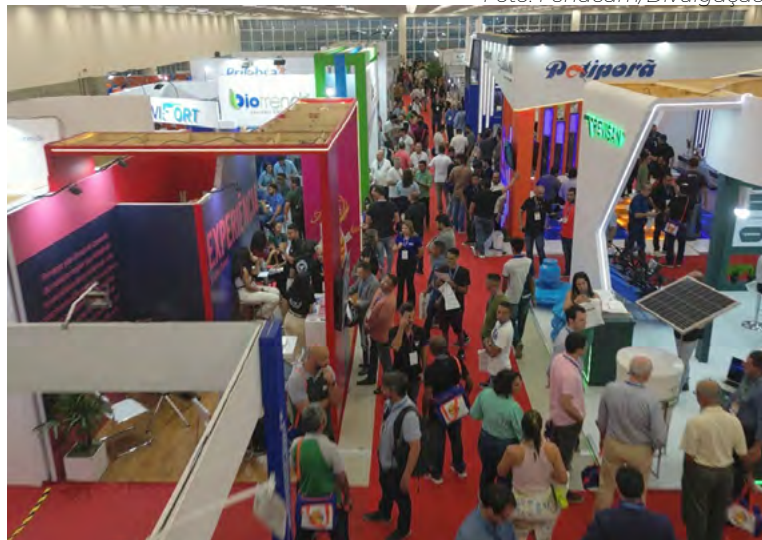
Fenacam acontece no Centro de Convenções de Natal

No cenário global, o cultivo de camarões deve chegar a 7,8 milhões de toneladas em 2025, confirmando o avanço da atividade e o papel do Brasil como um dos sete maiores produtores do mundo. Esse desempenho é sustentado, principalmente, pela força do Nordeste, onde o Rio Grande do Norte, o Ceará e a Paraíba se destacam como líderes da carcinicultura brasileira — uma atividade