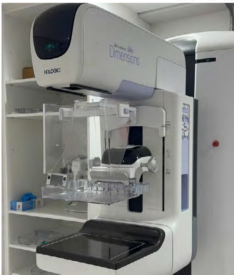
Equipamento de mamografia com tomossíntese

Em 2025, a Unimed Natal lançou a campanha “Ano Rosa”, uma iniciativa que propõe um ci-