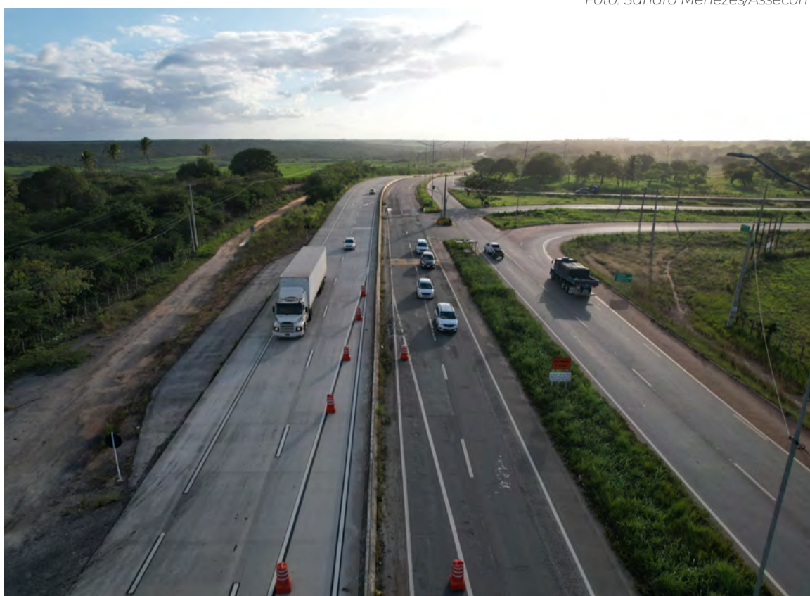
A etapa inicial contemplará a duplicação de aproximadamente 100 quilômetros da rodovia