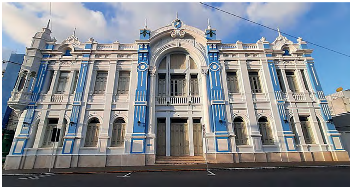
Plano de Financiamento PAC FGTS deve trazer R$ 450 milhões para a capital

Já o eixo qualificação viária, pelo Pró-Transporte, recebe 5,9% (R$ 38,4 milhões), focando na melhoria da infraestrutura de transporte e mobilidade urbana.