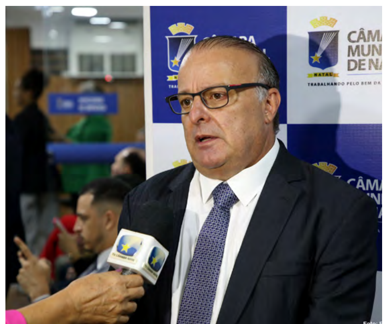
Prefeito Paulinho Freire (União)

Além disso, aproximadamente R$ 35 milhões são destinados a projetos que beneficiarão todo o município, como a expansão da coleta seletiva e a modernização dos serviços de limpeza pública.