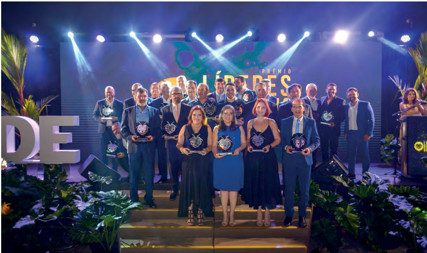
Até o dia 7 de novembro, empresários, executivos e o público em geral poderão participar da escolha dos vencedores

“O Prêmio Líderes do RN é mais do que uma homenagem. É o reconhecimento público de que o Rio Grande do Norte tem empreendedores inovadores, comprometidos com o desenvolvimento sustentável e com a geração de oportunidades. São eles que constroem o futuro do nosso estado”, conclui Valério.