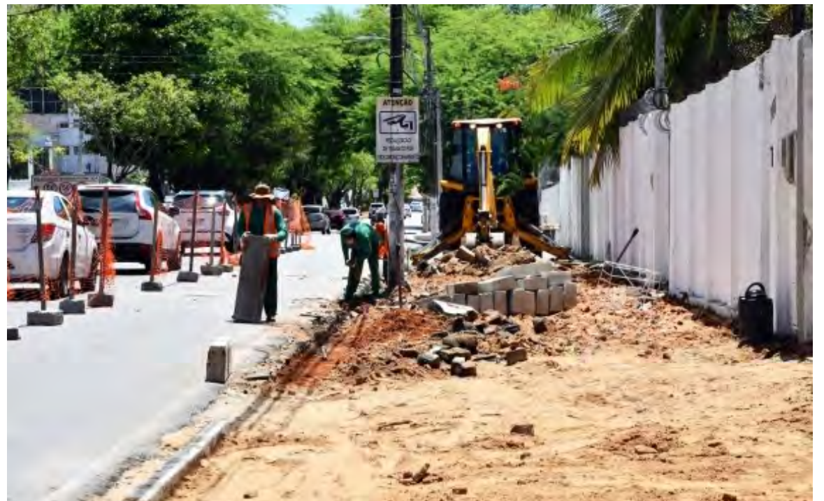
Investimentos preveem obras de reabilitação de áreas urbanas e de qualificação viária