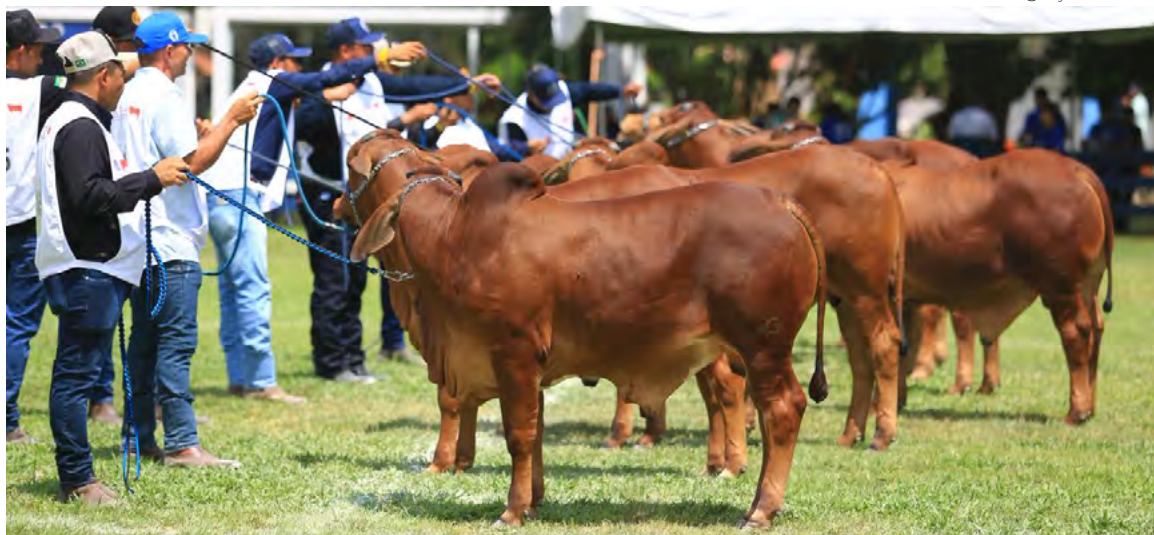
Festa do Boi vai reunir cerca de 600 expositores durante os dias de evento

A Emparn também fará demonstração representativa do Laboratório de Biotecnologia e do Laboratório de Análises (solos, planta, água, adubos orgânicos e rações para consumo animal);