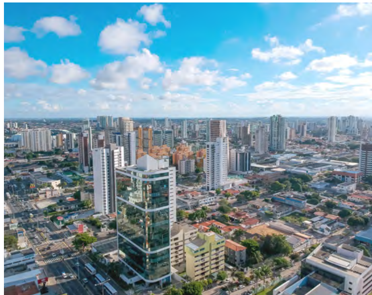
Preço médio do m2 em Natal alcançou R$ 5.944 em julho