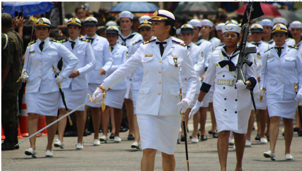
O desfile de 7 de setembro, organizado pela Marinha, está marcado para começar às 8h30

No dia 4, a Banda do 3º Batalhão de Operações Litorâneas de Fuzileiros Navais se apresentará no Natal Shopping, às 19h. Já no dia 5, a Banda de Música da Polícia Militar sobe ao palco do Partage Shopping às 18h30.