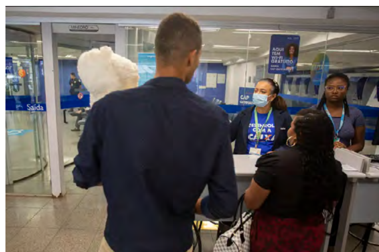
Quase duas mil empresa renegociaram contratos no RN

O Desenrola Pequenos Negócios faz parte do Programa Acredita, que também inclui o ProCred 360, com juros reduzidos para MEIs e empresas com faturamento anual de até R$ 360 mil. O governo destinou R$ 1,5 bilhão em garantias para viabilizar o crédito, resultando em R$ 5 bilhões disponíveis, dos quais R$ 1,4 bilhão já foram emprestados a 47 mil empresas.