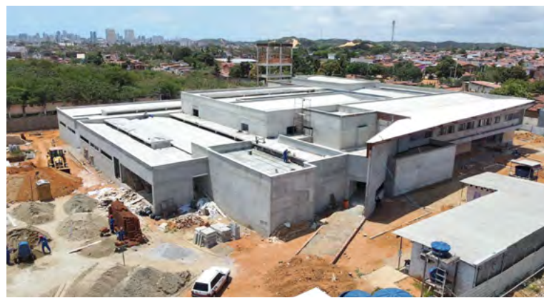
Construção da nova sede do ITEP, na Zona Oeste de Natal