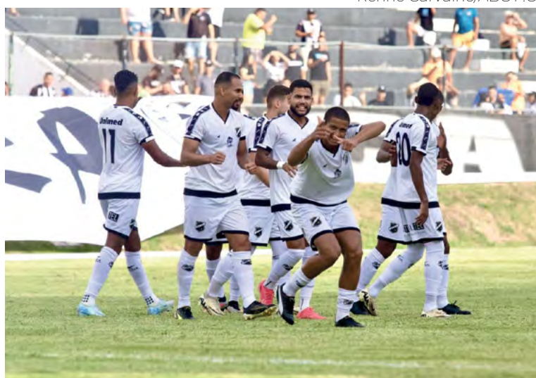
ABC viaja ao Rio de Janeiro para enfrentar Olaria