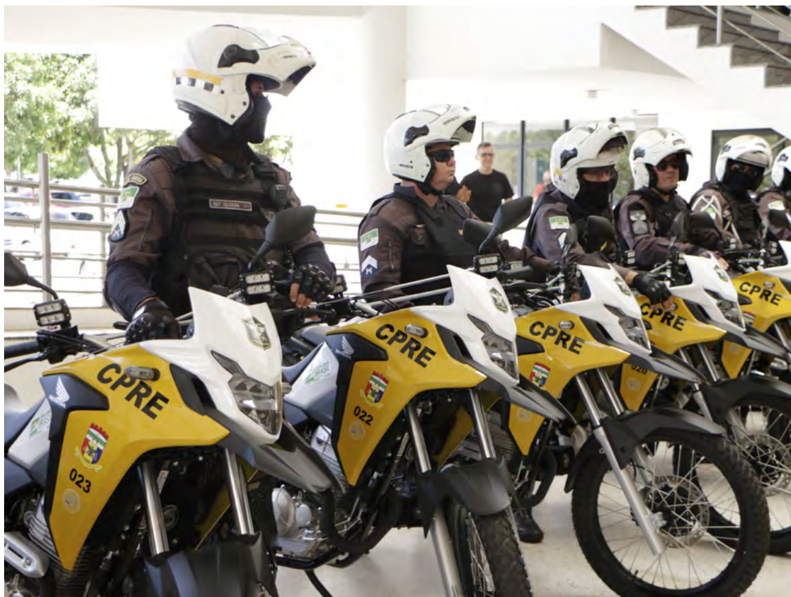
Rio Grande do Norte registrou redução de mais de 22% nos índices de violência em 2024