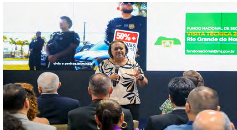
Governadora Fátima Bezerra: "Redução da violência"