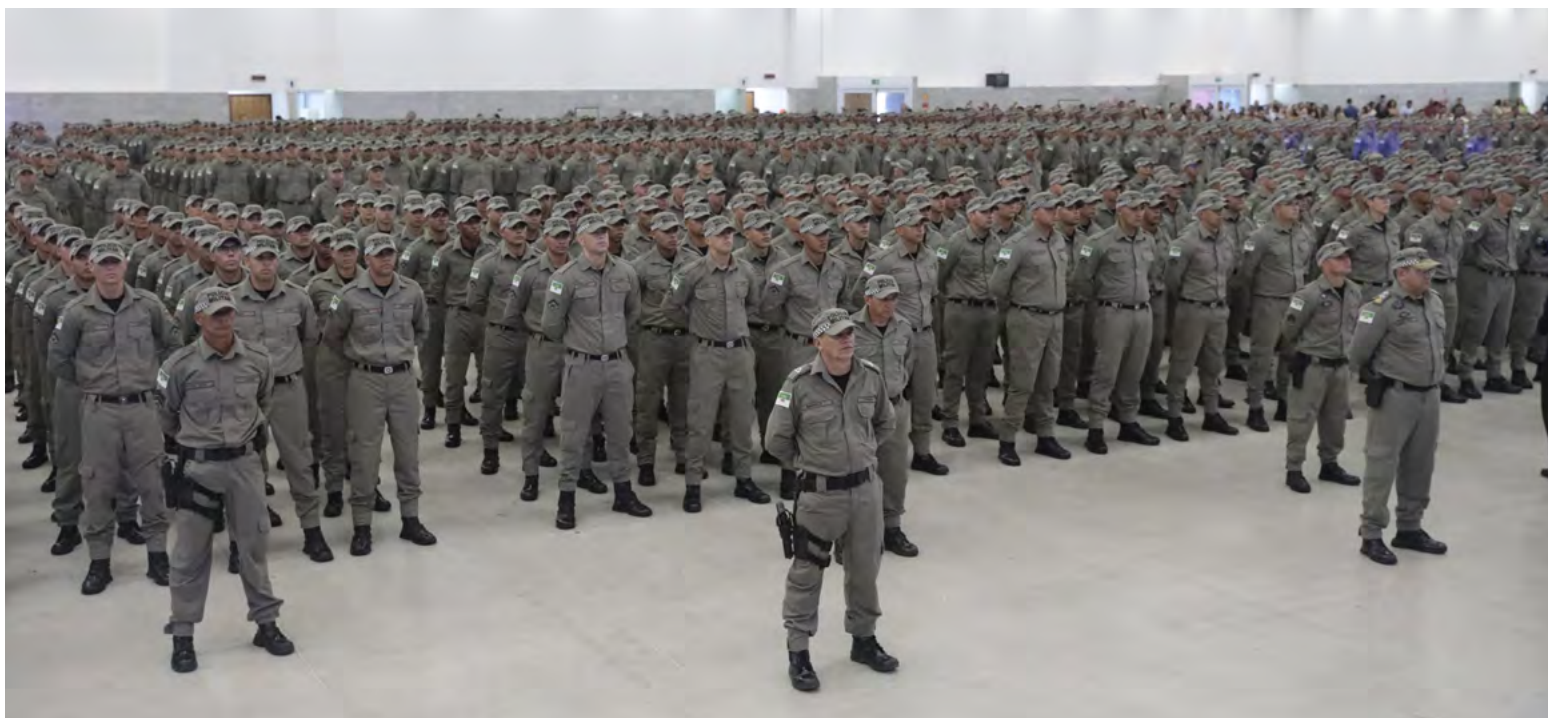
Investimentos permitiram a convocação de mais de 4,6 mil novos agentes de segurança, incluindo a Polícia Militar

O Rio Grande do Norte registrou redução de mais de 22% nos índices de violência em 2024, sendo o estado do Nordeste com maior queda e o quarto no país. Natal foi citada como a capital