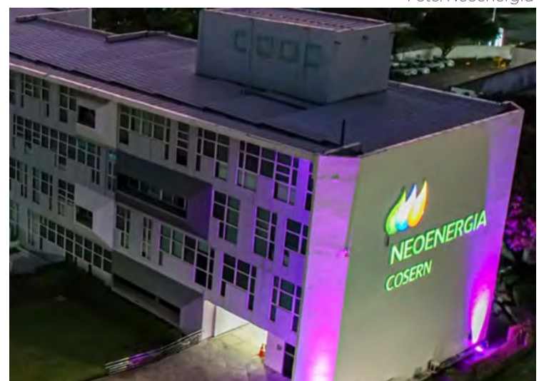
Sede da Neoenergia Cosern