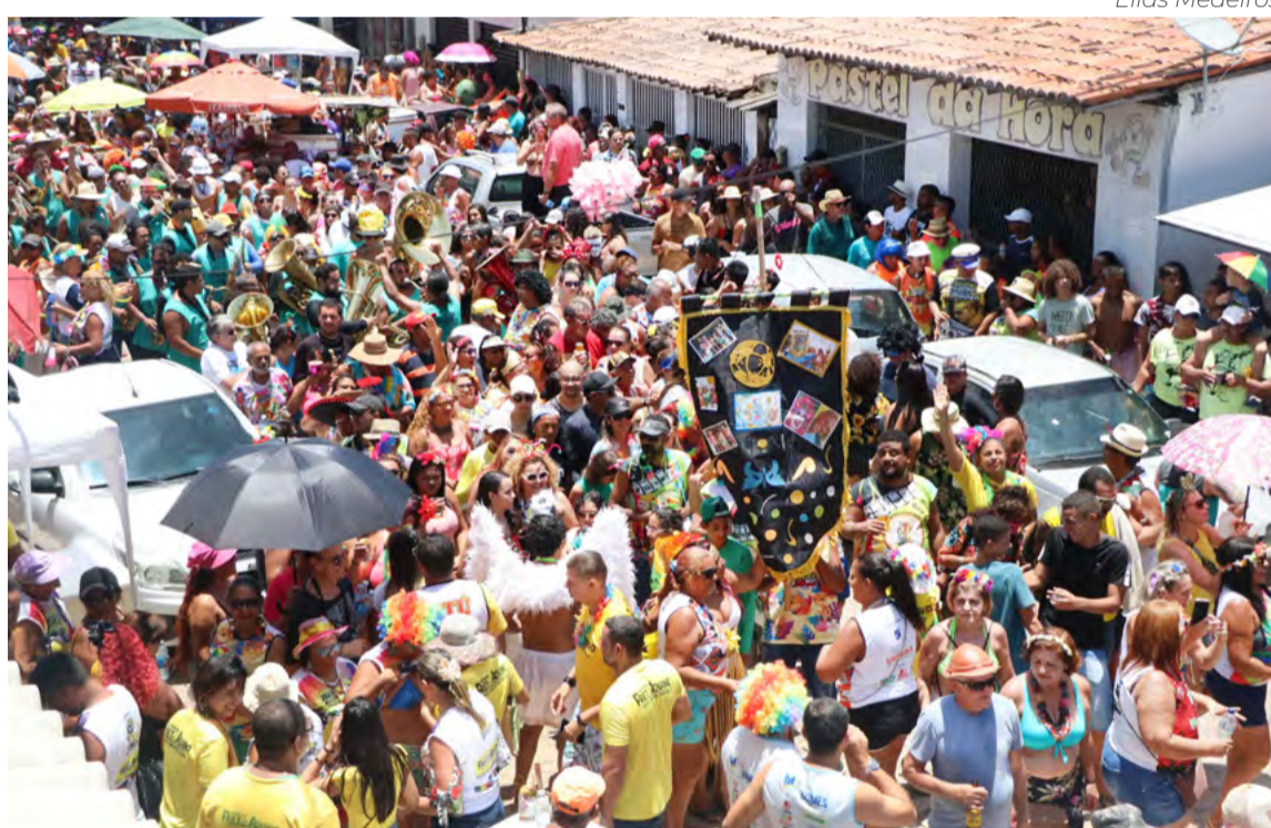
Tradicional bloco carnavalesco Baiacu na Vara desfila pelas ruas da Redinha na quarta-feira (05)