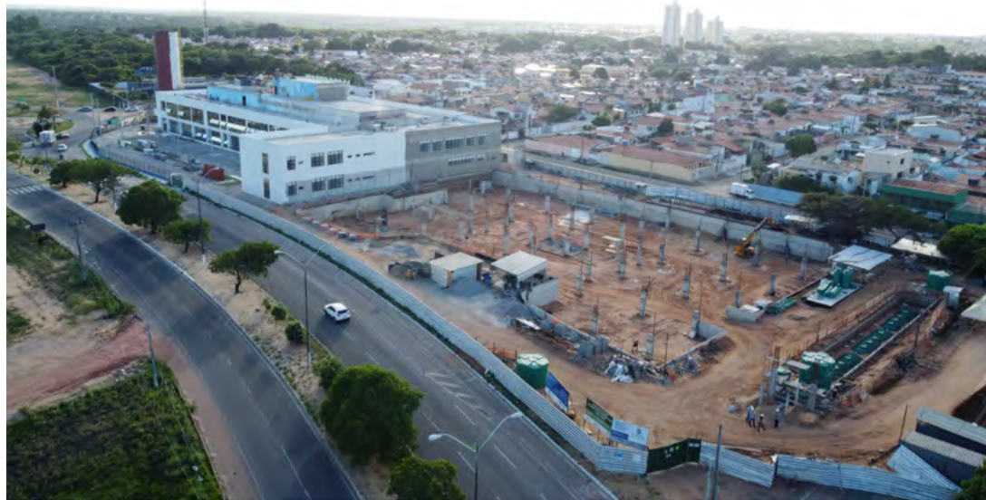
Construção do novo hospital municipal está estimada em R$ 140 milhões

Dois meses depois de inaugurado, o espaço segue sem funcionamento, pois as obras