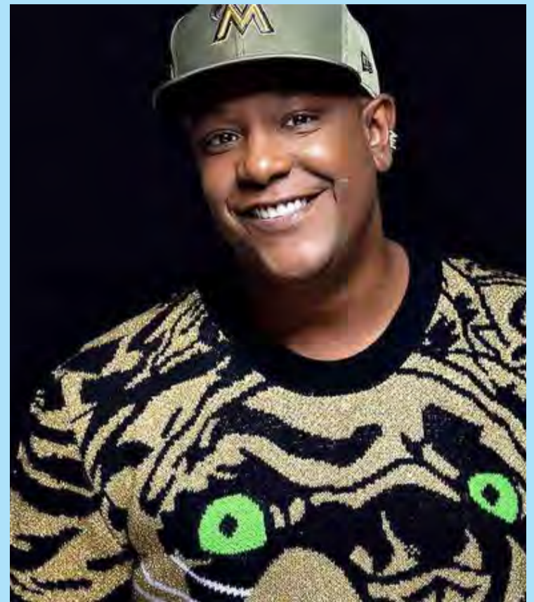
Márcio Victor, vocalista da banda Psirico

O encerramento do Carnaval acontece na terça-feira (4), com apresentações de Yure Lima, Léo Patrício e Tháбата Medeiros na Praça São Sebas-