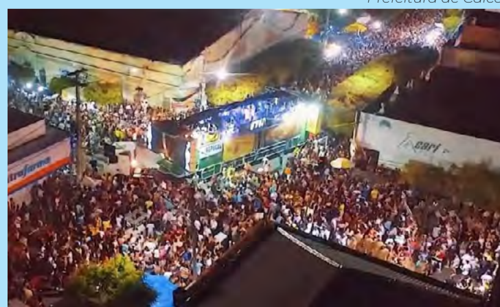
Festejo carnavalesco percorre as principais vias de Caicó