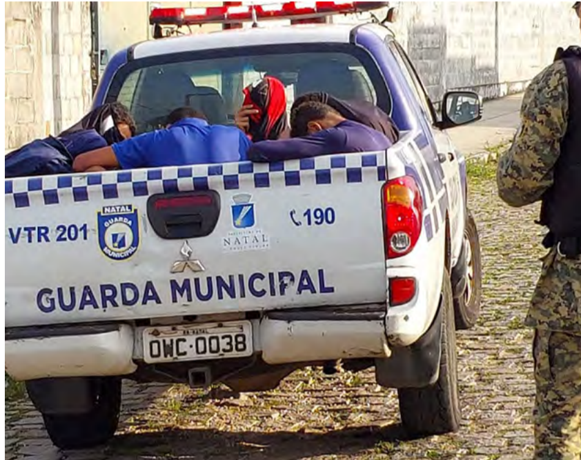
Apenas 35 dos 167 municípios do Rio Grande do Norte (20%) possuem guarda civil municipal, segundo dados do IBGE

De acordo com a Pesquisa de Informações Básicas Municipais (Munic) do Instituto Brasileiro de Geografia e Estatística (IBGE), apenas 35 dos 167 municípios do Rio Grande do Norte (20%) possuem guarda civil municipal. Estas cidades somam 1.426 agentes, sendo 1.237 homens e 189 mulheres. Entre esses municípios, apenas