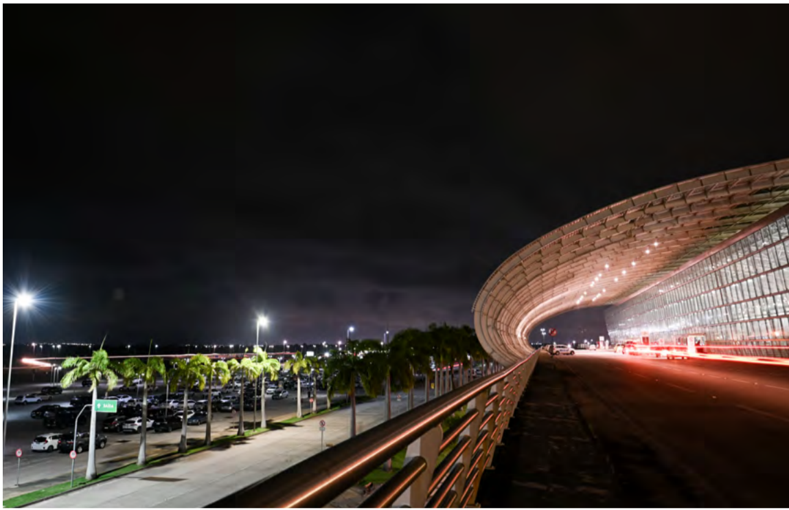
Zurich Airport Brasil assumiu a gestão do Aeroporto de Natal em 19 de fevereiro de 2024