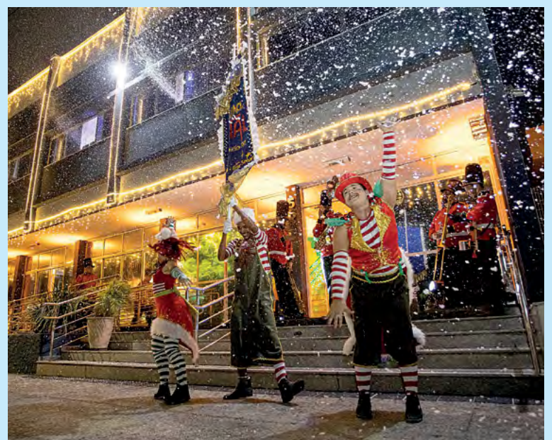
Programação contempla ações de responsabilidade social e ambiental