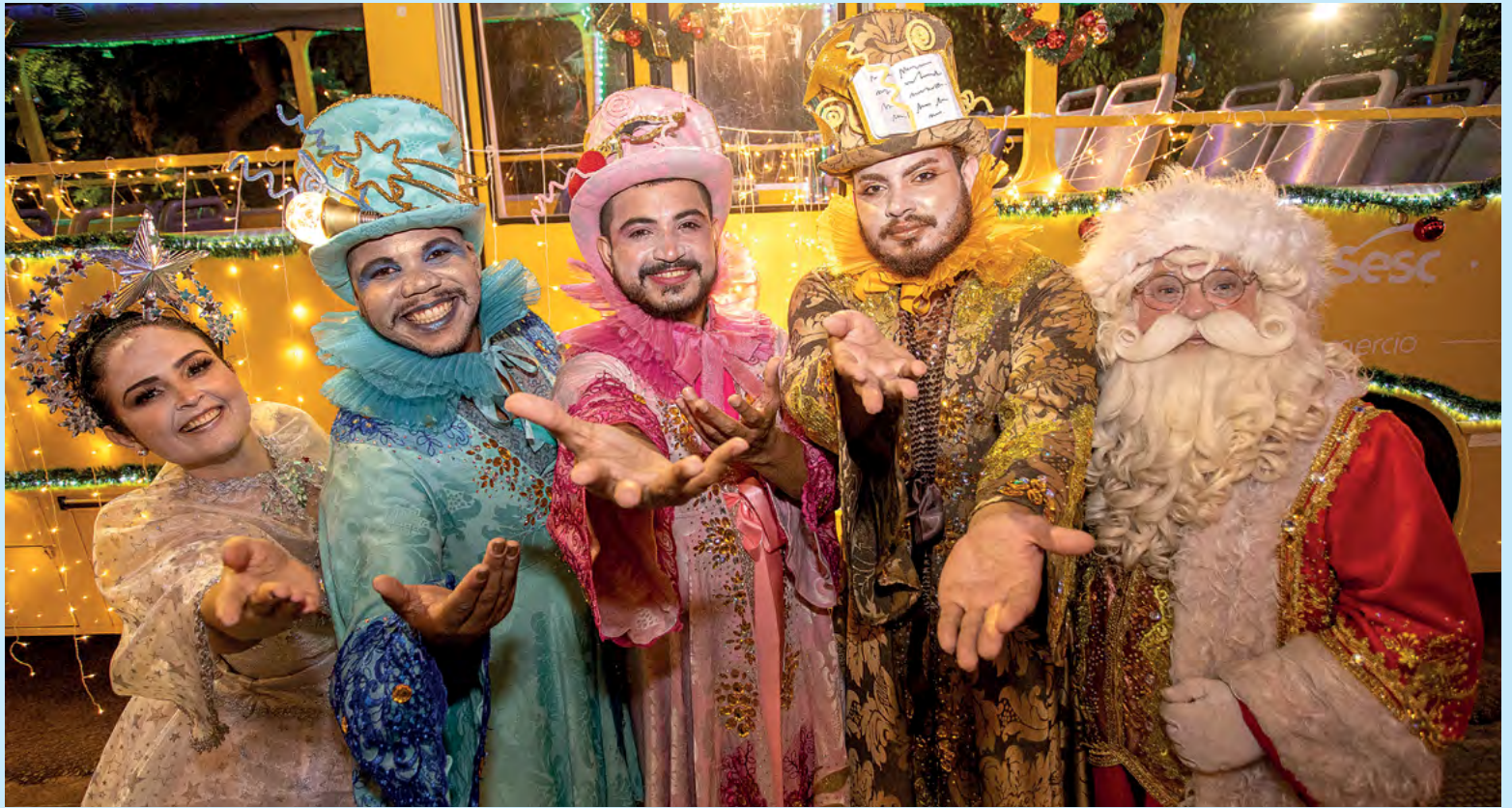
O Palco Sesc receberá atrações como a Orquestra do Papão, Ballet Sesc e o Coral do Trabalho Social com Idosos

Com programação diversificada e foco na valorização da cultura e do comércio local, o Brilha Natal Fecomércio RN promete ser uma das grandes celebrações deste fim de ano em Natal.