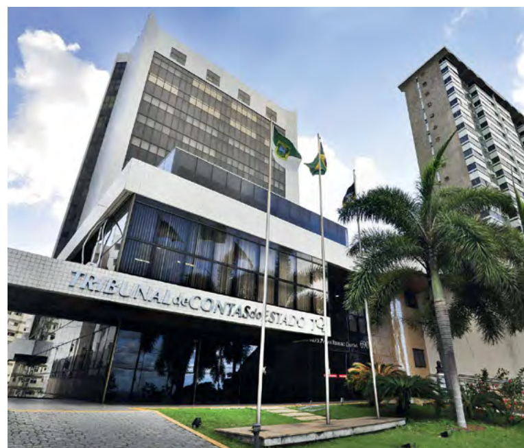
Tribunal de Contas questiona pontos do processo licitatório

Valor total previsto: R$ 637 milhões Custo mensal da operação: R$ 10 milhões Valor mensal com coleta domiciliar: R$ 5,6 milhões Lixo domiciliar a ser recolhido: 18,3 mil toneladas/mês