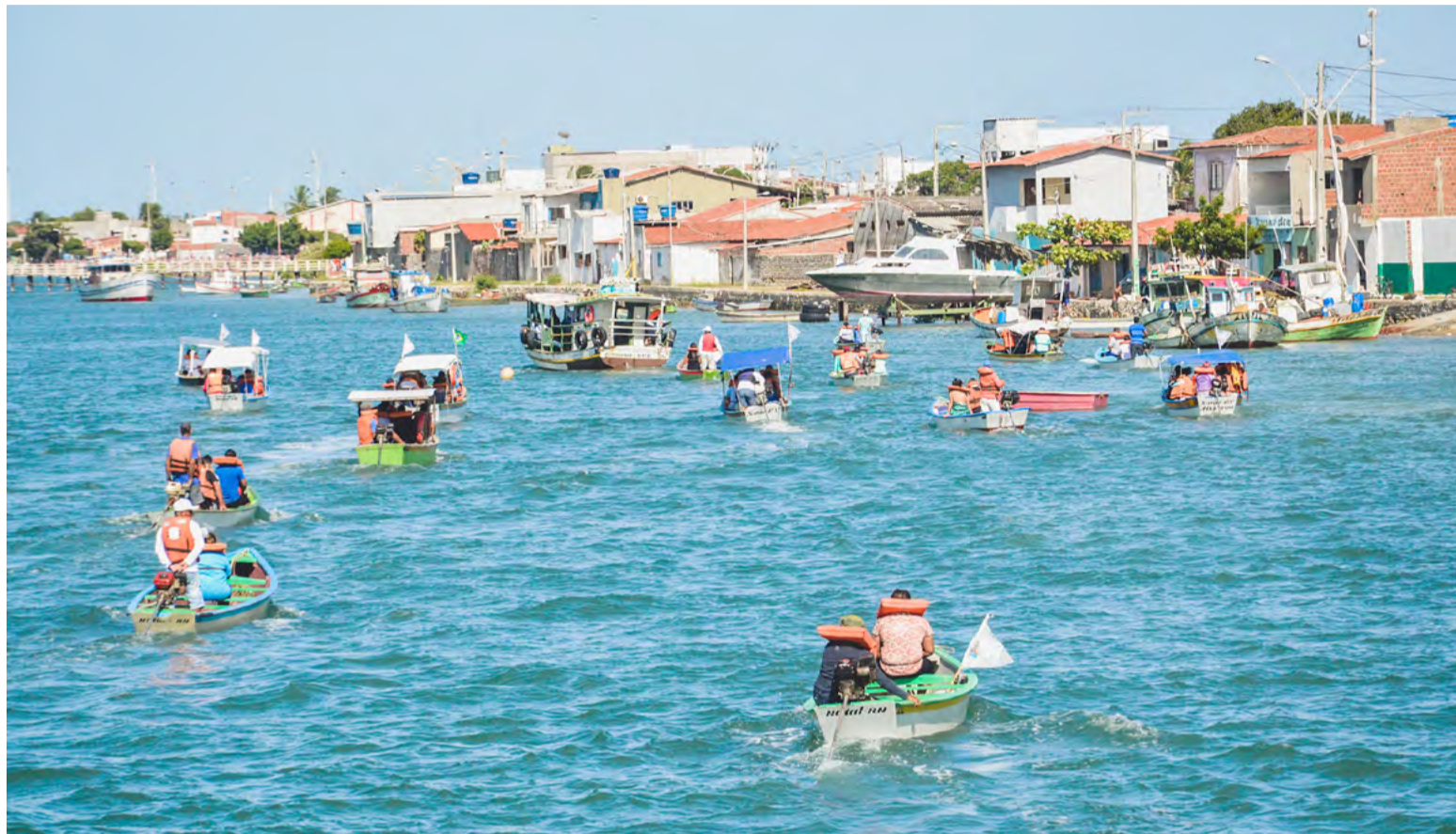
Guararé será a terceira prefeitura com maior aumento de recursos, estimado em R$ 13 milhões