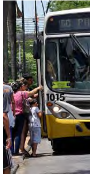
Tarifa em Natal subiu R$ 0,40

Além do reajuste na tarifa comum, o decreto define valores diferenciados para outras cate-