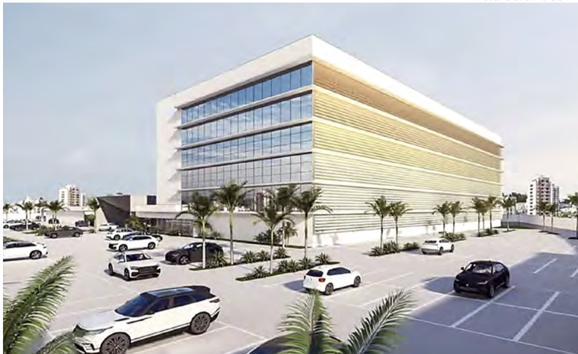
Com 350 leitos, o novo hospital será construído no bairro de Emaús, em Parnamirim

A governadora Fátima Bezerra iniciou seu pronunciamento à imprensa lembrando as dificuldades que o Governo do RN passou nos anos anteriores. E que uma das maiores dificuldades foi a perda de arrecadação causadas pelas