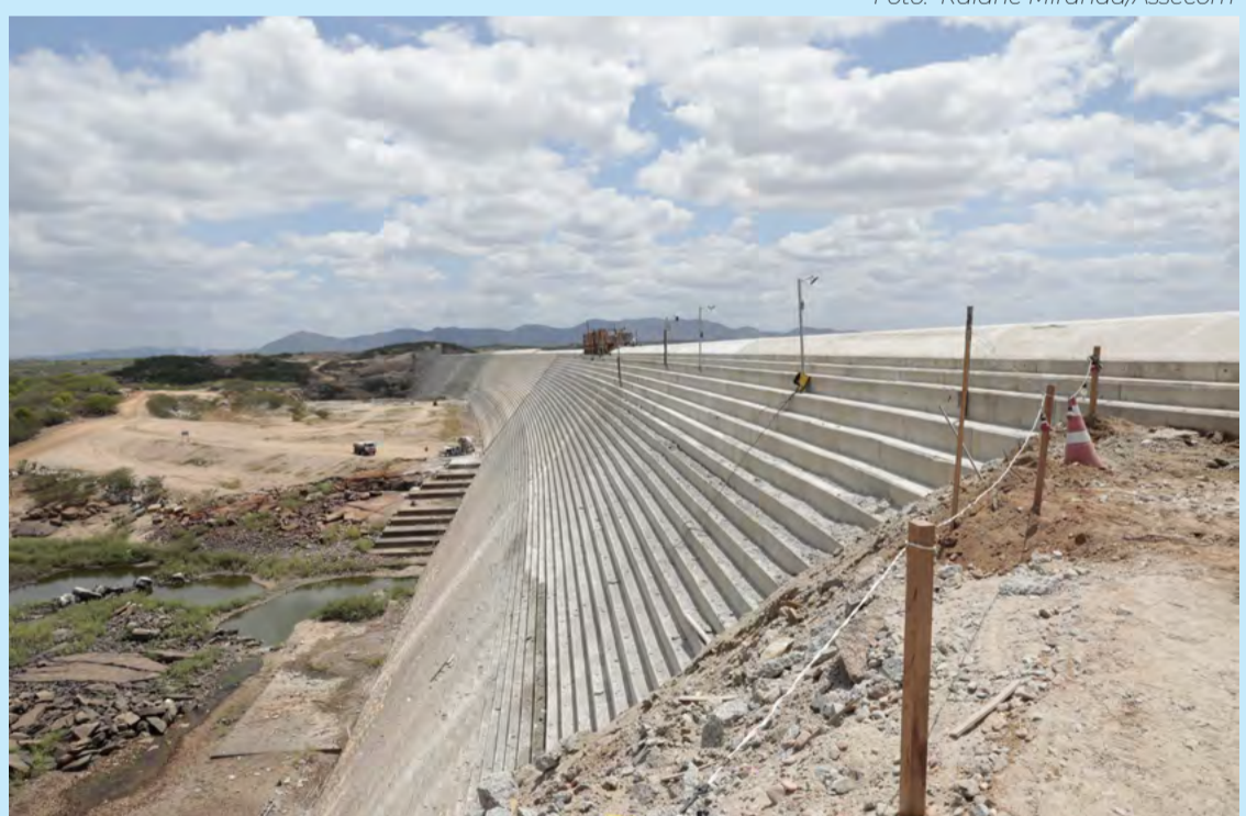
Barragem de Oiticica terá capacidade para armazenar 600 milhões de metros cúbicos

A obra, considerada estratégica para o estado, tem como principal objetivo armazenar