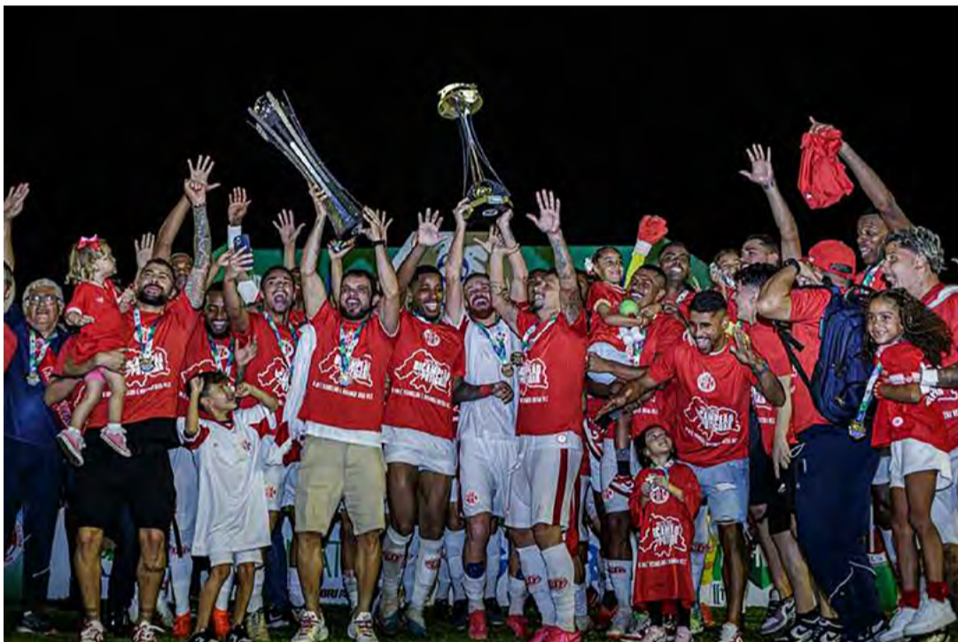
América, clube com maior investimento no RN, conseguiu ser campeão estadual