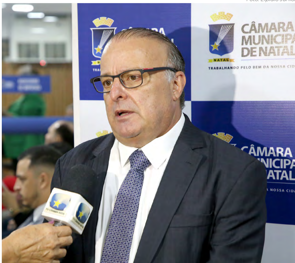
Paulinho Freire (União) assume a Prefeitura do Natal a partir de 1º de janeiro

O candidato tem como principal proposta a implementação do programa “Fila Zero”, que visa garantir vagas para todas as crianças em creches, priorizando as regiões mais necessitadas. Ele propõe a ampliação do número de vagas na educação infantil, com a construção de novos Centros Municipais de Educação Infantil (CMEIs) e a implantação de escolas de educação em tempo integral.