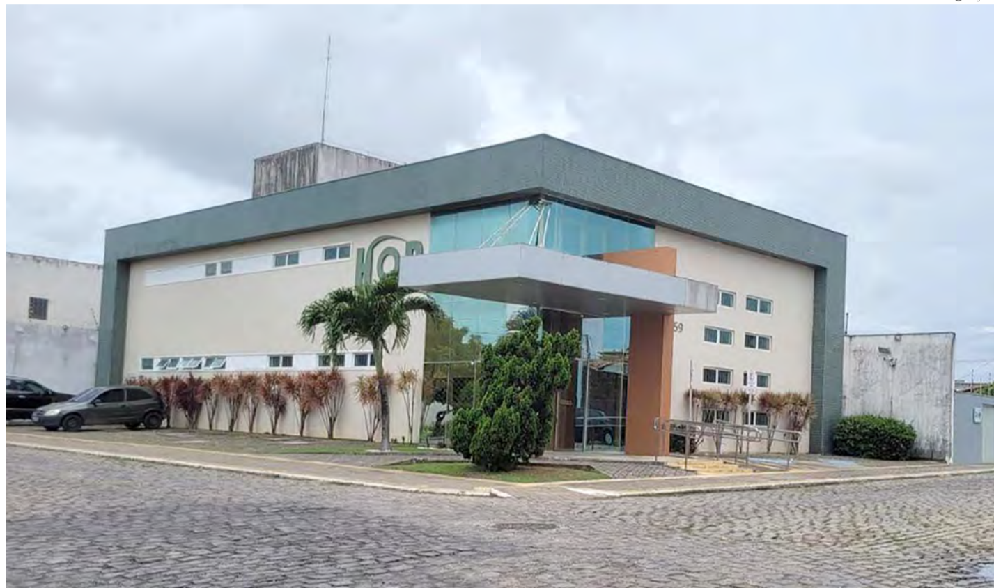
Hospital de Olhos de Parnamirim é referência no tratamento oftalmológico na região da Grande Natal

Os detalhes dessa virada de chave na vida profissional estão na entrevista a seguir: