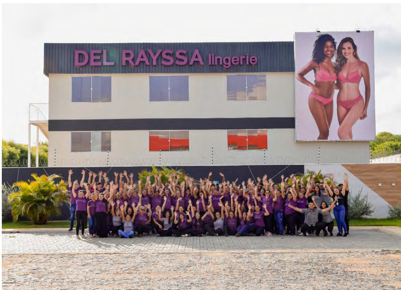
Del Rayssa possui a capacidade de produção 160 mil de peças mensal e pretende chegar a 200 mil mês

Essa dedicação gerou frutos para a empresária. Hoje, Fátima consegue trabalhar menos horas, confiando em uma equipe