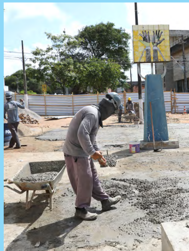
Serviços incluem recuperação de piso, de bancos, sinalização, ambientação, iluminação e paisagismo