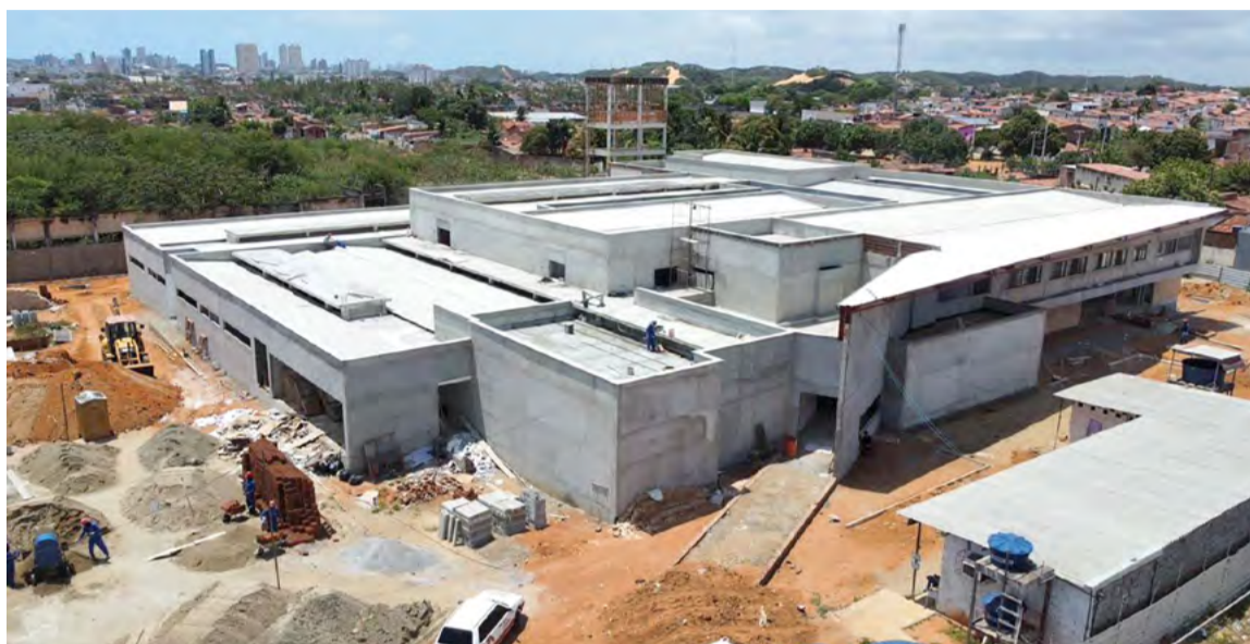
Erguida no bairro de Felipe Camarão, a nova sede do Itep está orçada em R$ 22,6 milhões

O somatório das ações de gestão faz cair os índices de criminalidade. No estado, roubos em comércios caíram 26% este ano, de janeiro a setembro, na comparação com o igual período do ano passado. Roubos a residências foram 14% menos no mesmo perí-