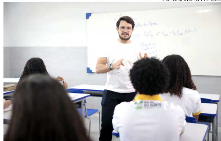
Vagas são para professores em diversas disciplinas

O Governo do Rio Grande do Norte está realizando um novo concurso para preenchimento de 598 cargos de Professor e Especialista em Educação, além de formação de cadastro de reserva que poderá ser utilizado durante a validade do certame. A iniciativa visa suprir a necessidade de reposição de vacâncias decorrentes de aposentadorias e falecimentos, bem como antecipar futuras vacâncias previstas até 2026. O anúncio da publicação do edital foi feito pela governadora Fátima Bezerra na simbólica data de 15 de outubro, quando se celebra o Dia do Professor.