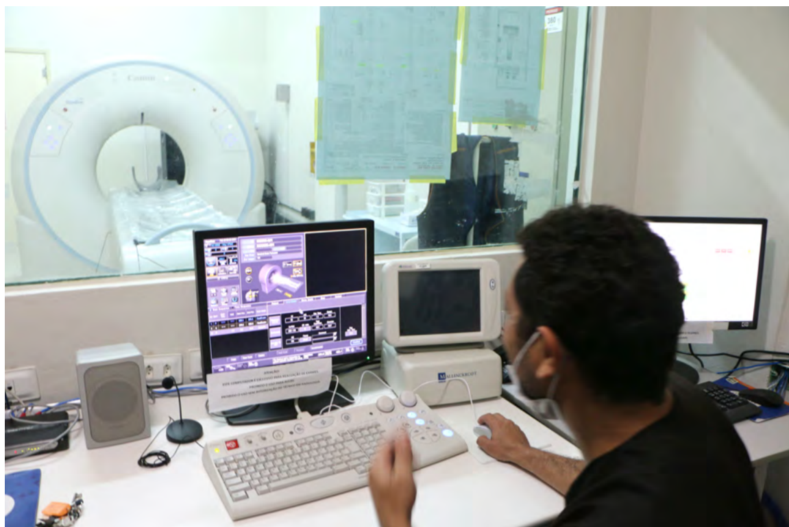
Novo tomógrafo do Hospital Regional Tarcísio de Vasconcelos Maia, localizado em Mossoró