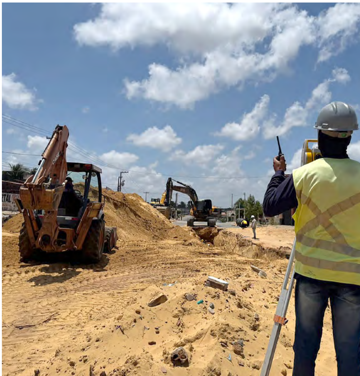
Serviços beneficiarão moradores da ZN e dos municípios limítrofes - SGA e Extremoz