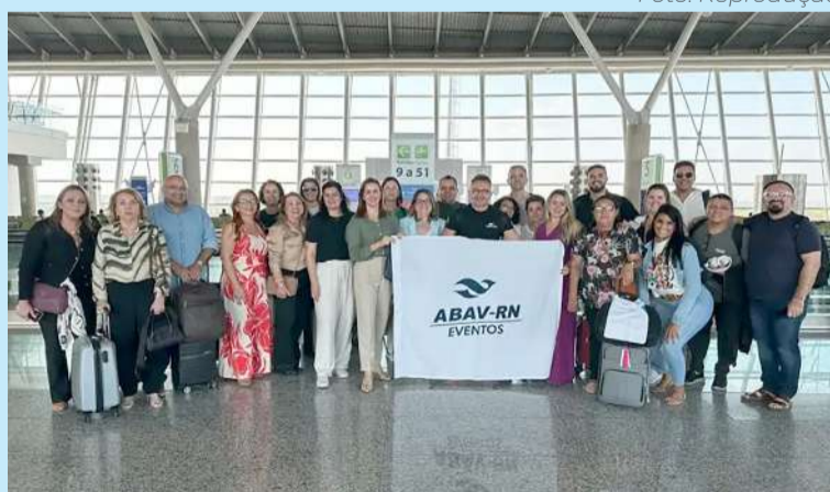
Comitiva do RN quer desenvolver turismo regional e local

Realizado no Centro Internacional de Convenções do Brasil (CICB), o evento contou com 198 estandes e cerca de 1,5 mil marcas expositoras. Este ano, 22 países participaram como expositores, o dobro em comparação ao ano anterior, além de repre-