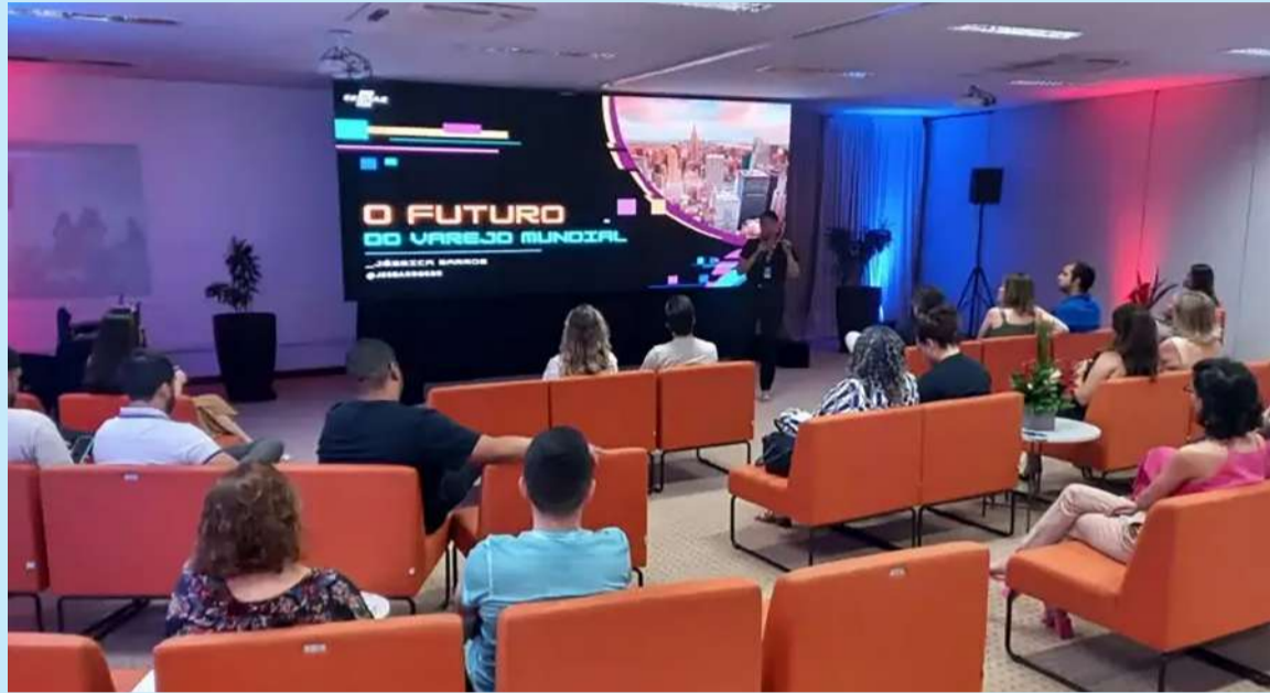
Encontro detalhou requisitos para integrar a Missão, lojas presentes no roteiro e palestras previstas

A programação da Missão Sebrae NRF 2025 inclui a curadoria das mais de 170 palestras, conduzidas por 450 especialistas do evento, além de acesso a aproximadamente mil expositores e visitas a 24 lojas de referência. A Missão, ocorrerá entre 8 e 15 de janeiro de 2025, contemplando mais dias que o evento, que