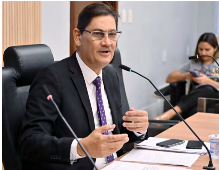
Secretário Estadual de Administração, Pedro Lopes