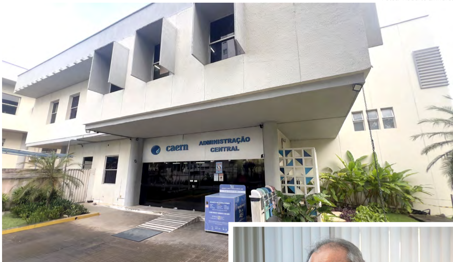
Investimentos em saneamento básico somam R$ 1 bilhão

Com um orçamento total passando de R$ 1 bilhão, as obras de universalização do atendimento de esgoto em Natal foram iniciadas entre os anos de 2016 e 2017, e contam com investimen-