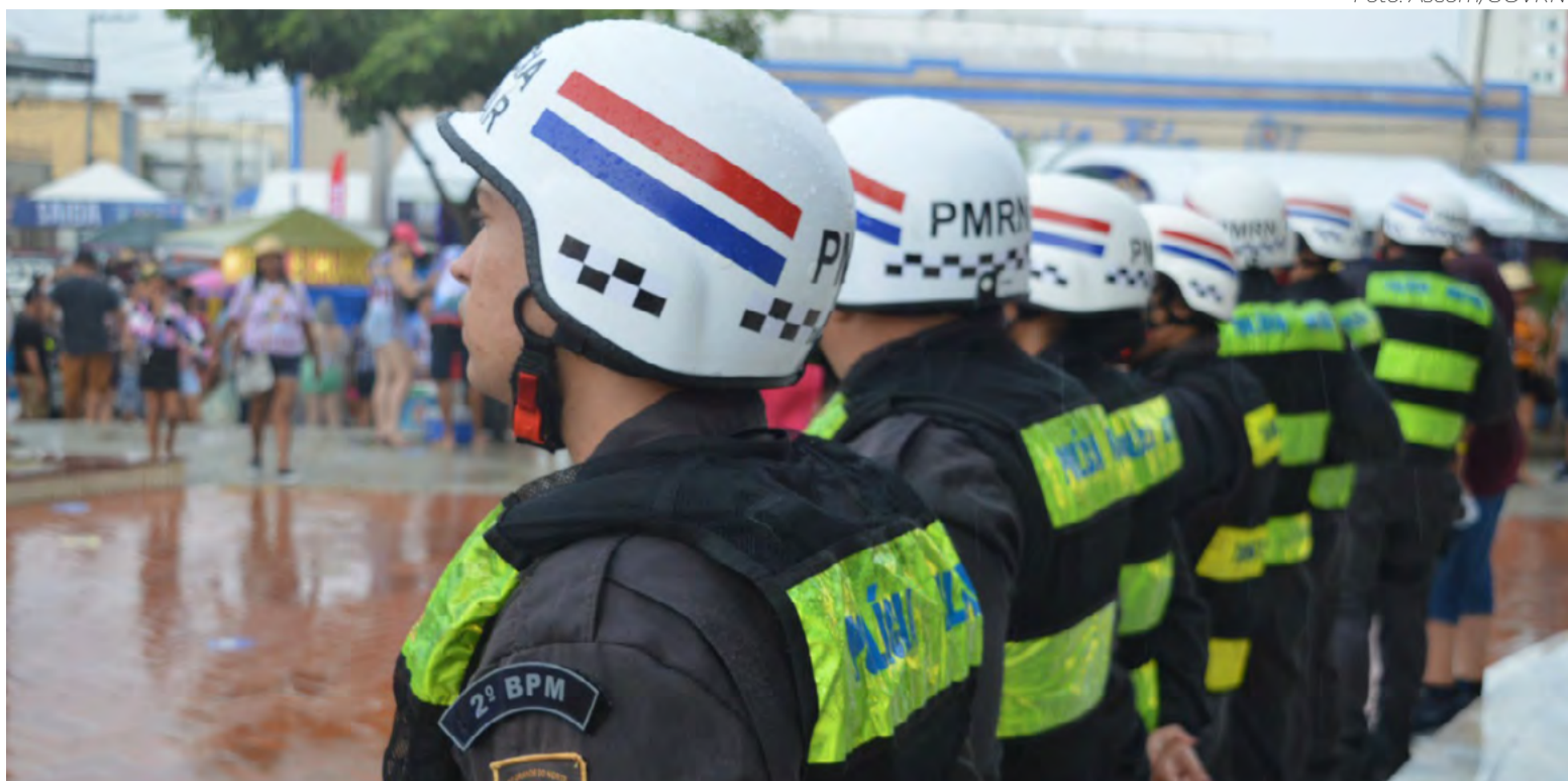
Os servidores da Polícia Militar do Rio Grande do Norte estão entre os beneficiados com a medida de recomposição salarial

Os projetos que compõem o pacote de recomposição salarial no RN já estão prestes a serem enviados para que os deputados comecem a debater o assunto. E trazem em seu escopo uma condicionante que deve fazer com