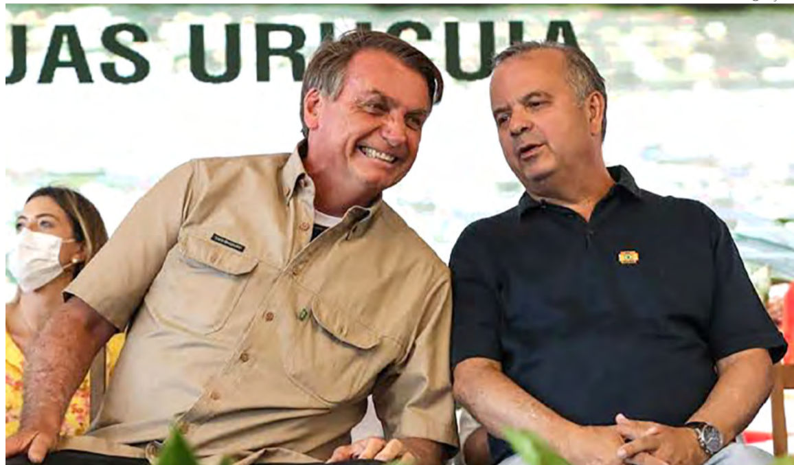
Ex-presidente Bolsonaro ao lado do senador e presidente do PL/RN, Rogério Marinho