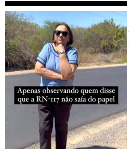
Apenas observando quem disse que a RN-117 não saía do papel