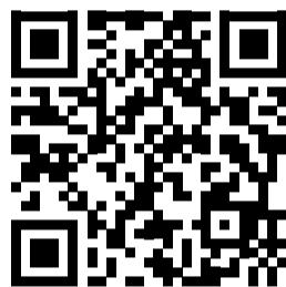
Aponte a câmera do seu telefone para o QR Code

Para quem deseja apoiar os atletas com qualquer valor e contribuir com a realização deste sonho, a campanha de arrecadação está disponível no link: https://www.vakinha.com.br/5007504 .