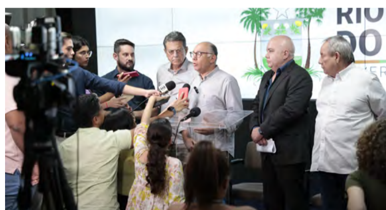
Governo realizou coletiva na tarde desta segunda, 8

A engorda é um aterro que será colocado ao longo de 4 quilômetros na enseada de Ponta Negra, com o objetivo de alargar a faixa de areia nas praias de Ponta Negra e parte da Via Costeira para até 100 metros na maré baixa e 50 metros na maré alta. Estima-se que serão utilizados cerca de 1,1 milhão de metros cúbicos de areia para a obra. Os trabalhos incluirão o uso de uma draga de sucção, que depositará a areia em trechos de 200 metros na praia.