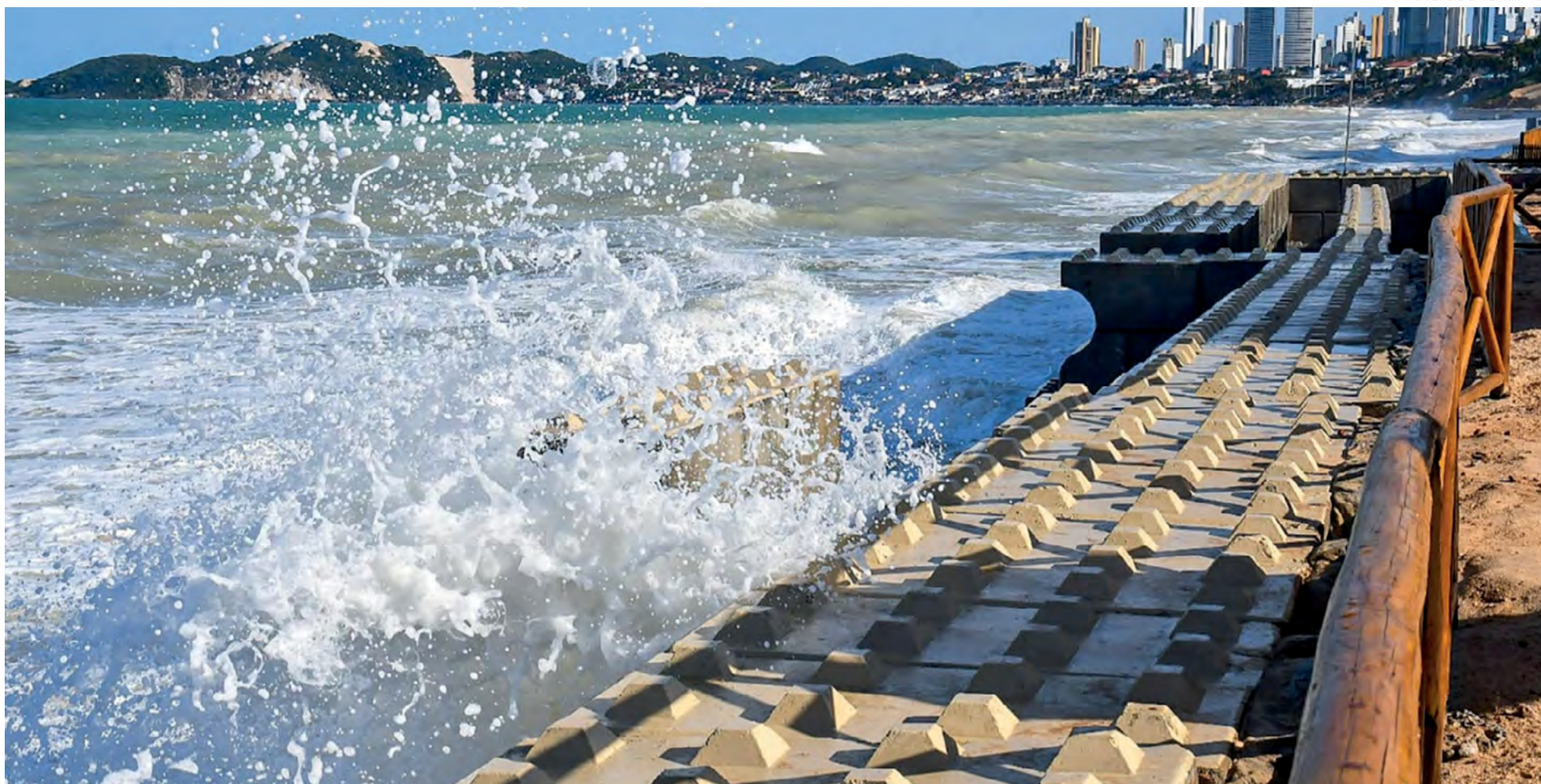
A engorda é um aterro que será colocado ao longo de 4 quilômetros na enseada de Ponta Negra