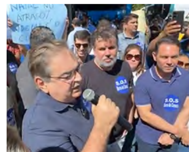
Prefeito Álvaro Dias participa de protesto

Gabinete Civil do Rio Grande do Norte, Raimundo Alves, repudiou a ocupação realizada pelos manifestantes. “Foi uma coisa altamente vergonhosa. O governo quer repudiar essa atitude. Ameaçando servidores, ameaçando bolsistas, trazendo inclusive prejuízos ao patrimônio público. Isso tudo vai ser apurado”, disse.