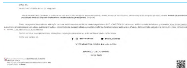
Intimação das testemunhas de defesa