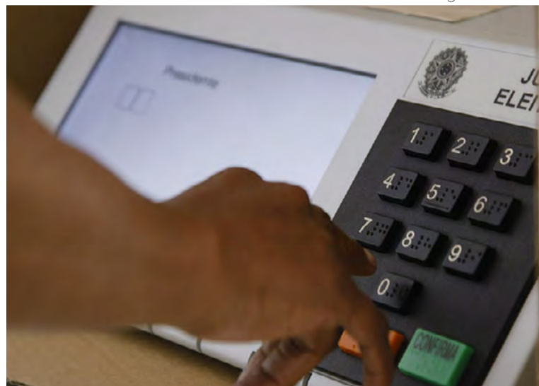
Eleições municipais acontecem em 6 de outubro