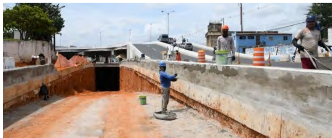
Trincheira do “Viaduto da Urbana” deve ser entregue pela Prefeitura até o mês de julho