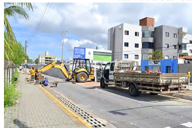
Macro drenagem na Avenida Jerônimo Câmara