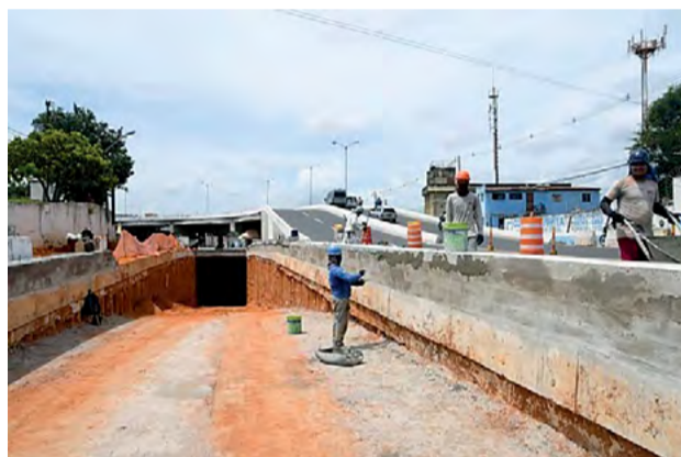
Trincheira do "Viaduto da Urbana"