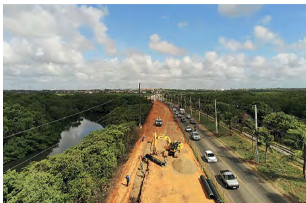
Reestruturação da Avenida Felizardo Moura