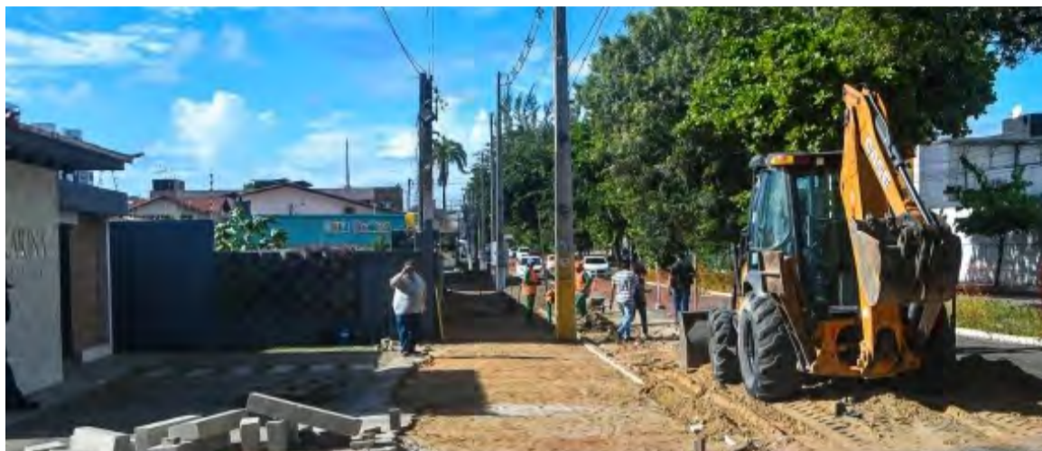
Obra de macrodrenagem na Avenida Jerônimo Câmara deve ser concluída ainda este ano

Já o trecho que corresponde à trincheira do “Viaduto da Urbana” deve ser entregue pela Prefeitura até o mês de julho. Já o prolongamento da rua Riacho das Lavadeiras até a Avenida Mor-Gouveia, a previsão de entrega é para o mês de setembro.