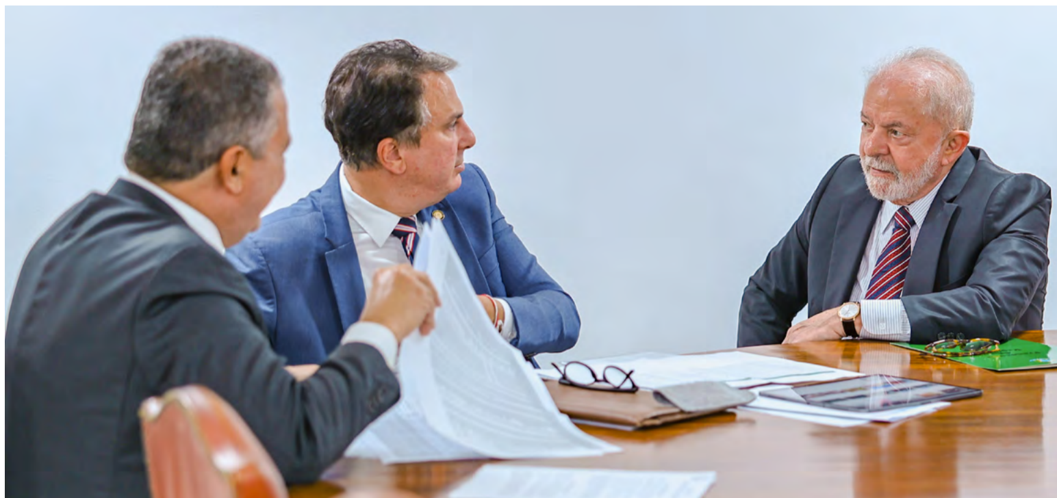
Presidente Lula se reúne com o ministro da Educação, Camilo Santana (centro), e o chefe da Casa Civil, Rui Costa