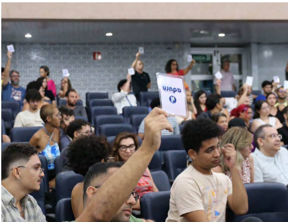
UFRN se junta a mais de 50 universidades que estão em greve em todo país

A UFRN ainda informou que a Pró-Reitoria de Gestão de Pessoas (Progesp) criou uma Comissão Interna de Mediação Organizacional durante a paralisação, visando manter diálogo permanente com os servidores para dar encaminhamentos durante o período de greve.