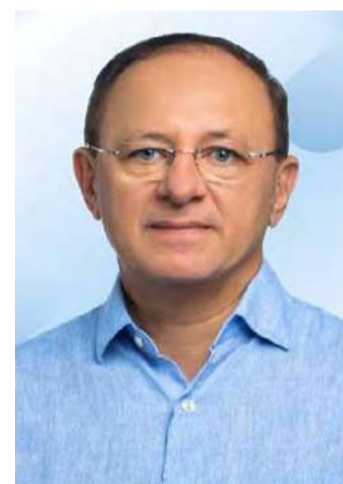
Deputado Benes Leocádio