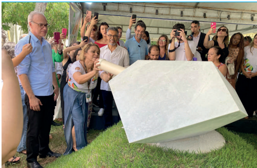
Cápsula foi instalada no parque do Museu Câmara Cascudo

O Museu Câmara Cascudo da UFRN (MCC) ganhou nesta segunda-feira (22) uma cápsula do tempo que guardará mensagens para o futuro. Com realização da Organização Atitude Social e Ambiental (OASA) em parceria com a Instituição, e apoio de diversas organizações públicas e privadas, a estrutura deve ser aberta somente daqui a cinquenta anos, quando serão lidas cerca de trezentas cartas enviadas por representantes da sociedade potiguar. O projeto prevê, ainda, uma cápsula virtual com mensagens em vídeo que também só serão visualizadas em 2074.