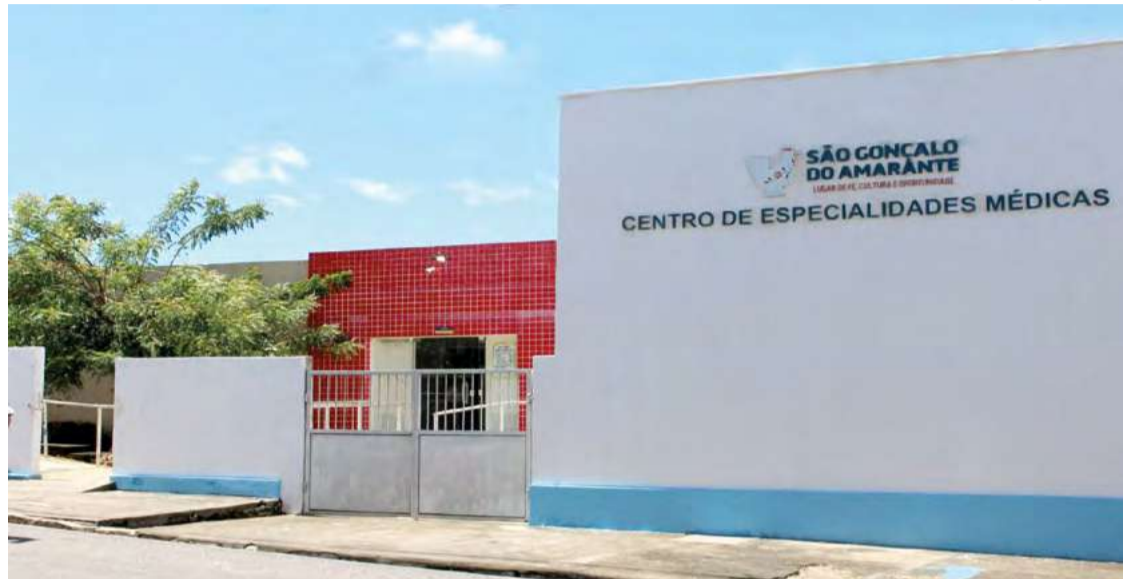
Atendimento estendido tem caráter experimental e será implementado nos demais bairros

O atendimento estendido nesta UBS tem caráter experi-mental e pode ser implementa-do nos demais bairros da cidade conforme demanda da popu-lação e estudo técnico da SMS São Gonçalo.