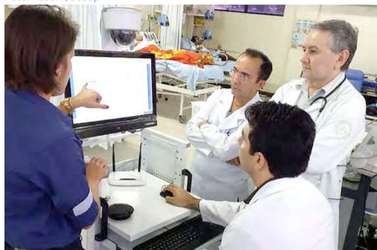
Programa está atendendo as oito regiões de saúde do Estado

O Rio Grande do Norte é pioneiro no país no uso da telemedicina como programa de assistência à saúde. A ferramenta é utilizada para diagnóstico de condições cardíacas. Através do uso do eletrocardiograma (ECG), a rede estadual de saúde pública consegue analisar o ritmo cardíaco e a saúde geral do músculo do coração do paciente, identificando diversas condições como taquicardias, bloqueios, sobrecargas de câmaras cardíacas, isquemias e infartos.