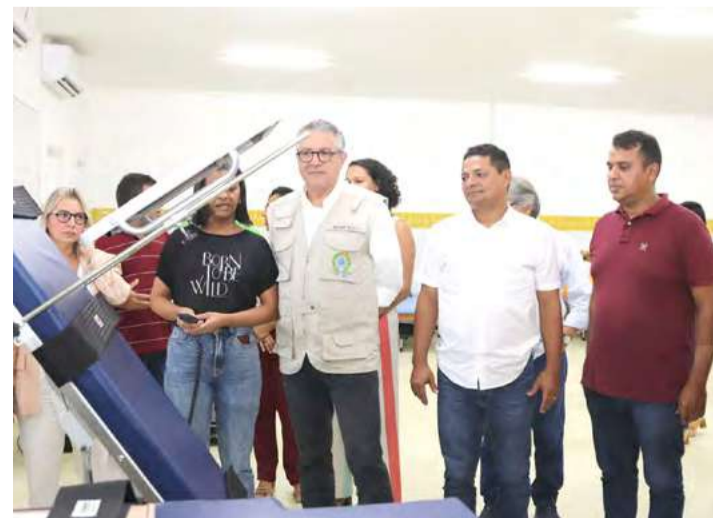
Investimento vai ampliar serviços de saúde na cidade