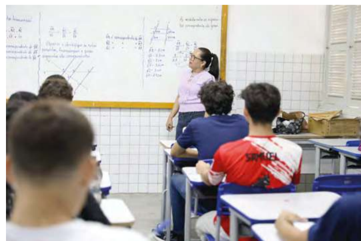
Mais de 60 mil alunos serão beneficiados no RN