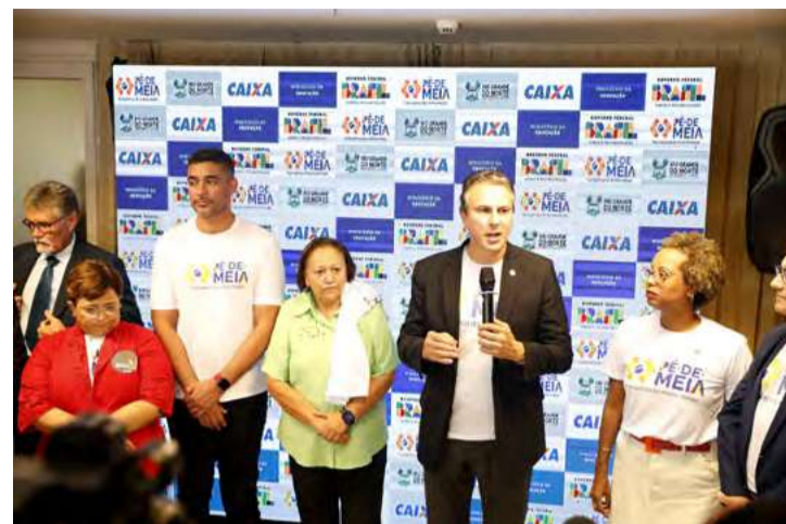
Ministro Camilo Santana fala sobre o programa federal