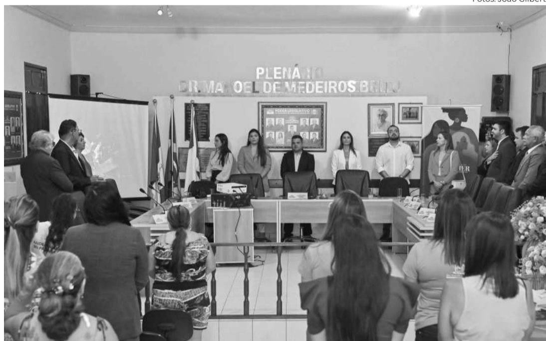
Ação do ProMulher na Câmara Municipal de Jardim do Seridó