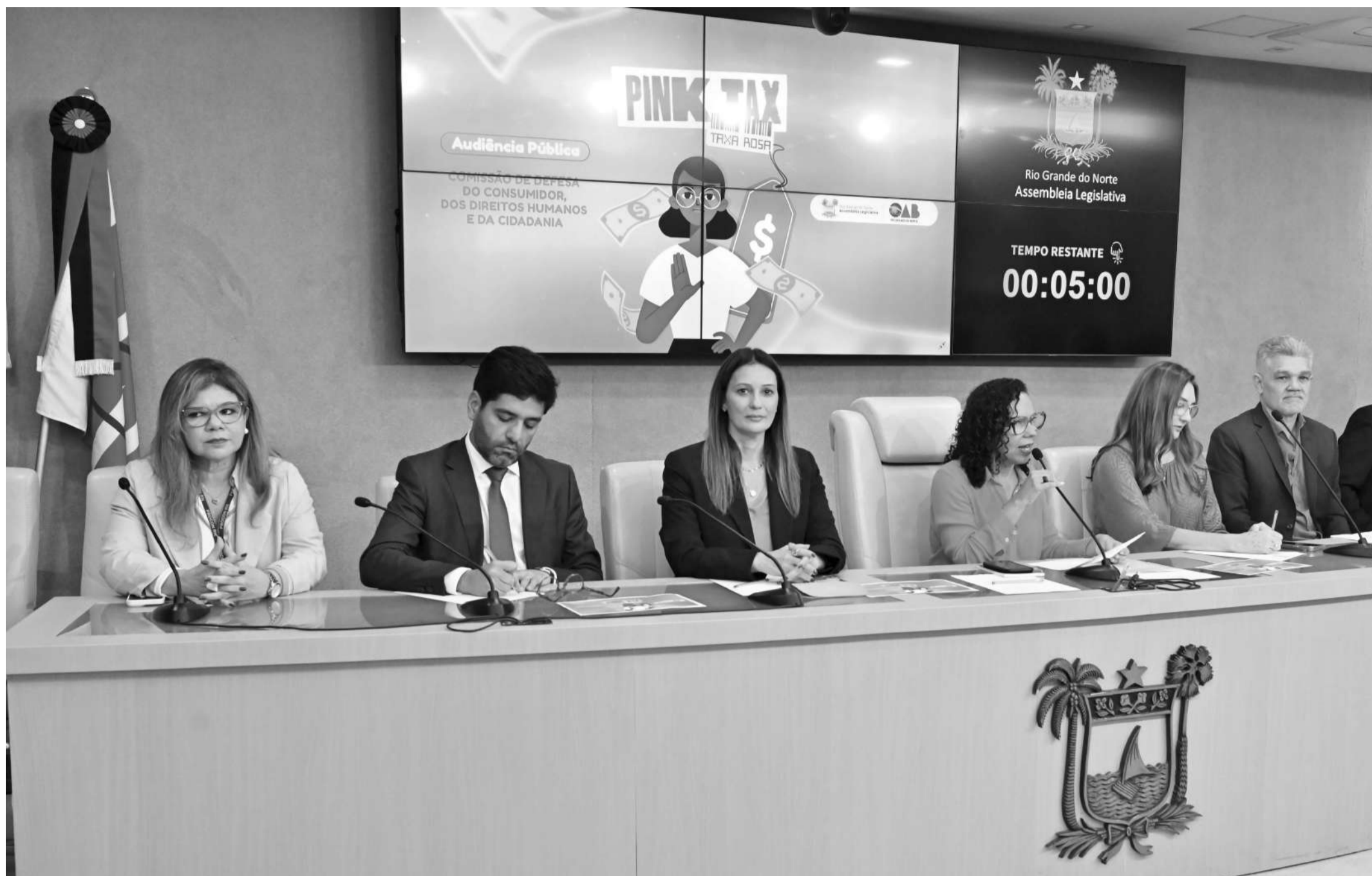
No início de abril, a Comissão de Defesa do Consumidor, dos Direitos Humanos e Cidadania promoveu o debate sobre o tema da Taxa Rosa