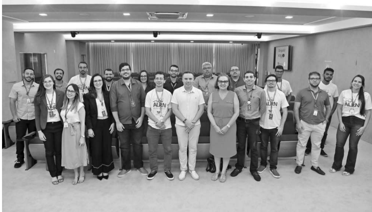
Servidores mais antigos da instituição puderam compartilhar suas experiências no Legislativo

Da mesma forma como ocorreu com os nomeados este ano, um Curso de Formação e Integração também foi realizado para os concursados que ingressaram no Legislativo no ano passado. A imersão costuma ter duração de 20 dias, com uma programação que inclui momentos com gestores, assessores e deputados da Casa Legislativa, além de mesas-redondas com convidados externos. Além de abordar os desafios da carreira no serviço público, promovendo interação e esclarecendo as dúvidas.