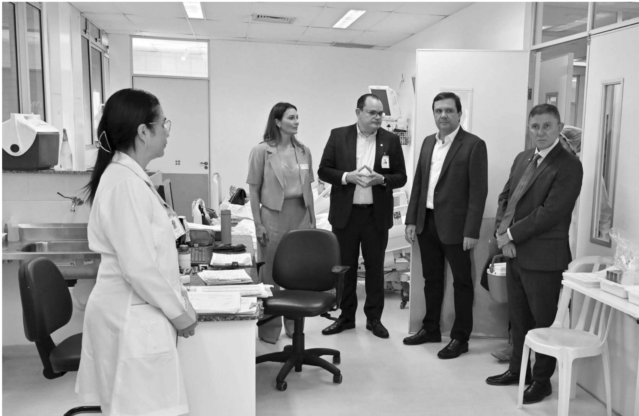
Integrantes da Comissão de Saúde visitaram o Hospital Universitário Onofre Lopes, da Universidade Federal do Rio Grande do Norte (HuoI-UFRN)