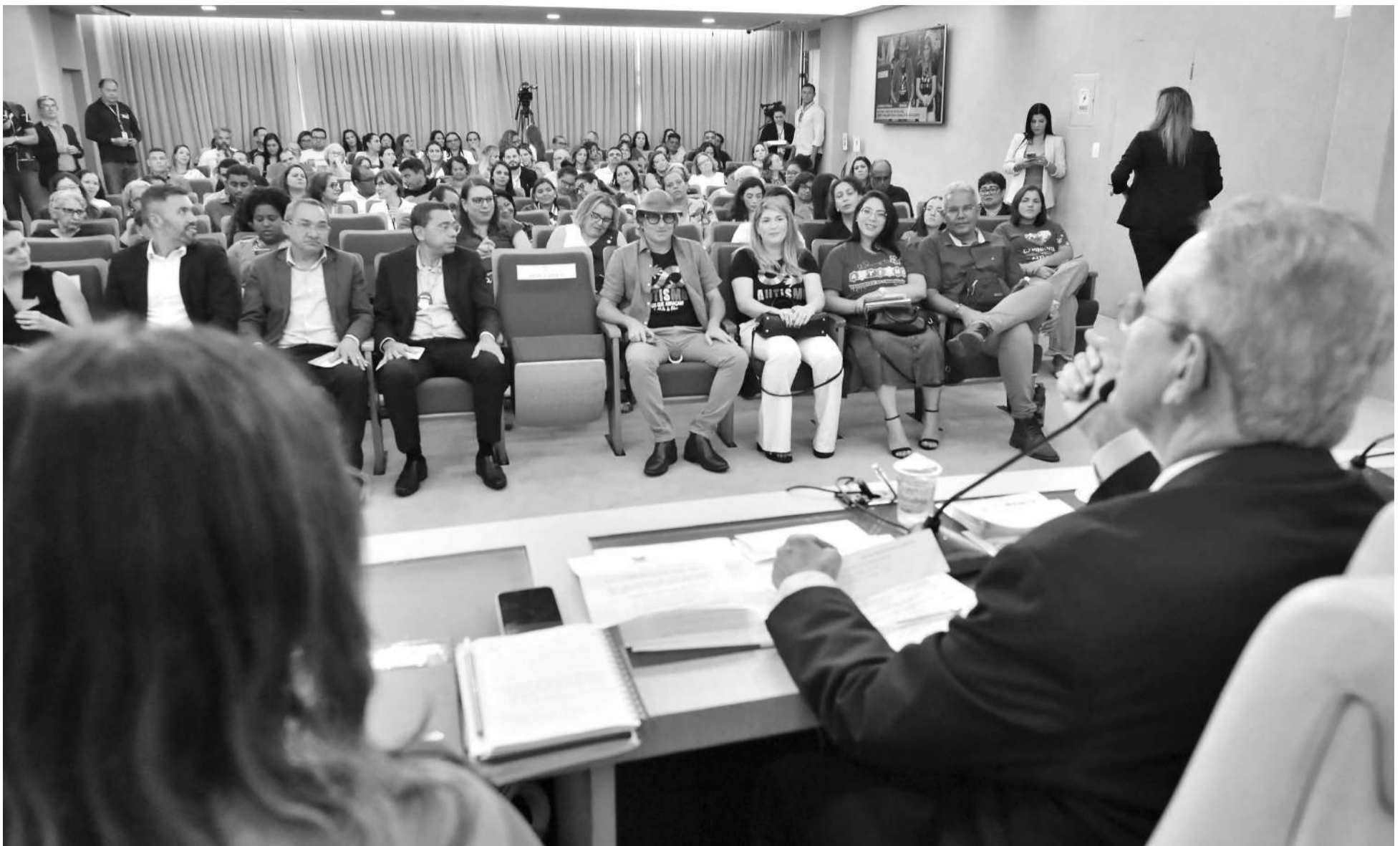
Uma Audiência Pública intitulada “Autismo e Políticas de Inclusão” foi promovida no plenarinho da Assembleia em 2 de abril