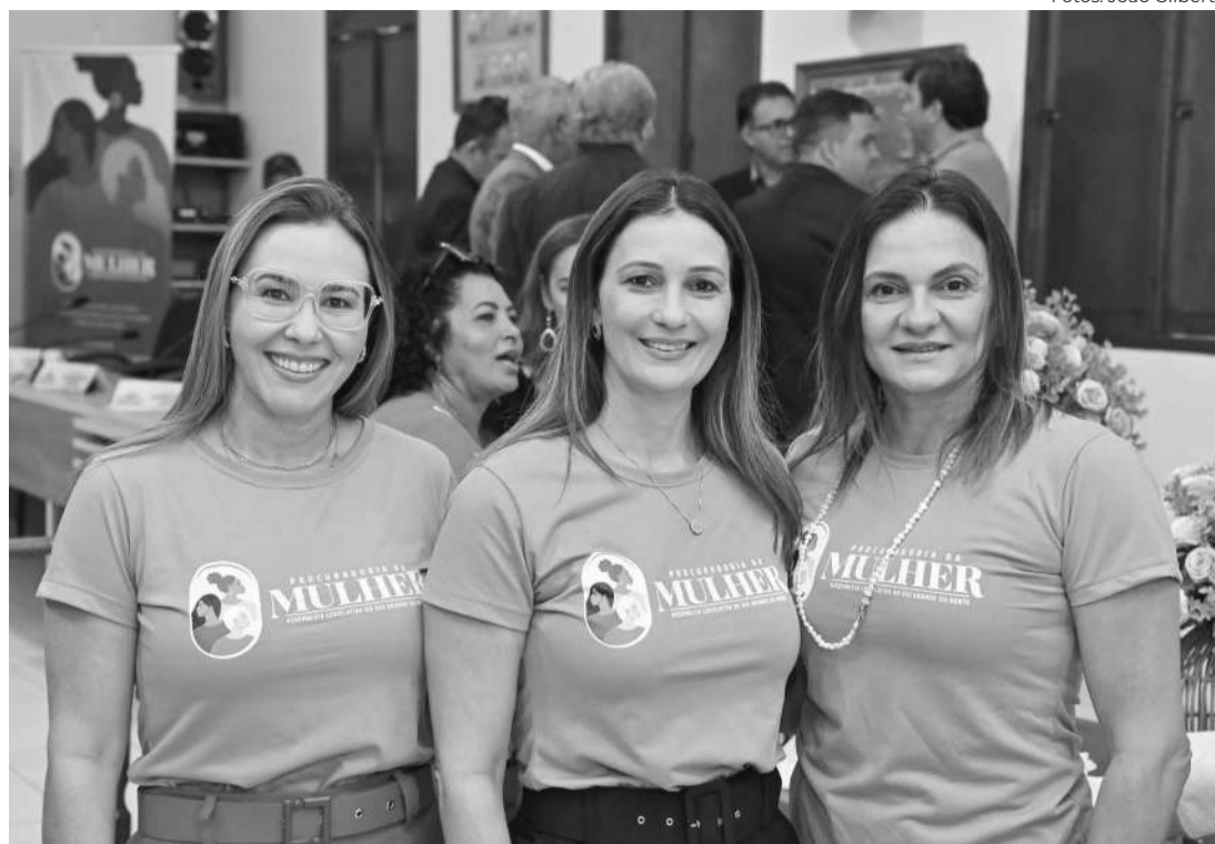
ProMulher da ALRN tem papel de capacitar e prestar assessoria às Câmaras