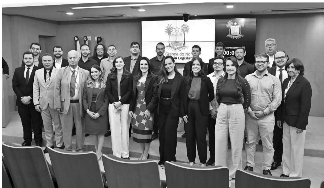
Servidores têm papel fundamental na construção de uma ALRN mais transparente e eficiente