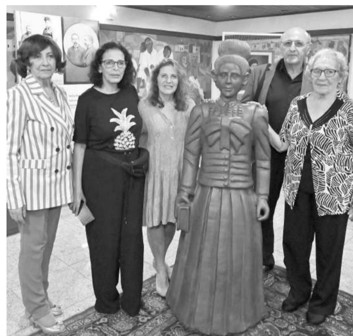
Exposição mostra como Auta de Souza deixou um legado significativo na literatura brasileira

Um dos destaques da exposição é a presença de exemplares das tiragens do Horto editadas, incluindo o exemplar da primeira edição impressa em 1900, além da mais recente impressão em fac-símile. Além disso, por meio de inteligência artificial, os visitantes têm o privilégio de presenciar a modernização do passado e ouvir a poetisa declamando cinco de seus poemas, bastando ler o QR Code presente nos banners expostos.