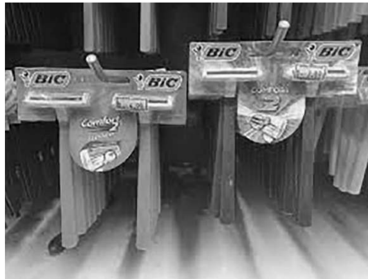
Produtos femininos podem ficar até 100% mais caros