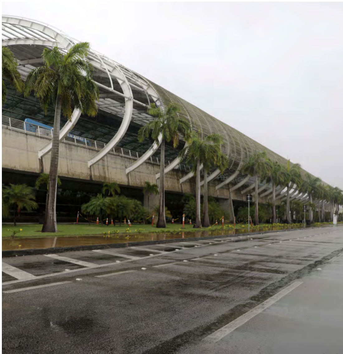
Aeroporto Internacional Aluízio Alves é operado desde fevereiro pela Zurich Airports

“Com a implantação da unidade, a empresa espera reduzir os prazos de encaminhamento de carga para os estados do Nordeste, uma vez que o novo centro internacional estará mais próximo dos destinatários e a carga será entregue diretamente na região”, detalhou em nota, a direção dos Correios.