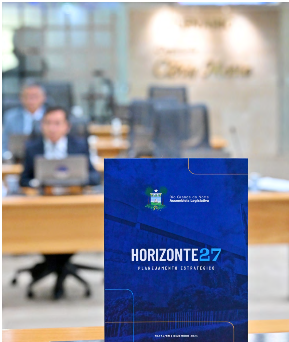
Documento compõe o plano de ação da Assembleia para o ciclo entre 2024 e 2027

O documento apresenta em detalhes o processo adotado para execução do trabalho de planejamento estratégico para o ciclo de 2024 – 2027. O plano foi elaborado levando em consideração o contexto atual da ALRN e a percepção dos colaboradores sobre suas potencialidades. Destaca-se, em detalhes, os macrodesafios que a instituição buscará alcançar no período de 2024 a 2027, apresentando as correspondentes iniciativas estratégicas e os principais indicadores de desempenho que