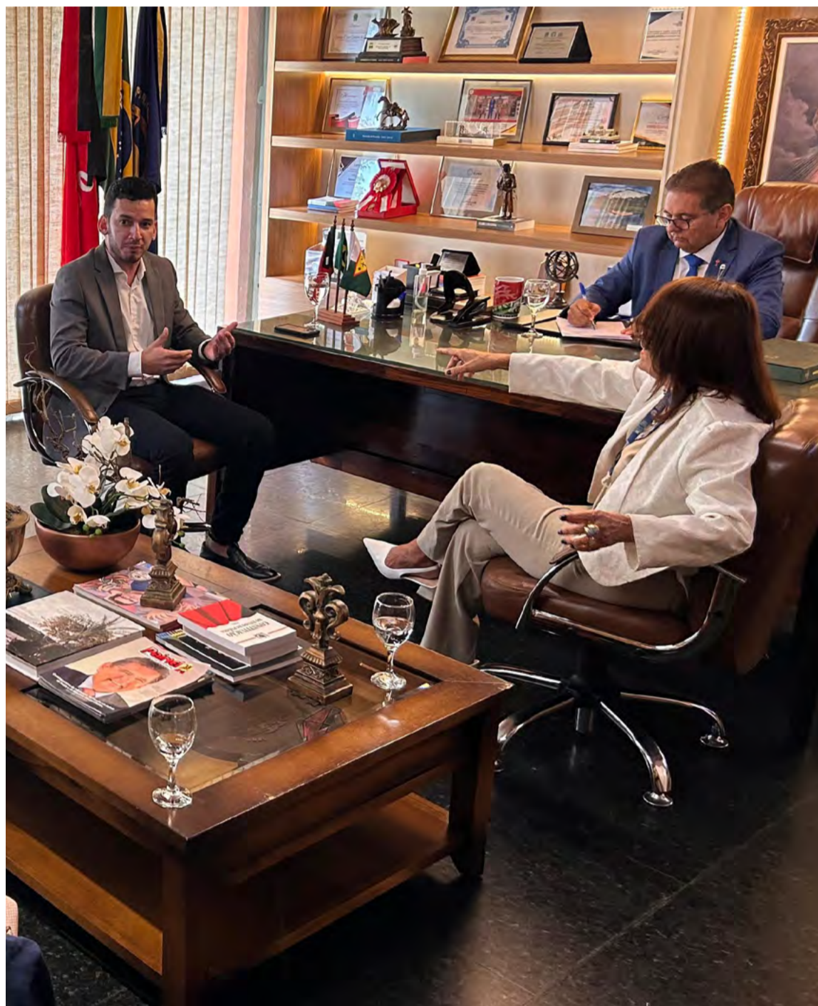
Comitiva potiguar foi recepcionada pelo presidente da ALPB, Adriano Galdino

“Foi um encontro muito positivo, com certeza. Eles têm 22 anos de experiência, enquanto a nossa Ouvidoria tem somente cinco anos. Certamente, traremos boas ideias para otimizar o nosso trabalho no Rio Grande do Norte, principalmente aproximando a população do Legisla-