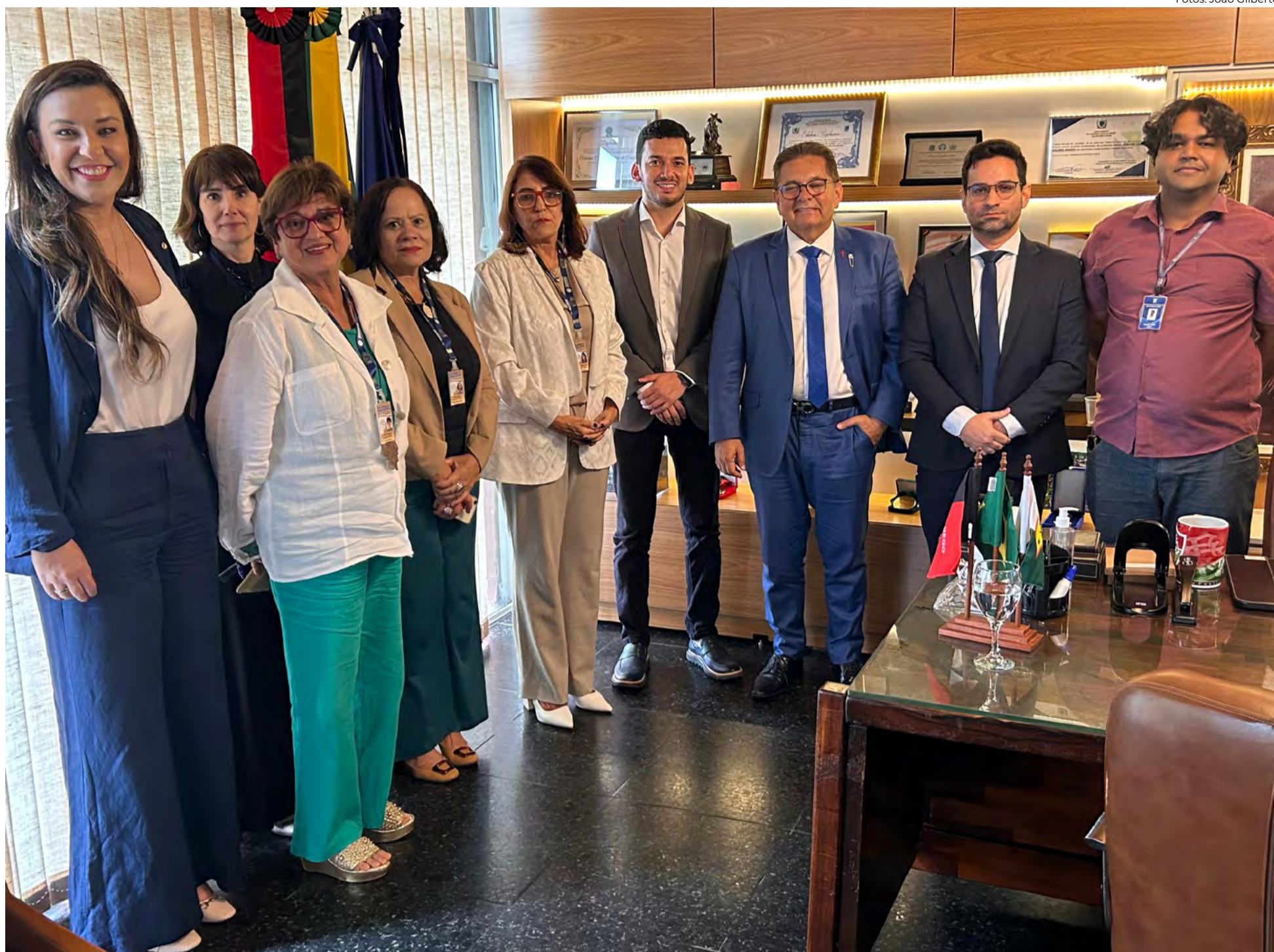
Troca de experiências com o Legislativo Paraibano visa buscar ideias para otimizar trabalho no Estado