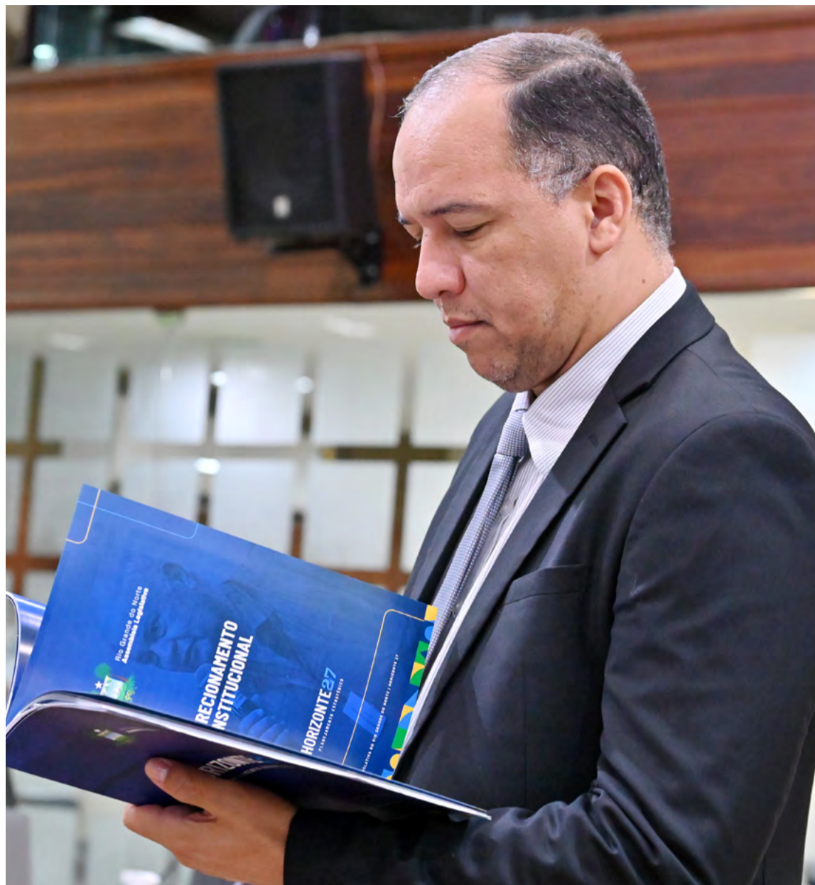
Deputados receberam versão impressa do Planejamento Estratégico 2023-2027