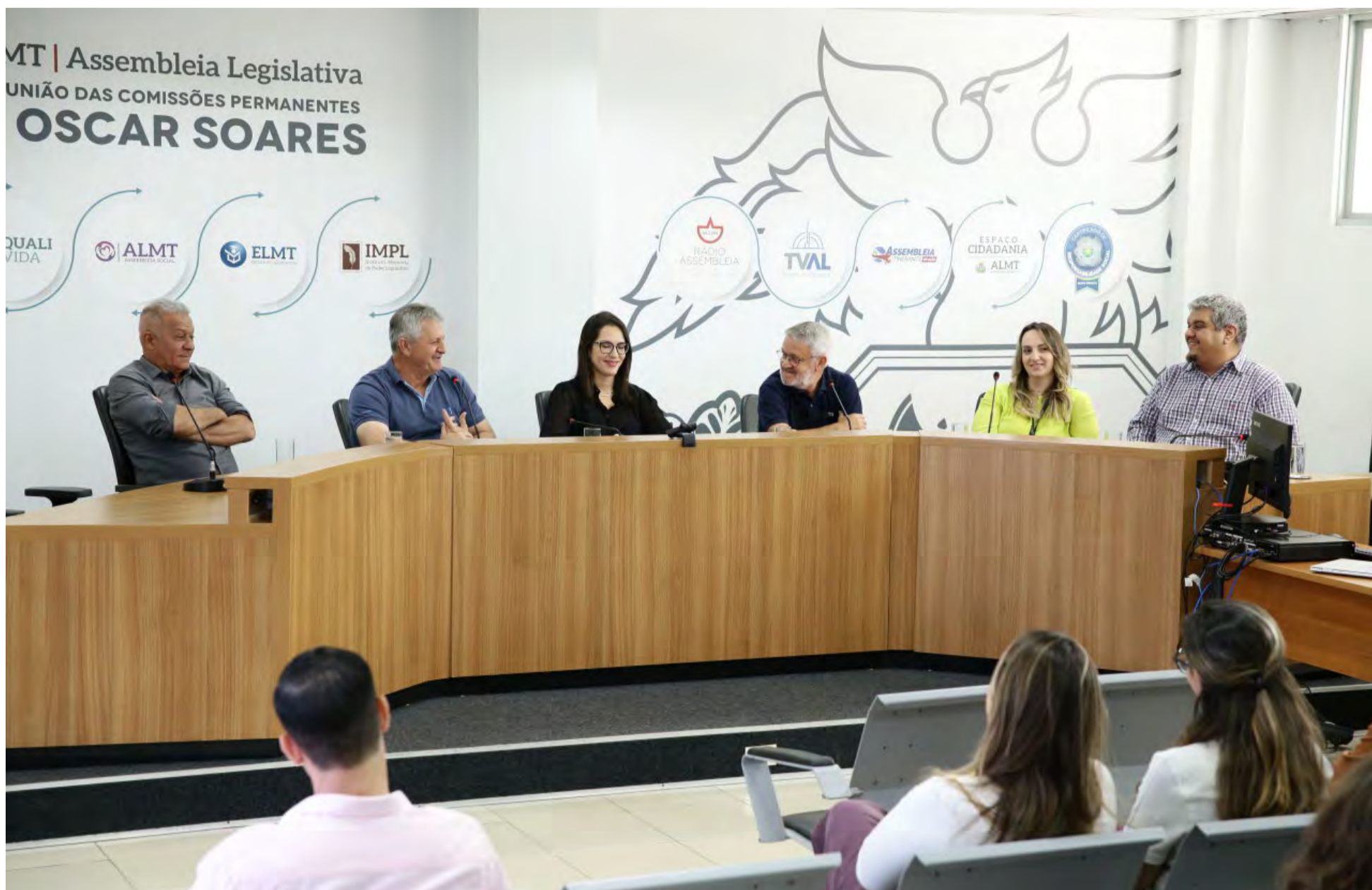
Detalhes do funcionamento do sistema foram apresentados por técnicos da ALRN aos servidores e parlamentares da ALMT