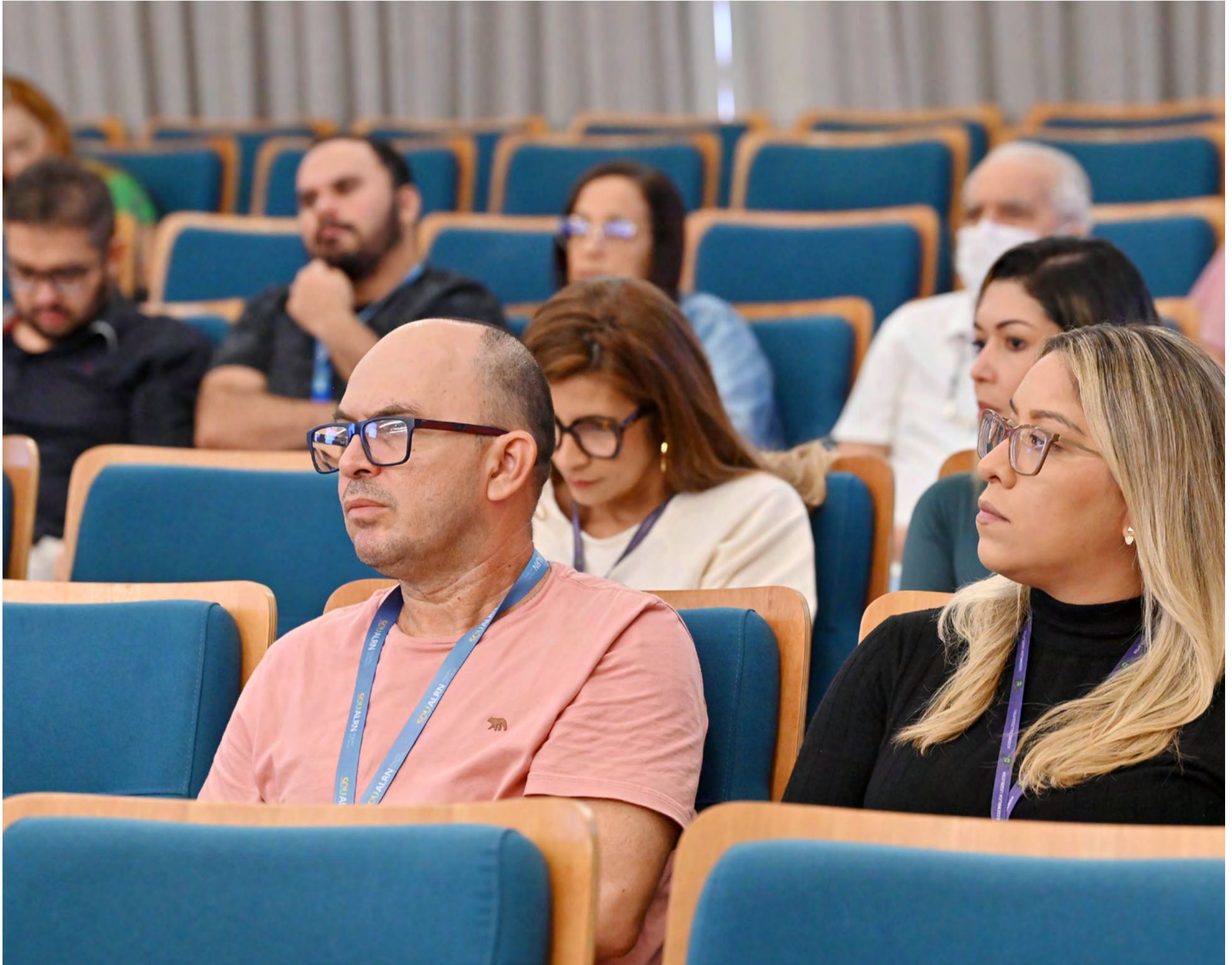
Servidores da Casa Legislativa participaram de treinamento para utilização do novo sistema de transparência