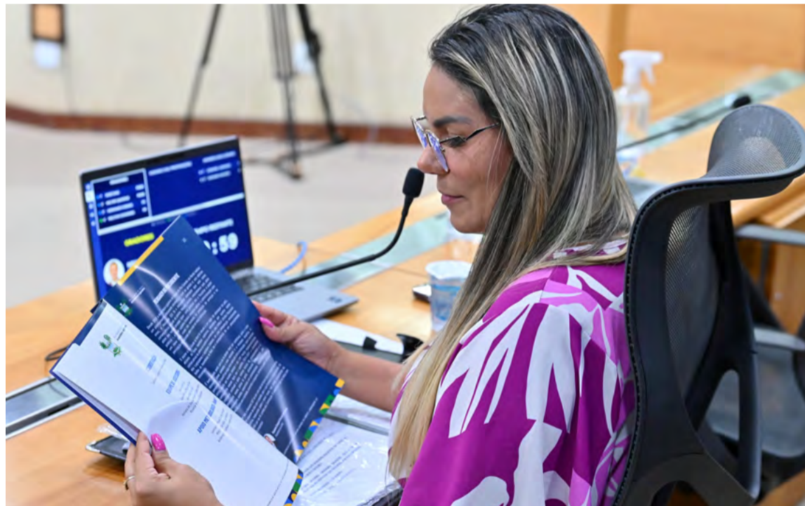
Documento avalia cumprimento de metas em anos anteriores e traça novas