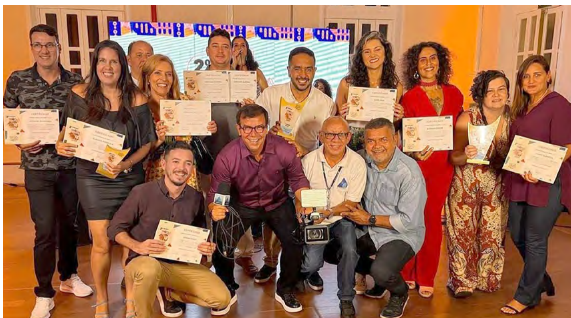
Equipes de jornalistas da Assembleia também receberam menções honrosas do Festival

tivo de muita alegria e orgulho para todos que fazem a emissora. Além de ser o reconheci-