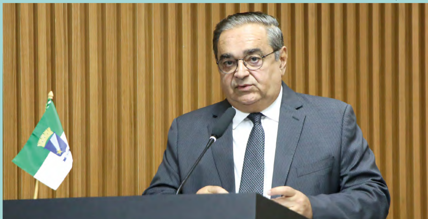
Prefeito Álvaro Dias na abertura dos trabalhos da Câmara Municipal de Natal