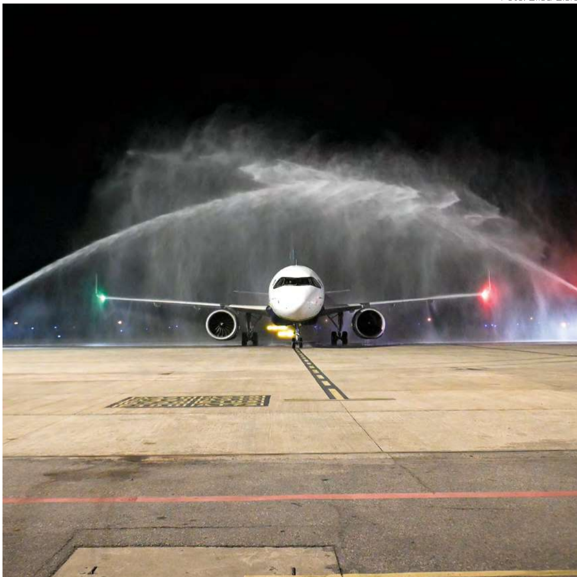
Após a meia-noite, primeira aeronave voo foi recebida com batismo inaugural