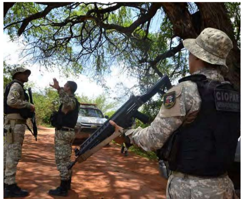
Operações de buscas foram iniciadas logo após a fuga dos detentos ter sido percebida, na última quarta-feira (14)

A fuga, ocorrida às 3h de quarta-feira (14), só foi percebida quase duas horas depois pelos agentes penitenciários. A Polícia Federal está investigando a possibilidade de facilitação por parte de servidores e/ou operários da obra.