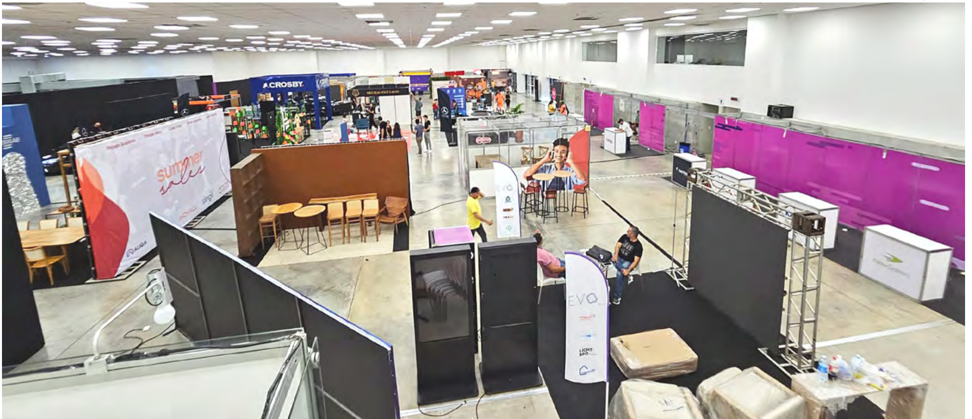
Fórum Negócios reúne cinco espaços distintos, incluindo a área EXPO, com mais de 100 empresas expondo seus negócios