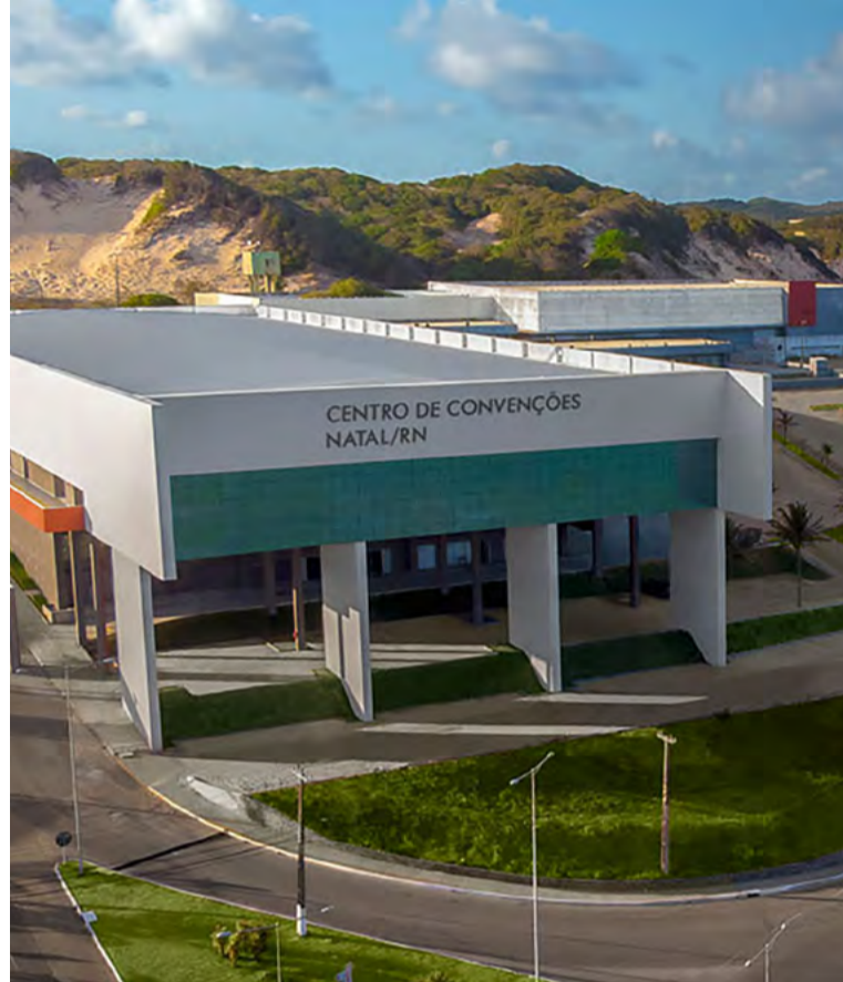
Centro de Convenções é um dos diferenciais do RN

perfil de turista tem papel importante também na economia local. E a manutenção desses eventos no calendário do estado faz total diferença para o setor.