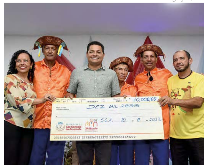
Grupos contemplados receberam R$ 10 mil cada