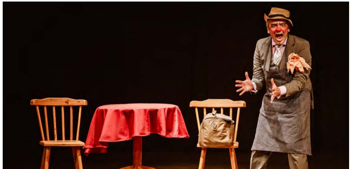
Peça é para todas as idades e já apresentada em países como Espanha e Egito

“Canudo se apaixonou” é um convite para um mergulho na