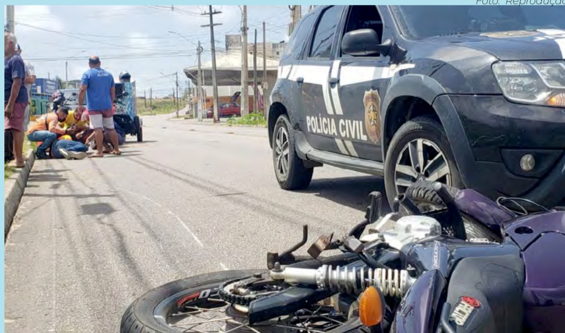
Acidentes de trânsito estão entre os principais causadores de traumas e politraumas no RN

Como reforço aos atendimentos no Walfredo Gurgel, a Sesap abriu recentemente 20 leitos para atendimento exclusivo de trauma ortopédico no Hospital Deoclécio Marques de Lucena, em Parnamirim, que é a unidade de retaguarda do Walfredo Gurgel. Outros 15 leitos serão abertos em breve no 5º andar do hospital, que foi reformado recentemente.