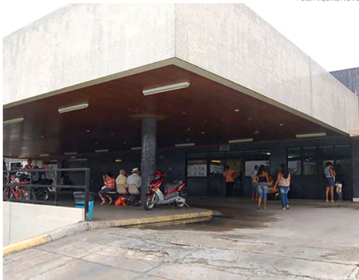
Hospital Monsenhor Walfredo Gurgel, em Natal, concentra mais de 80% dos atendimentos