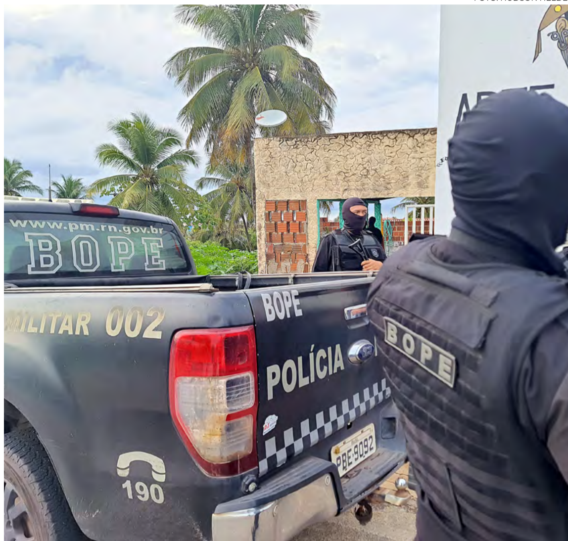
Desde 2019, já foram realizados nove concursos para a Segurança Pública

Com dados da Coordenadoria de Informações Estatísticas e Análises Criminais (Coine), foram 861 crimes de mortes violentas de janeiro a setembro de 2023. No mesmo período do ano anterior, foram registradas 976 ocorrências. O número representa uma redução de 12%. Entre os tipos criminais, a maior diminuição está entre os homicídios dolosos, com queda de 804