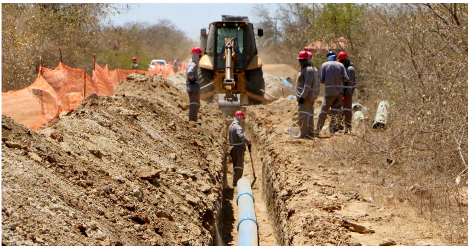
Adutora Apodi-Mossoró vai garantir segurança hídrica para as cidades de Mossoró e Governador Dix-Sept Rosado

O projeto original da adutora iria captar água da Barragem de Apodi. Mas infelizmente, a seca de 2012 a 2017 causou insegurança hídrica, fazendo com que a barragem permanecesse com baixo volume de água. Por esse motivo, a Caern retomou o investimento com readequações ao projeto original, em relação à fonte de captação da água. Além do que a captação no Sítio Carrasco, com a utilização de poços, tem condições técnicas de garantir o envio de água para as cidades.