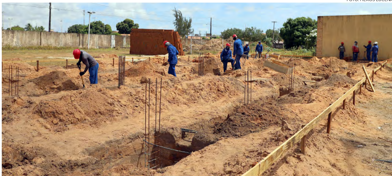
O Hospital Santa Catarina vai receber ampliação do pronto-socorro cirúrgico, além de outras melhorias na unidade