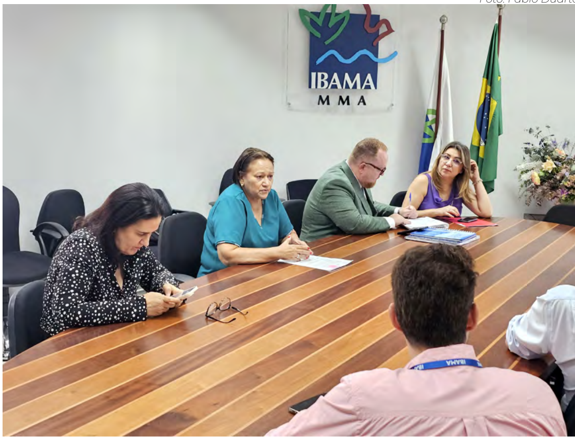
Governadora Fátima Bezerra (PT) em reunião com integrantes da direção do Ibama