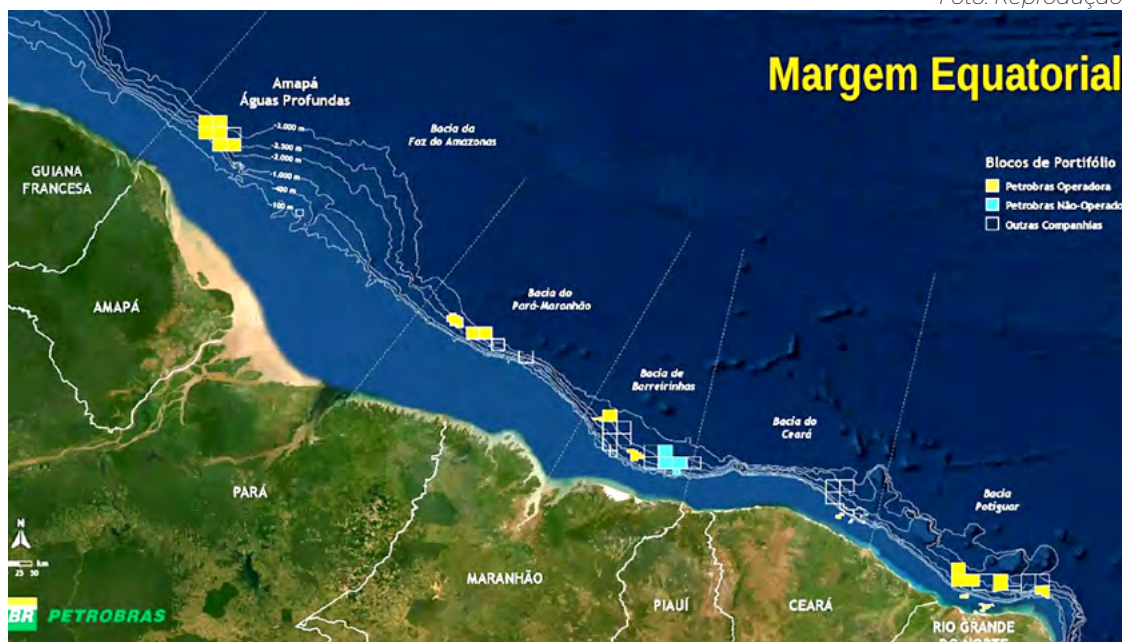
Margem Equatorial se estende entre os estados do Amapá e do Rio Grande do Norte

O presidente da Petrobras, Jean Paul Prates, enfatizou que a empresa está seguindo os procedimentos estabelecidos pelo Ibama e aguardando a emissão da licença ambiental. Ele destacou que o Ibama determina em quais áreas a empresa pode avançar em cada etapa do processo exploratório.