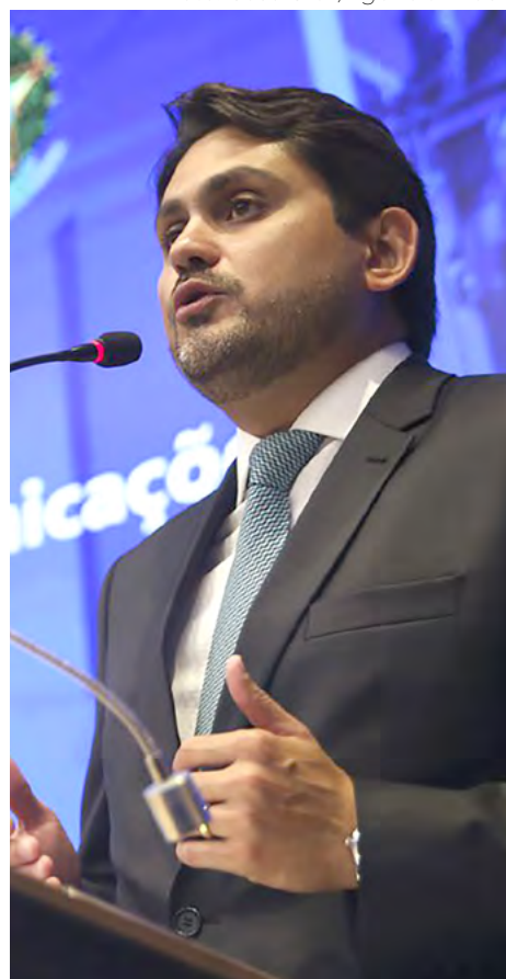
Ministro das Comunicações, Juscelino Filho

No momento, as informações do Governo Federal indicam que o estado tem