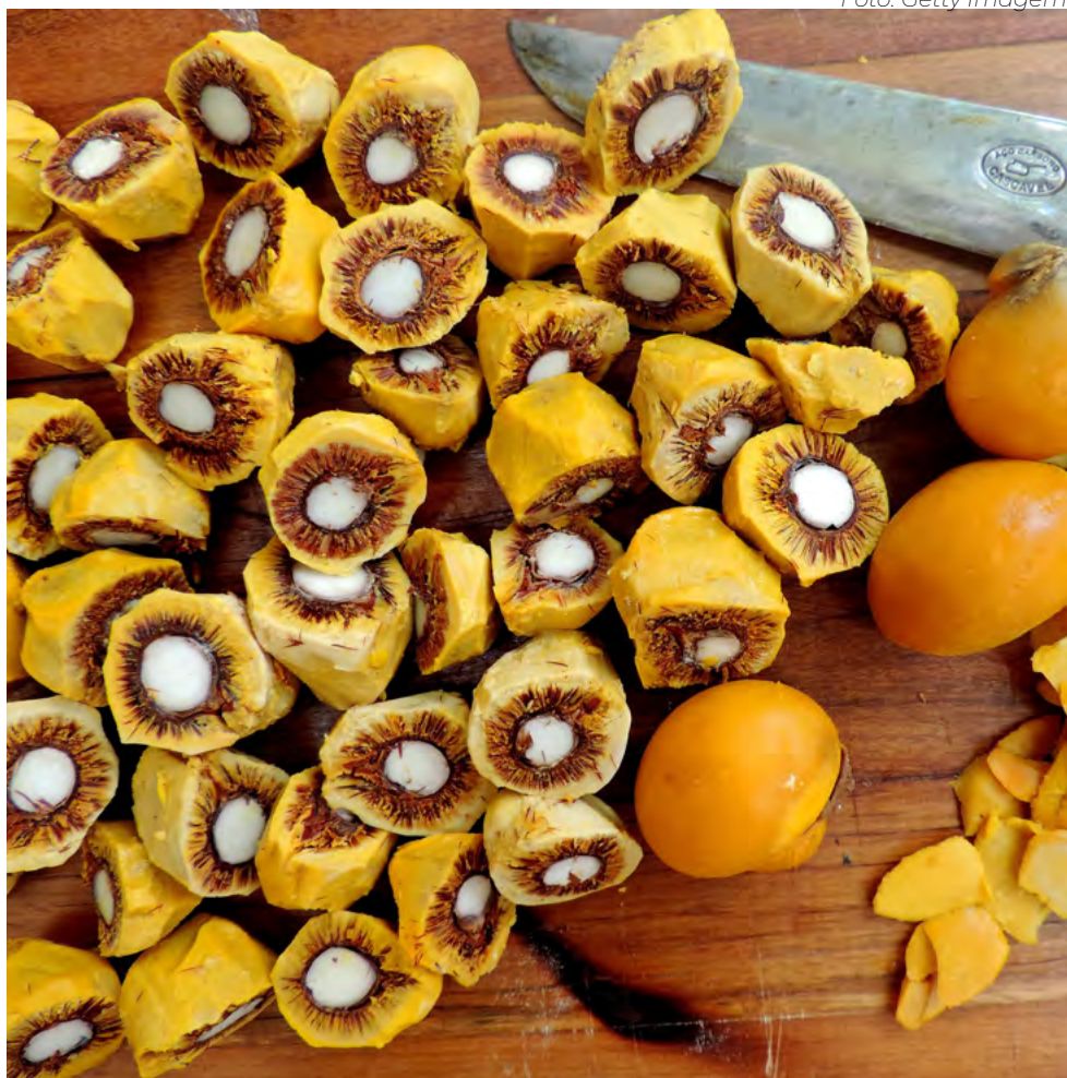
Apreciado por goianos e mineiros, o pequi está em área que sofre degradações