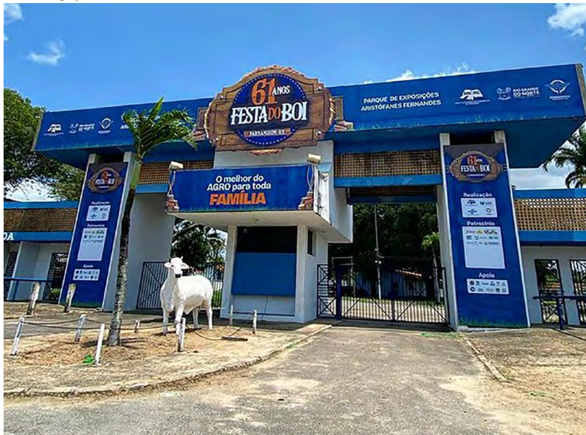
Festa do Boi está em sua 61ª edição e acontece anualmente no Parque Aristóteles Fernandes

tensa programação para o agronegócio, como exposições, leilões e julgamentos de animais e torneios leiteiros, capacitações, oficinas técnicas, artesanato e gastronomia regional. Para esta edição, a ex-