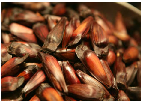
Pinhão e a goiabada cascão sofrem ameaça do processo de urbanização