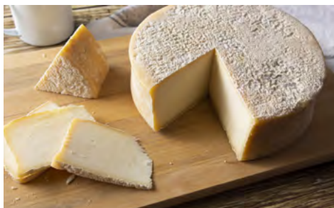
Queijo da canastra e a pitanga (dir.) correm risco de desaparecer, segundo estudo

Além da ameaça de extinção de determinadas espécies por desmatamento, pesca predatória, queimada e urbanização, observa-se a displicência com ensinamentos ancestrais, resultando na redução do consumo de diversas preparações.