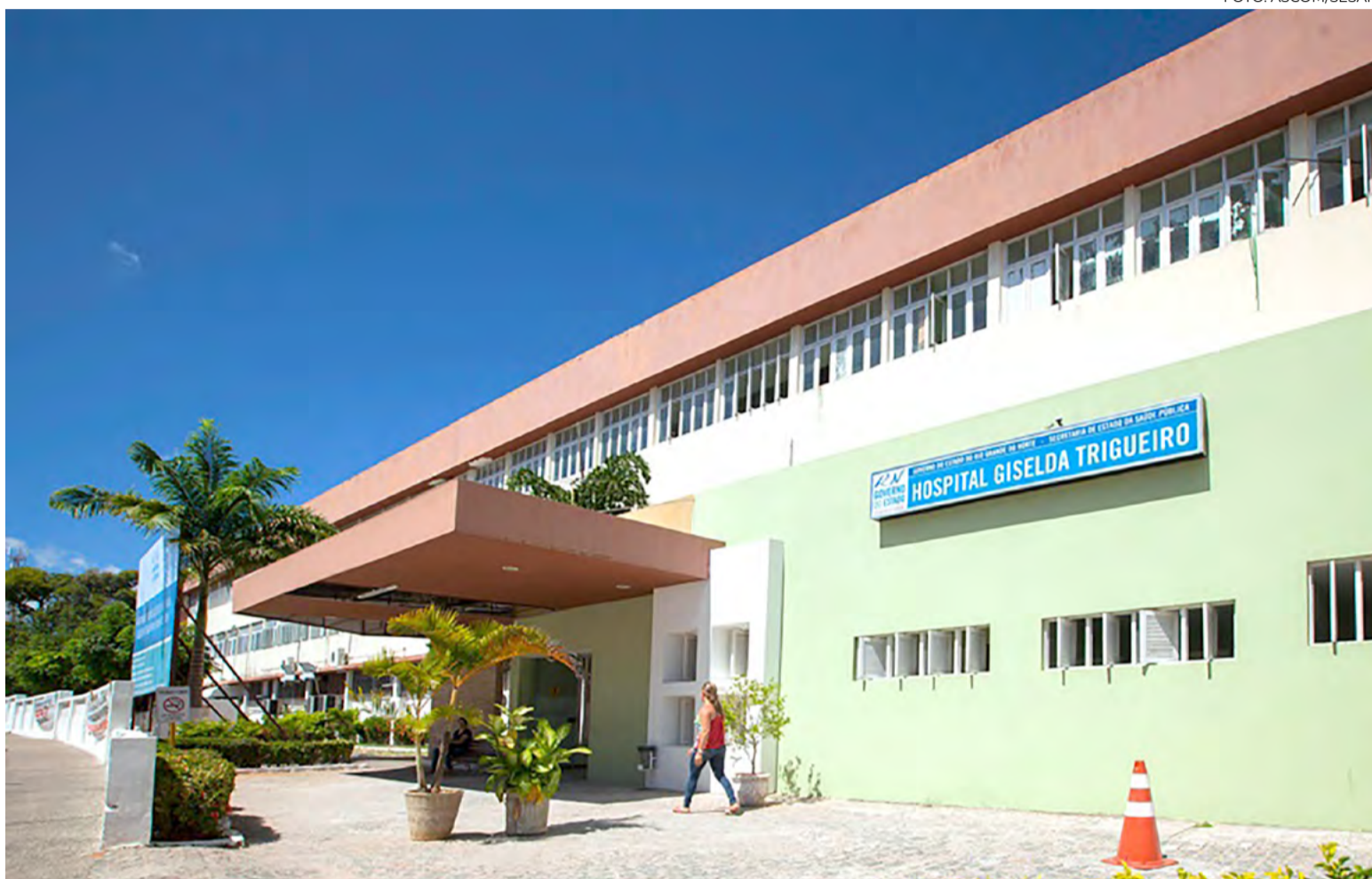
Hospital Giselda Trigueiro, em Natal, vai receber o serviço de recuperação das instalações elétricas do prédio

Este investimento de R$ 20,8 milhões representa uma mudança na capacidade assistencial dos hospitais. No caso do Walfredo Gurgel, por exemplo, será construído um novo centro cirúrgico que vai dobrar a capacidade atual da unidade. O Santa Catarina vai ganhar um setor de imagem, com planejamento para instalação de Raios-X, endoscopia e ultrassonografia, e uma nova UTI neonatal com 10 leitos. Já em Macaíba, mais 12 leitos clínicos cirúrgicos, que vão dar a capacidade do hospital realizar cirurgias eletivas. “O Governo está comprometido em entregar um serviço de qualidade ao povo potiguar. Esse investimento de hoje mostra esse compromisso”, ressaltou a secretária de Saúde,