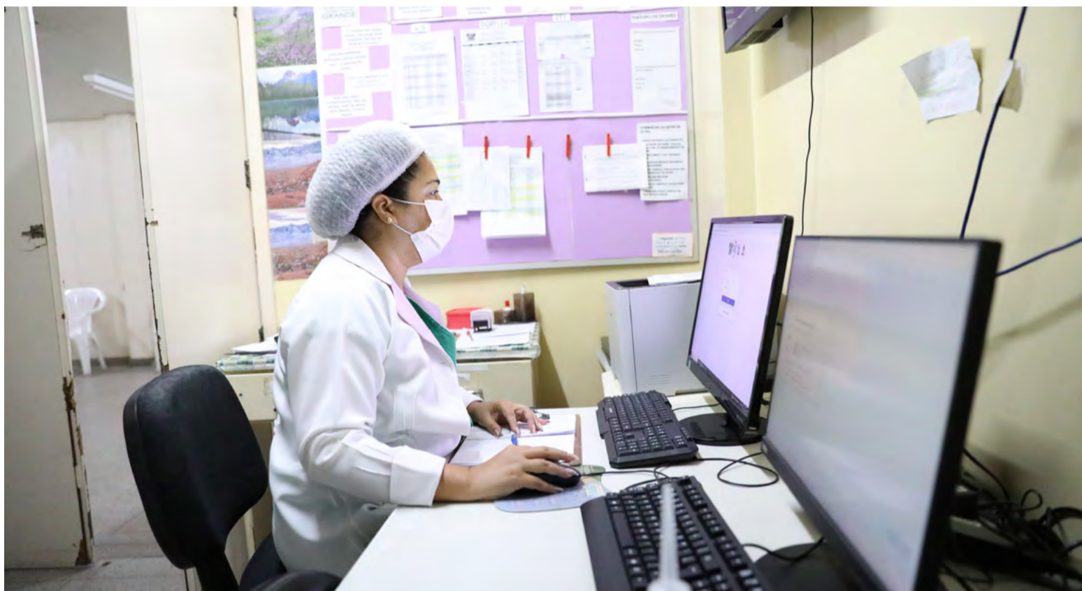
Foram criados mais de 6.700 prontuários, envolvendo cerca de 560 profissionais de saúde

Atualmente o prontuário eletrônico vem sendo utilizado nos hospitais Giselda Trigueiro, em Natal, Deoclécio Marques de Lucena, em Parnamirim, e no Hospital da Mulher, em