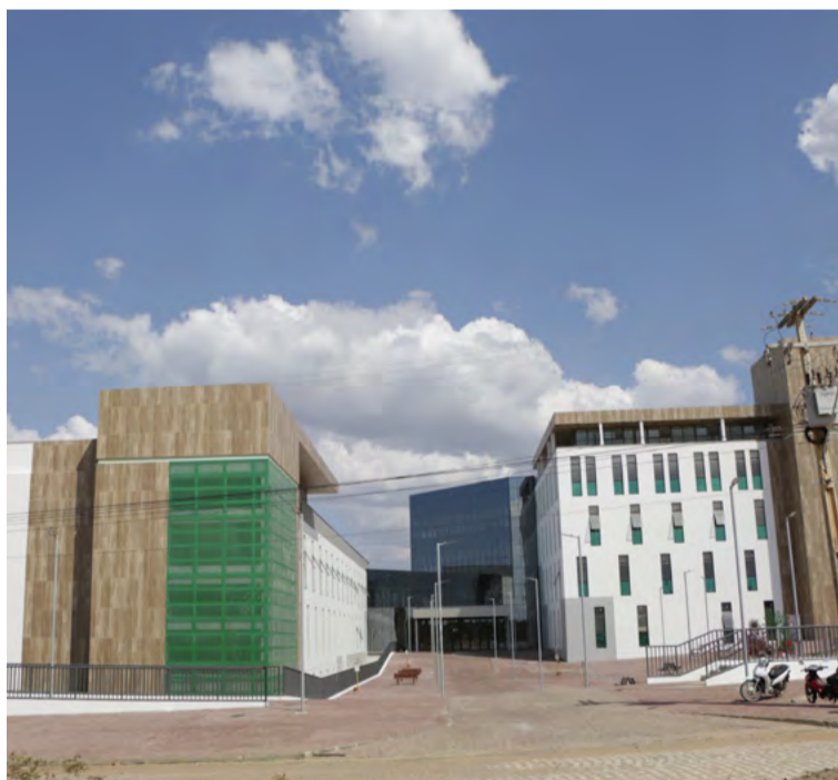
Prontuário eletrônico é adotado no Hospital da Mulher

Mossoró. A ideia é expandir o uso dessa ferramenta para 21 hospitais da rede estadual até o final de 2024. A próxima unidade a ser contemplada será o Hospital Geral João Machado, com implantação prevista para 2 de outubro.