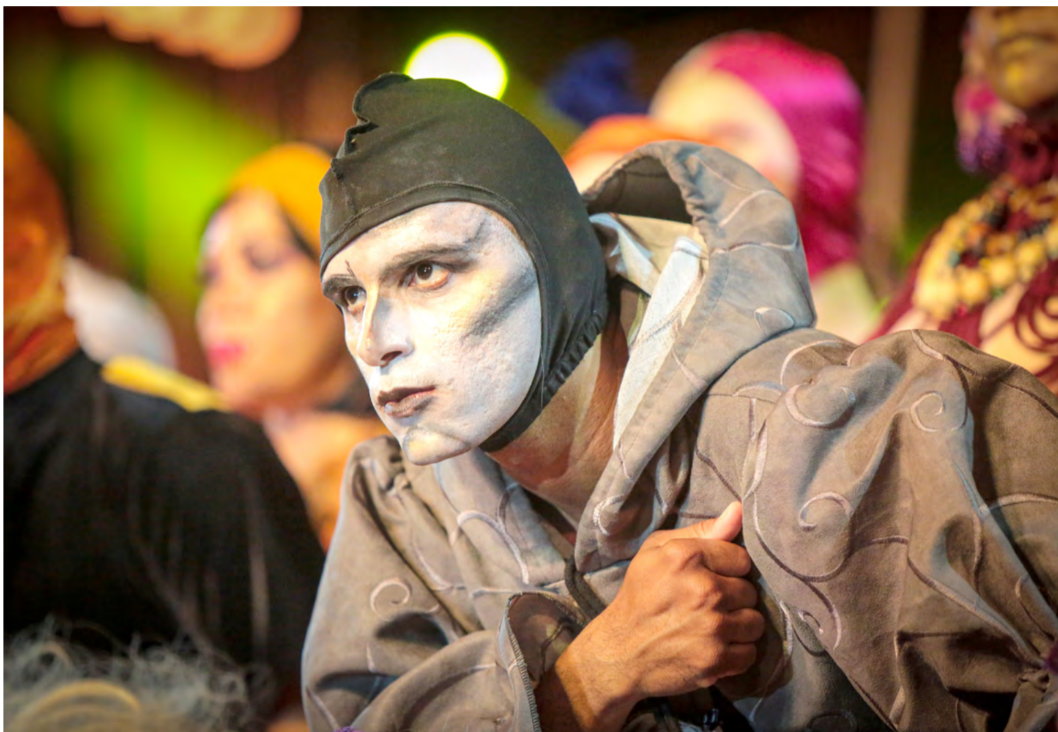
Programa Cultural Câmara Cascudo é um instrumento de democratização do acesso à cultura no RN

O Programa é um instrumento de democratização do acesso à cultura no RN e consiste na renúncia fiscal do ICMS por parte do Estado para que o valor correspondente à contribuição seja investido em projetos artístico-culturais.