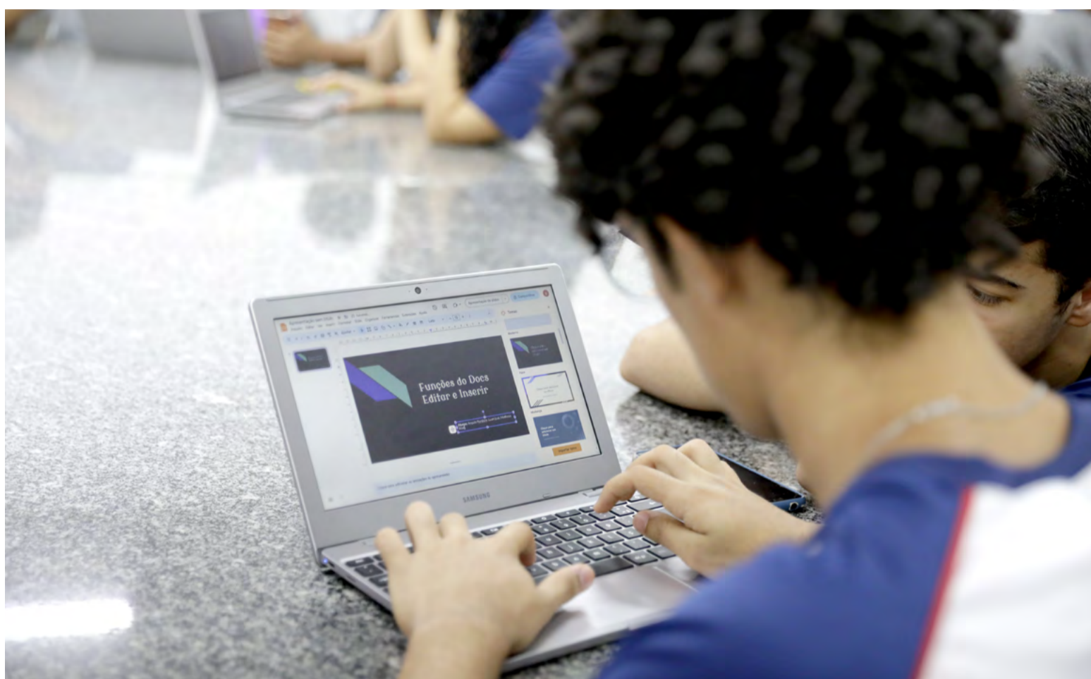
Projeto “Geração Conectada” conta com o investimento de R$ 62 milhões de reais pelo Governo do RN

“Sempre foi meu sonho que a educação alavancasse de maneira moderna e igualitária. E hoje vendo de perto esta revolução, me sinto contemplada”, disse a governadora Fátima Bezerra.