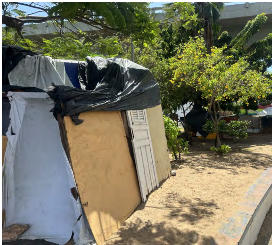
Censo Populacional contabiliza 2.202 pessoas em situação de rua no Estado

Os números de Natal apresentados pelo censo da Sethas têm diferenças em relação ao mais recente levantamento da Secretaria Municipal de Trabalho e Assistência Social (Semtas). Até julho deste ano, a pasta contabiliza 859 pessoas vivendo pelas ruas da capital potiguar.