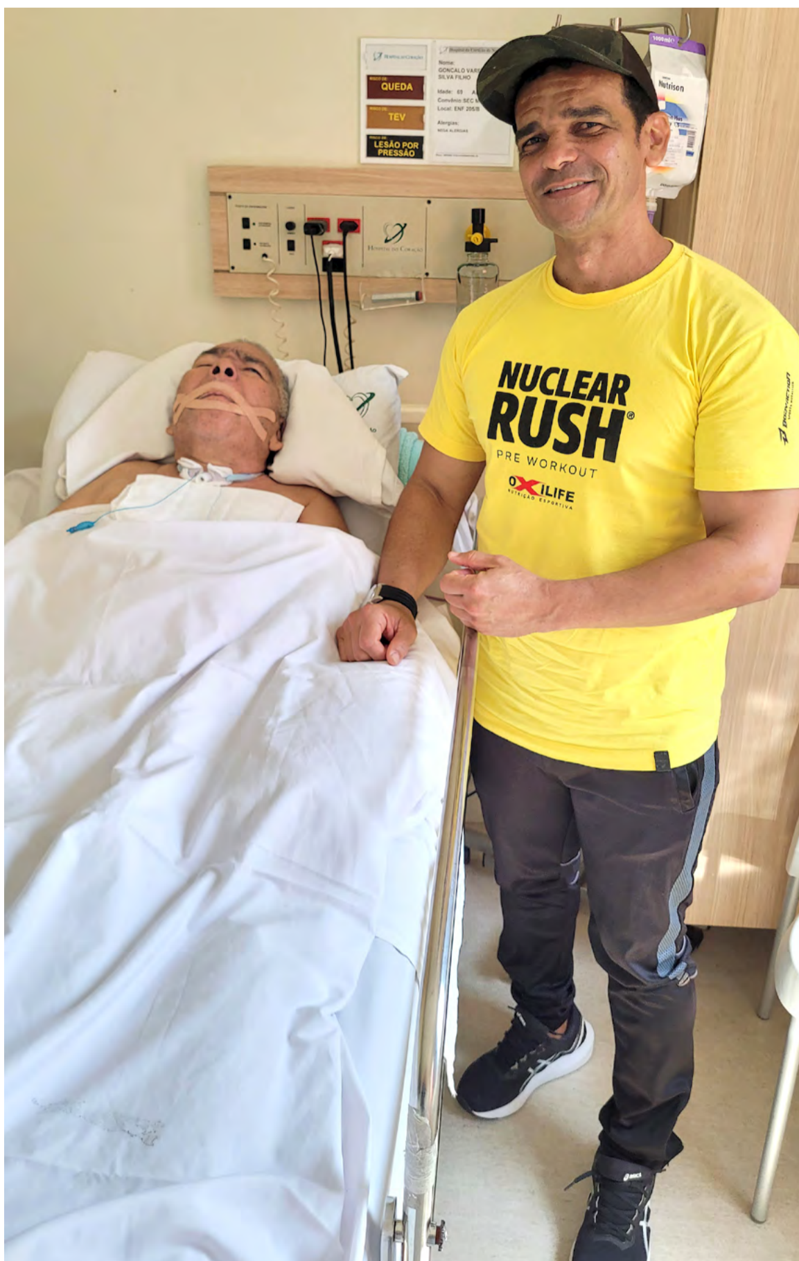
Filho mais velho de seu Gonçalo tem se dedicado integralmente aos cuidados com o pai