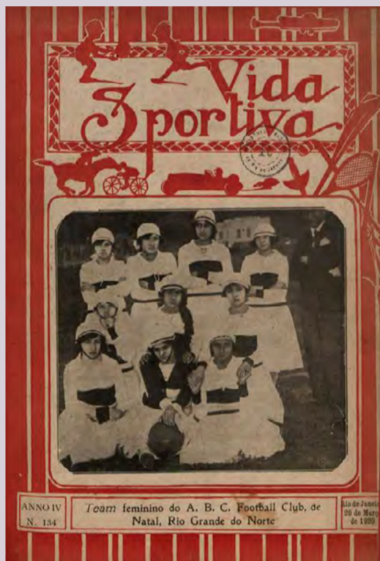
Em 1920, a revista Vida Sportiva trouxe reportagem sobre futebol feminino potiguar

“Existe um espalhamento diferenciado desse esporte, uma vez que ele não era reconhecido pelas ligas, que de alguma forma