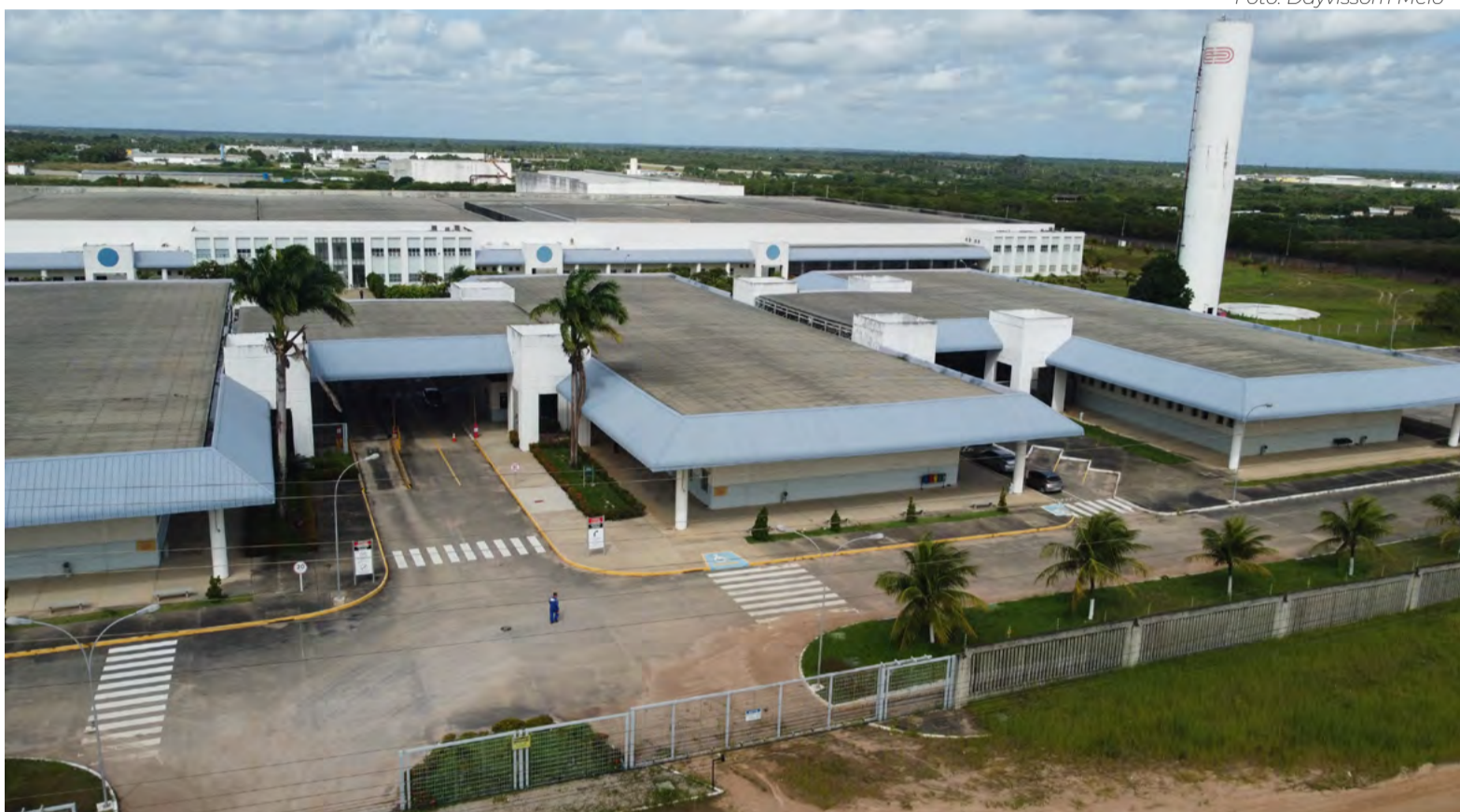
Produção das peças da chinesa Shein ficará por conta da Coteminas, que vai atuar como “âncora” da produção no RN

Até o último dia 7 de julho, pelo menos três contratos já estavam sendo fechados para que a produção de peças de vestuário fosse iniciada. A confecção potiguar terá papel importante na descentralização da produção da