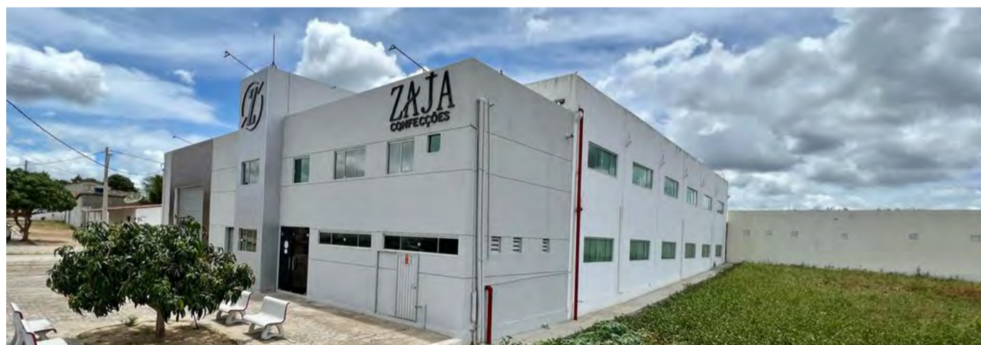
Empresa localizada em Cerro Corá também conta com parceria para qualificação dos seus profissionais