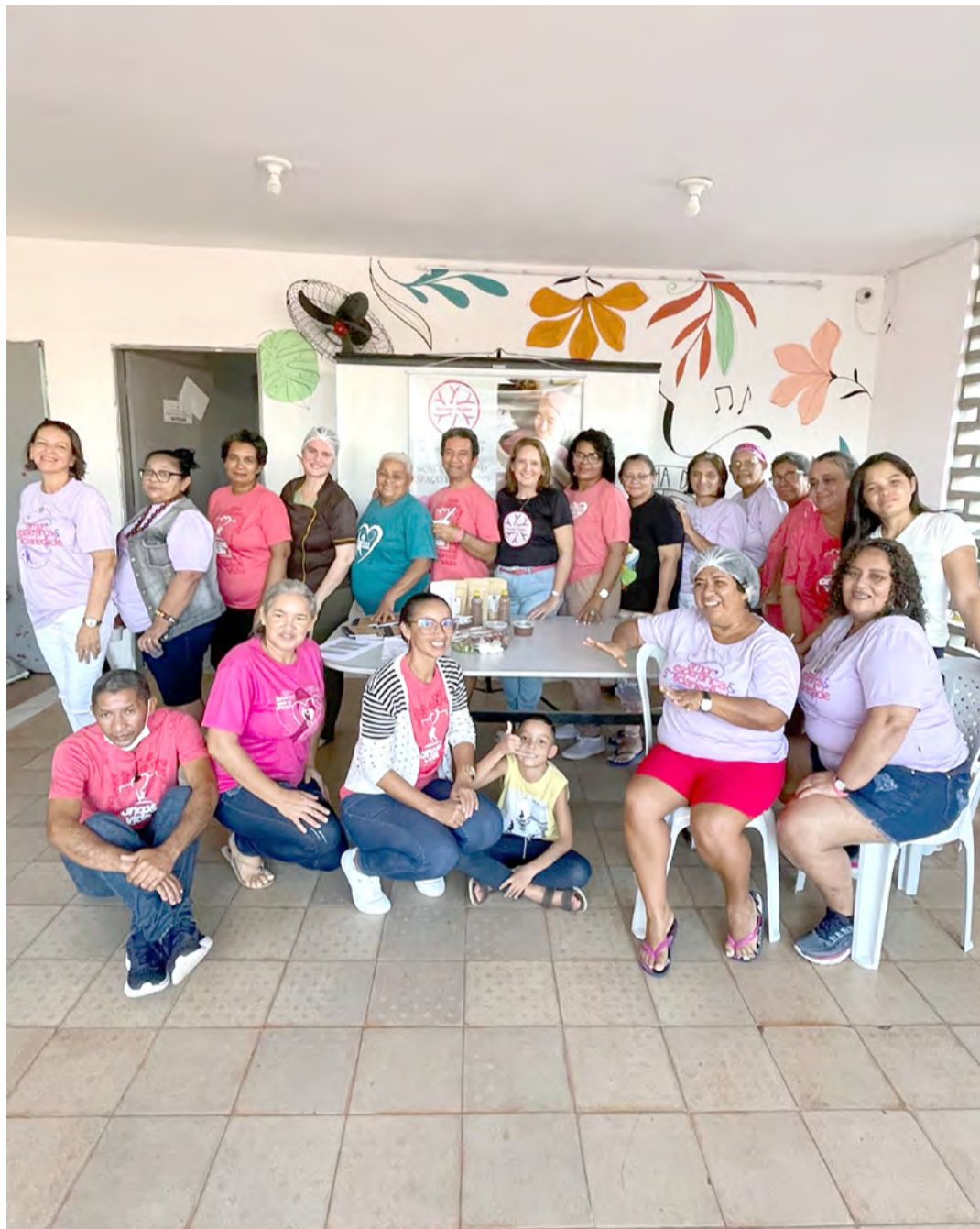
Workshop ensinou mulheres a produzir sobremesas para comercialização