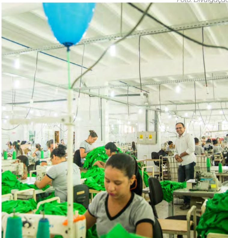
RN tem hoje 124 oficinas de costura em funcionamento

empresa asiática, que até agora só era abastecida por peças fabricadas em apenas um lugar.