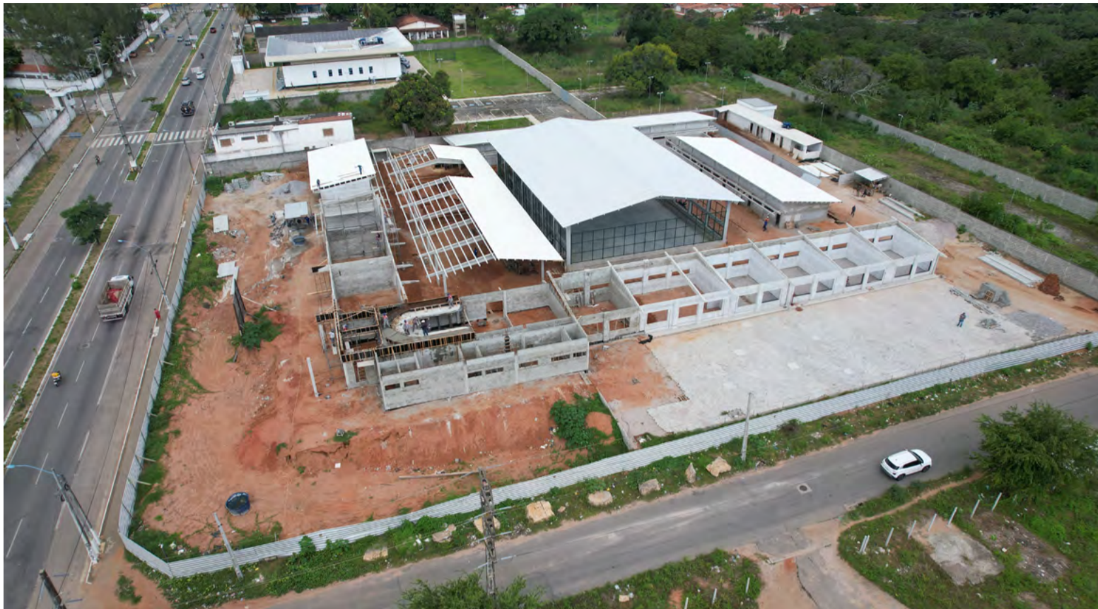
Em Natal, o IERN está sendo erguido no cruzamento da rua do Campo com a avenida Capitão-Mor Gouveia, em Felipe Camarão

Cada unidade do Instituto Estadual de Educação Profissional, Tecnologia e Inovação custará, em média, R$ 10 milhões. Estão em construção as unidades de Natal, Touros, Tangará, Santana do Matos, Jardim de Piranhas, Campo Grande, Umarizal, Alexandria, São Miguel e Areia Branca. Estão aguardando início as unidades de São José do Mipibu e Mossoró. O IERN terá uma infraestrutura de 8 mil metros quadrados, com 12 salas de aula, quatro laboratórios, área de convivência, bloco administrativo, quadra poliesportiva coberta, refeitório, cozinha, banheiros, salas dedicadas ao ensino profissionalizante, biblioteca, au-