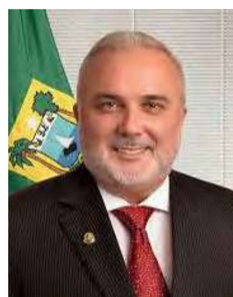
Jean Paul Prates