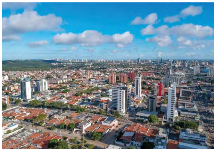
Construção civil está em pleno aquecimento em Natal

“Existem projetos aguardando aprovação da Prefeitura para toda a cidade: Capim Macio, Lagoa Nova, Tirol, e outras regiões, como Ponta Negra. Vemos muito na região de Tirol agora porque são projetos