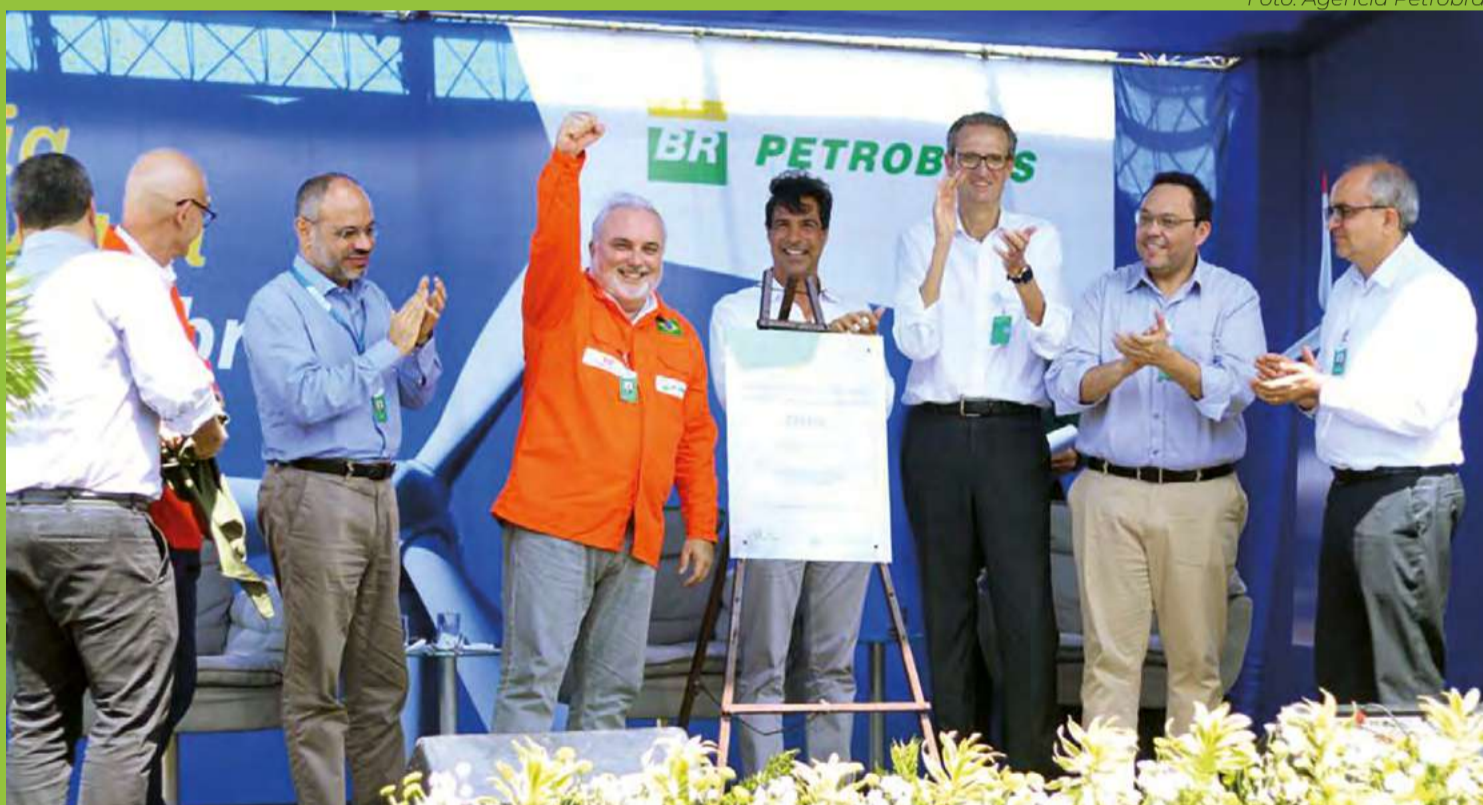
Jean Paul Prates participou do lançamento do novo escritório regional da Petrobras no Rio Grande do Norte