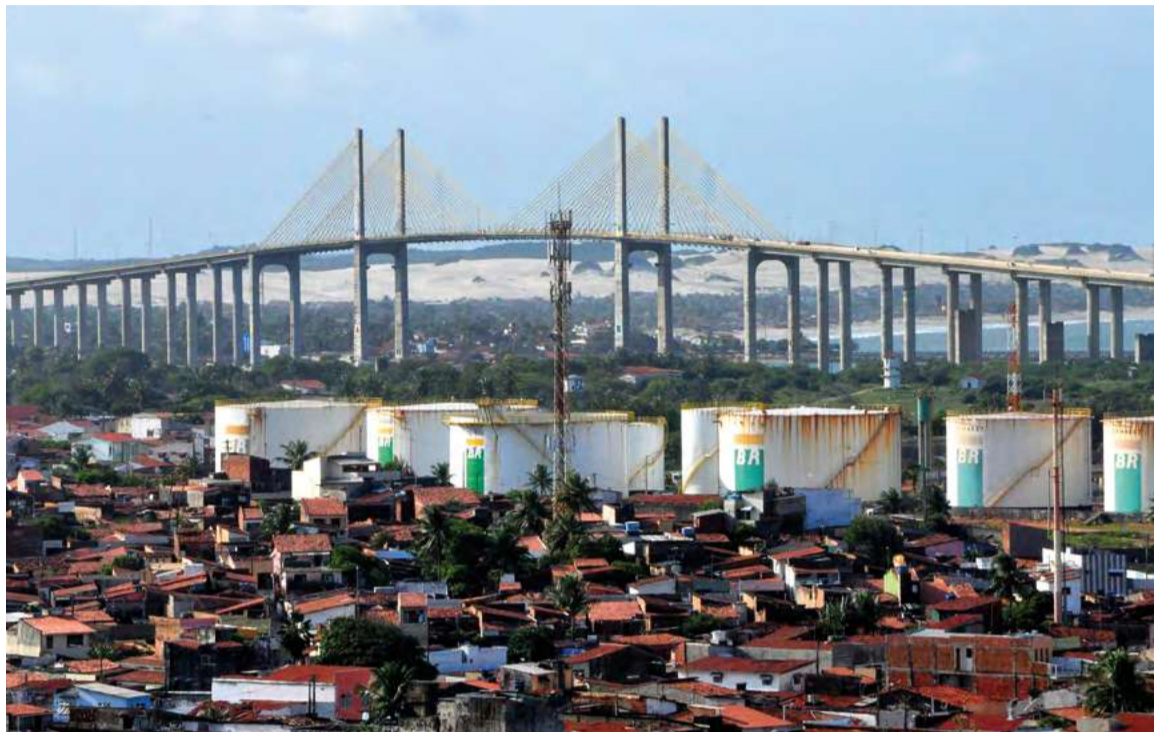
Localizado em Santos Reis, o Terminal operou entre 1982 e 2012, sendo desativado em 2013

A questão da limpeza da área está em processo judicial desde 2017. À época, o Ministério Público Federal (MPF) abriu ação ci-