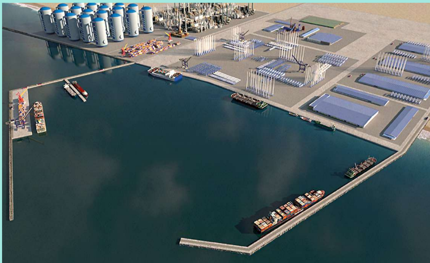
Projeto do Porto-Indústria Verde: obra vai permitir a exploração da energia eólica offshore no RN