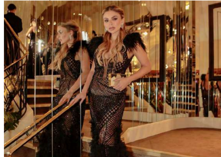
A potiguar Lidiane Bezerra arrasando no Festival de Cannes