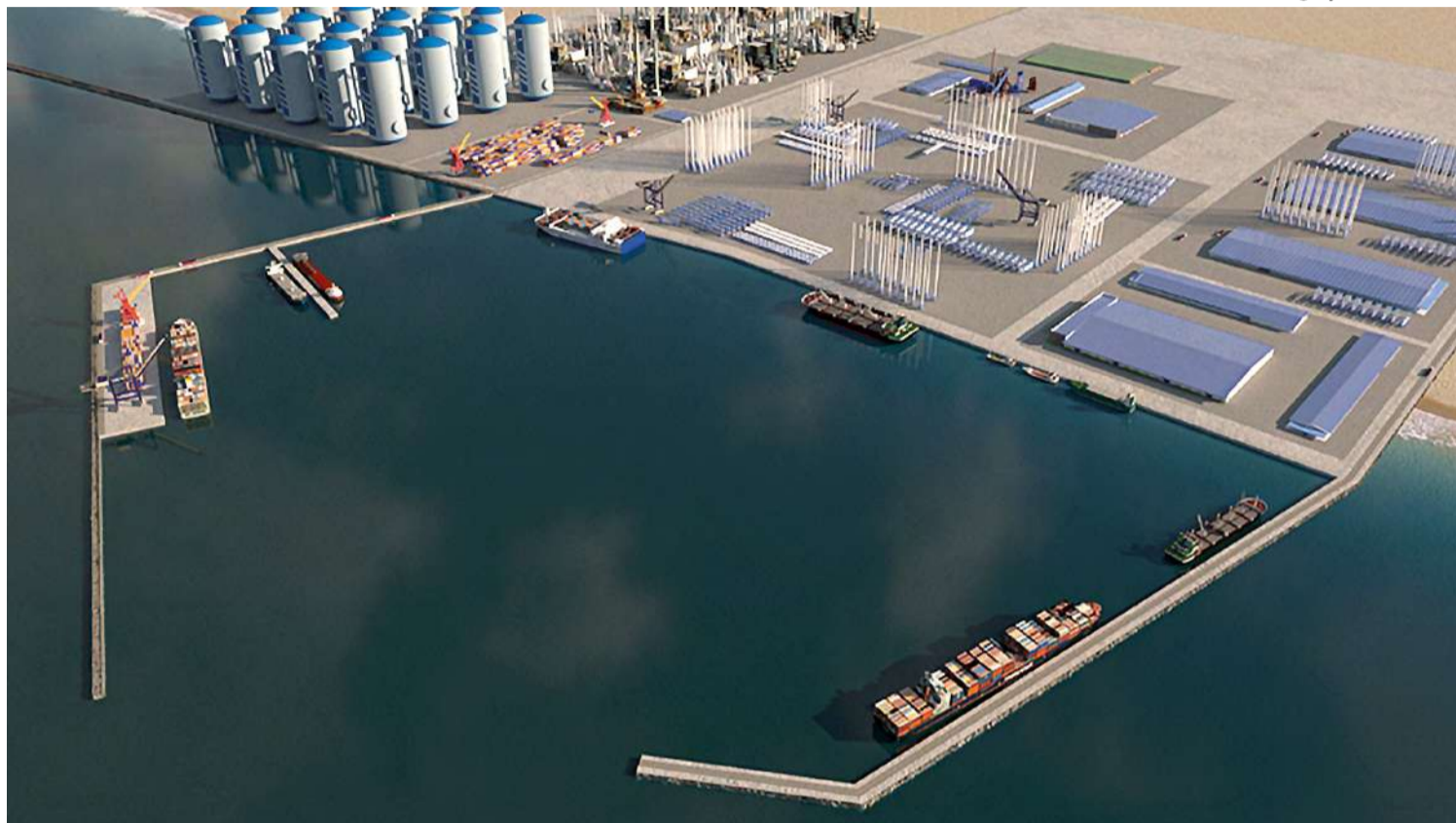
Local que deve abrigar o Porto Indústria-Verde será o litoral de Caiçara do Norte, a cerca de 160 km de Natal

A audiência, marcada para o dia 29, será uma oportunidade para a governadora apresentar detalhes do projeto do Porto-Indústria Verde e destacar a importância do Rio Grande do Norte no cenário nacional das fontes de energias renováveis. A expectativa é de que essa reunião fortaleça as negociações e abra caminho para futuros investimentos e parcerias com empresas chinesas no estado.