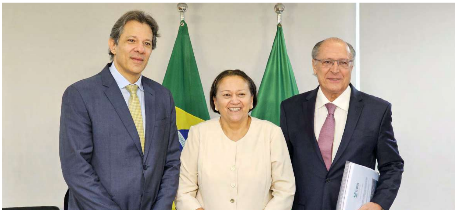
Fátima apresentou o porto-indústria ao vice-presidente Geraldo Alckmin e ao ministro da Fazenda, Fernando Haddad

“O Porto-Indústria Verde é pensado para servir como apoio à indústria das energias renováveis, fabricação e montagem de equipamentos e exportação. O Rio Grande do Norte tem condições privilegiadas e o menor custo do mundo para produção de energia limpa, tanto que já temos grupos interessados”, disse a governadora.