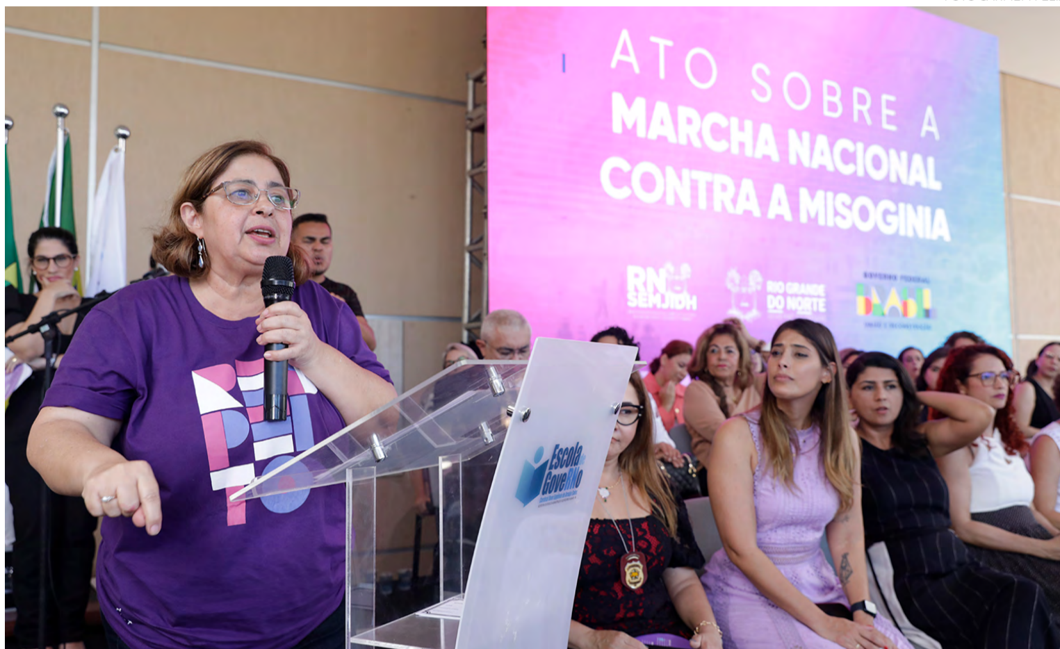
Ministra da Mulher, Aparecida Gonçalves, anunciou a instalação de Casas da Mulher Brasileira em Natal e Mossoró

“É de disso que trata a campanha que a ministra das Mulhe-