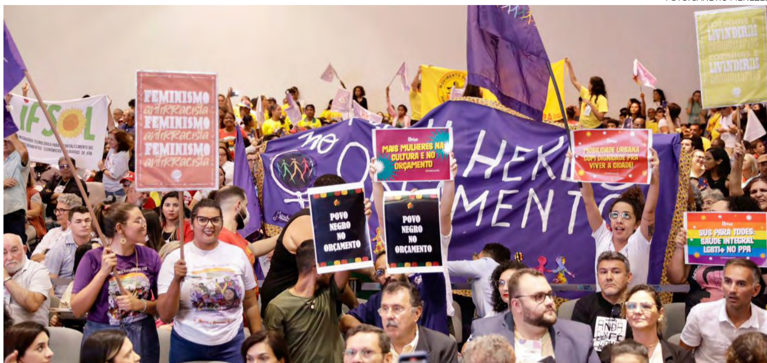
Escola do Governo recebeu as discussões para formulação de novas políticas públicas

O novo Plano Plurianual (PPA) do Governo Federal tem três eixos norteadores: “Desenvolvimento Social e Garantia de Direitos”, “Desenvolvimento Econômico e Sustentabilidade Socioambiental e Climática” e “Defesa da Democracia e Recons-