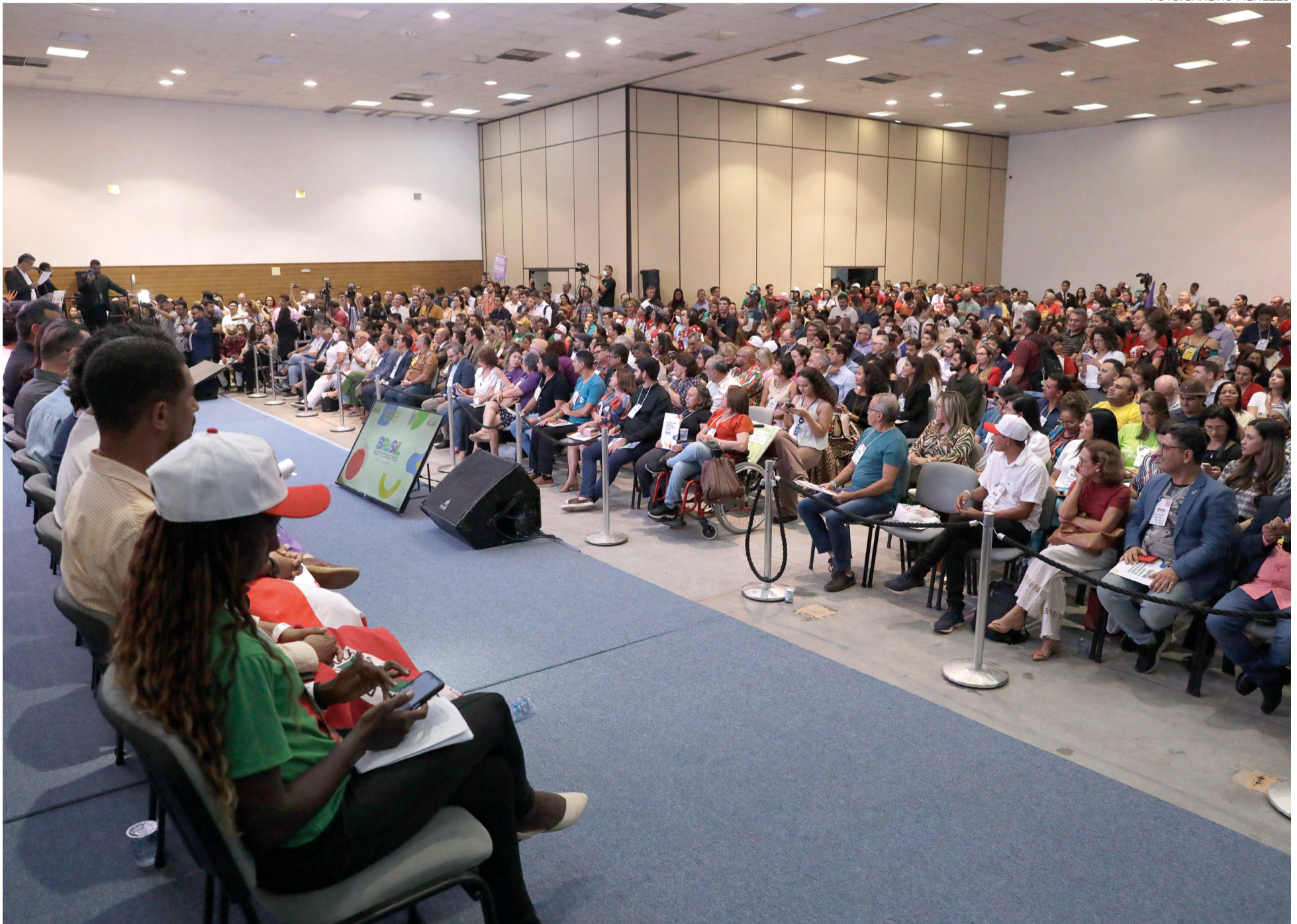
Plenária estadual do PPA Federal teve presença dos ministros Simone Tebet, Planejamento, e Márcio Macêdo, da Secretaria-Geral da Presidência