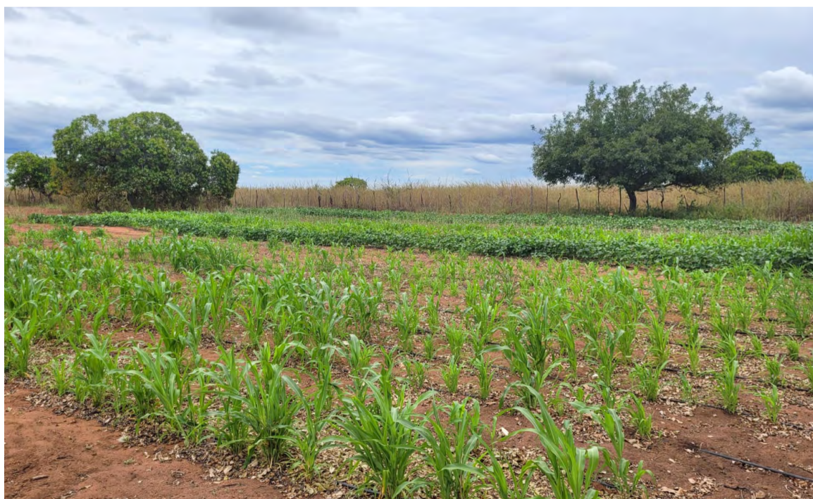
Governo assegurou apoio a vários programas de amparo ao pequeno produtor rural