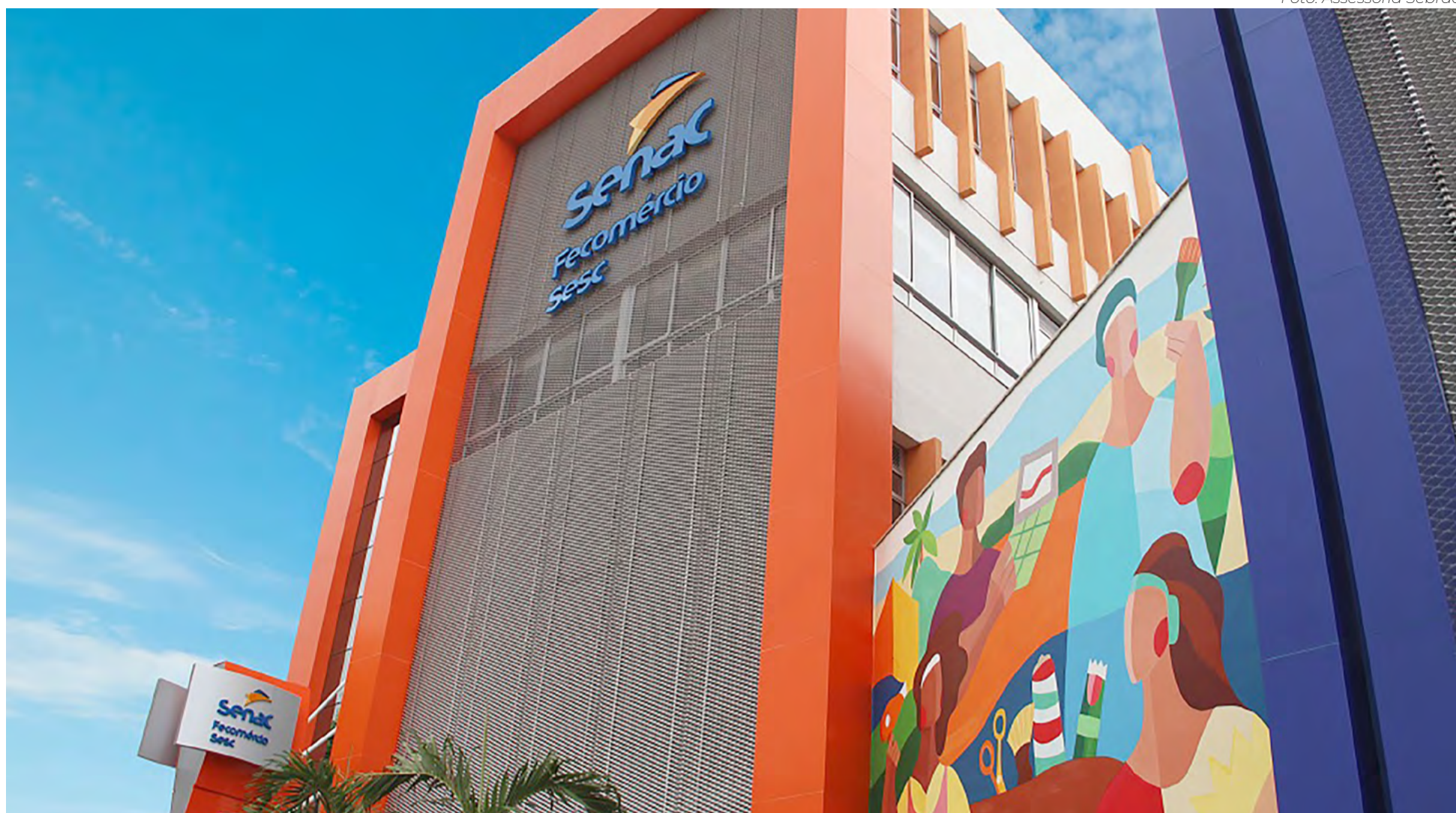
Escola Técnica Senac RN terá oferta de qualificação profissional para a formação técnica nas áreas de Saúde, Beleza e Tecnologia da Informação