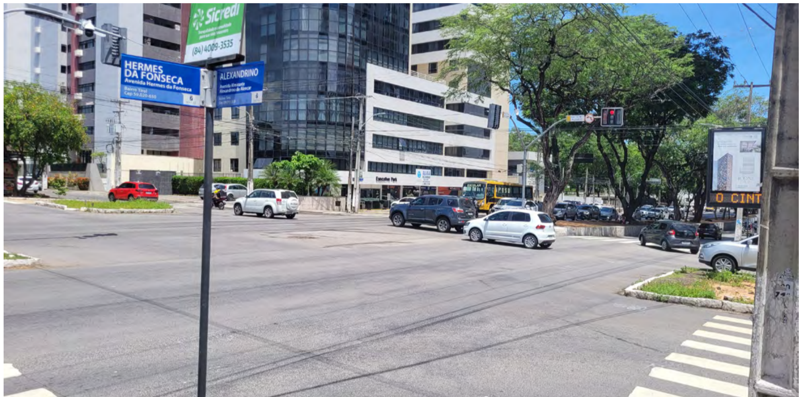
Obra também contempla instalação de sinal para pedestre e ciclofaixa. Calçadas terão rampas de acessibilidade

No entanto, o projeto é alvo de inquéritos abertos pelo Ministério Público do Rio Grande do Norte