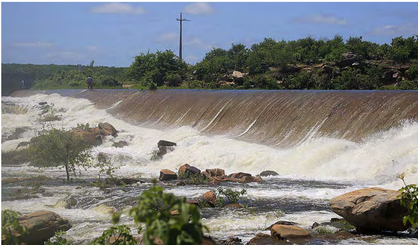
Açude Mendubim, localizado na cidade de Assu, atingiu 100% de sua capacidade nos últimos dias