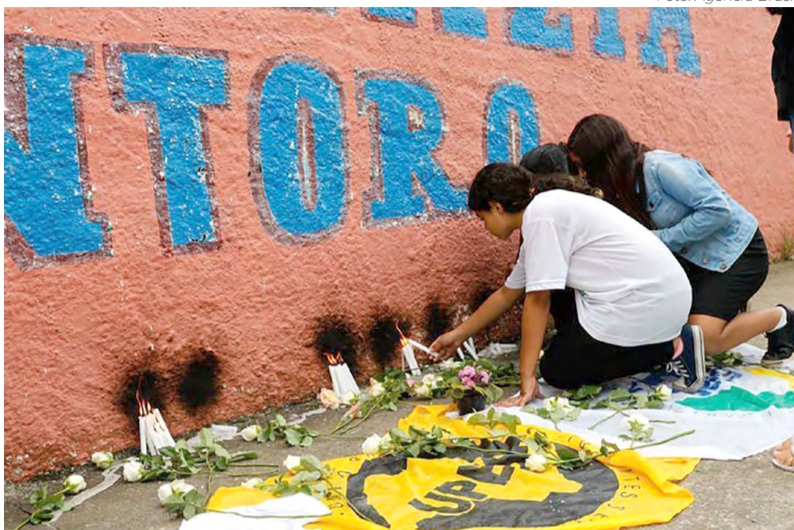
Em 27 de março, aluno matou professora a facadas em escola estadual de São Paulo