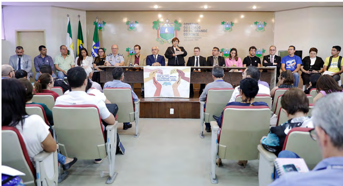
Governo apresentou ações para combater à violência escolar na semana passada