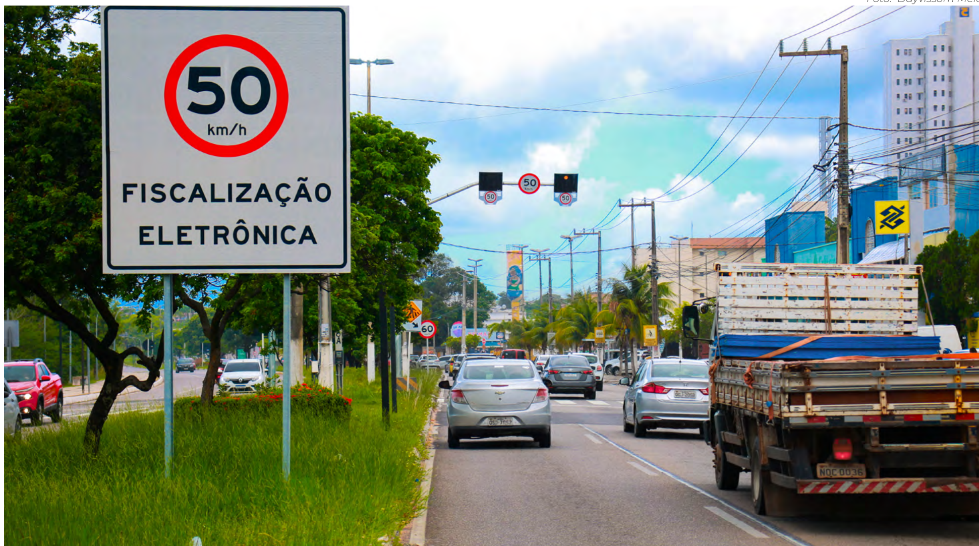
Na Avenida Engenheiro Roberto Freire, número de autuações a motoristas subiu de 320 em janeiro para 7.025 em fevereiro deste ano