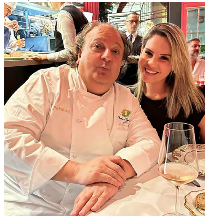
Mais que amigos... friends! A jornalista Gabriela Duarte e o Masterchef Erick Jacquin no ANUFOOD, feira internacional de alimentos e bebidas que aconteceu em SP