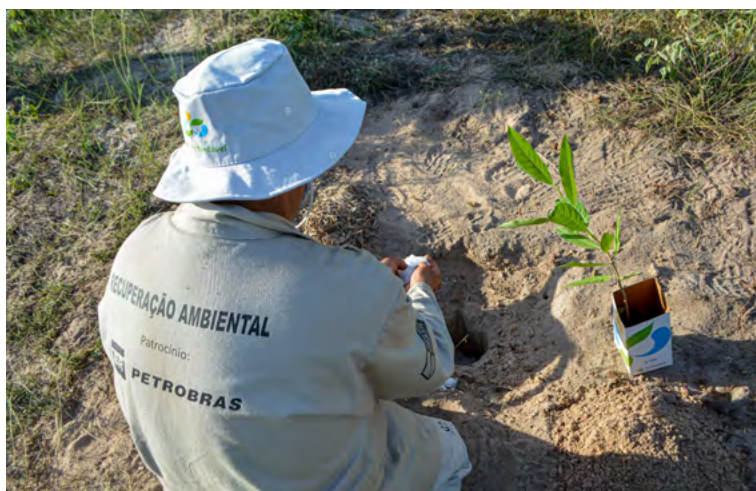
Projeto reteve mais de 1,2 milhão de quilos de carbono

Uma ação complementar foi a implantação de cinco meliponários (abrigos) de abelhas nativas sem ferrão, com um total de 75 colmeias. Esses meliponários implantados em novembro de 2021 dobraram de tamanho em 12 meses. As abelhas Jandaíra são responsáveis por 30% da polinização da caatinga. “Colocamos os meliponários em lugares estratégicos de forma que as abelhas pudessem polinizar tanto a reserva legal quanto os quintais