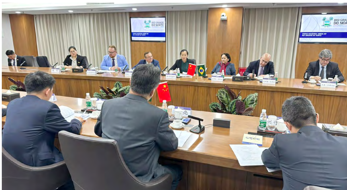
Governadora com representantes da empresa China Communications Construction