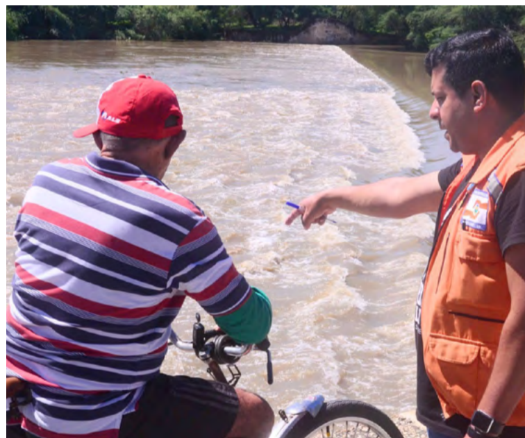
Defesa Civil de Mossoró orienta população sobre riscos

“Estamos discutindo a possibilidade de ampliar essas áreas e poderemos tornar esses alertas cada vez mais assertivos. Além disso, a Defesa Civil já vem solicitando há pouco mais de um ano que os municípios, através das suas coordenadorias municipais, identifiquem áreas de risco em seus territórios que possam