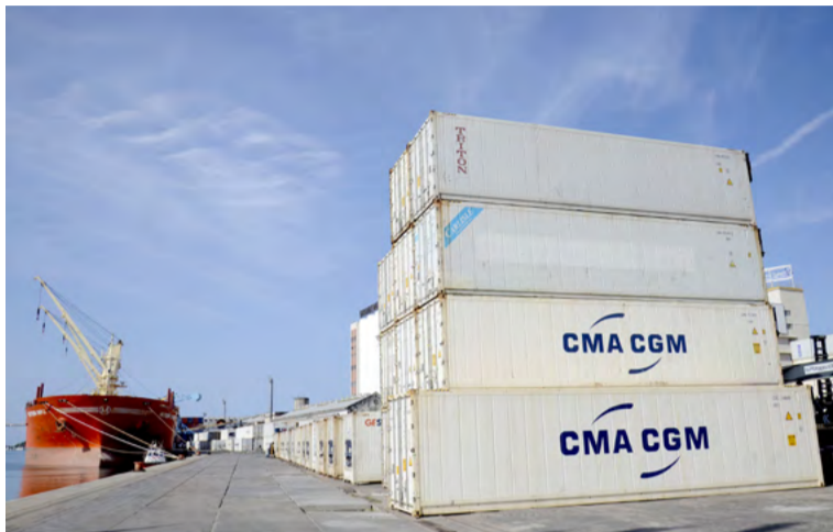
Nova empresa substituirá CMA CGM com rota semanal