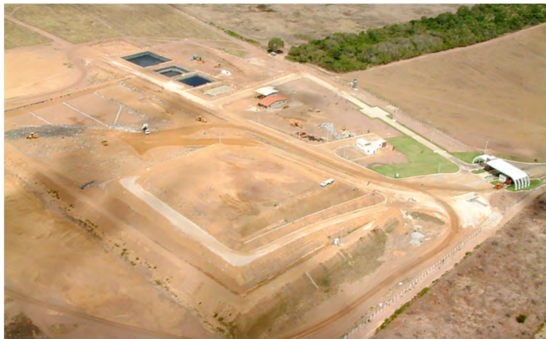
Aterro sanitário de Natal, situado em Ceará-Mirim, iniciou as operações em 2004