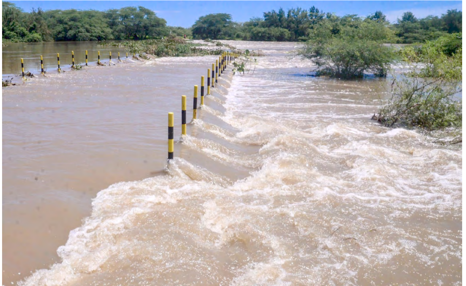
Após as chuvas de abril, residências próximas às margens do Rio Mossoró foram invadidas pelas águas