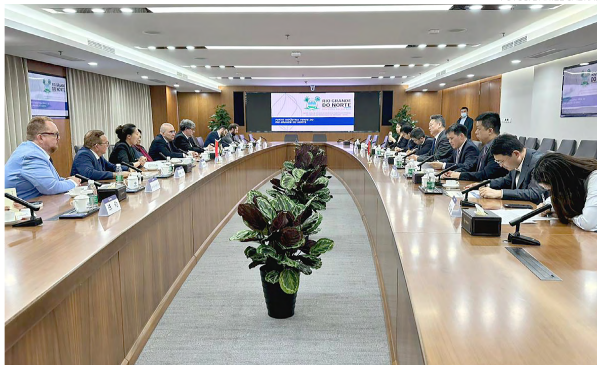
Durante reunião com a CCCC, na China, a governadora Fátima Bezerra apresentou o projeto tido como imprescindível para o setor de energias renováveis eólica e solar do RN

A comitiva potiguar também se reuniu com o presidente da State Grid Corporation