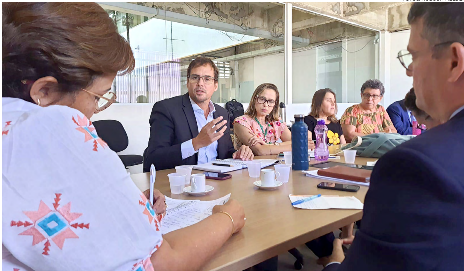
Grupo de Trabalho foi instituído para tratar das providências à segurança da comunidade escolar no Rio Grande do Norte

Também foram discutidos os resultados das investigação