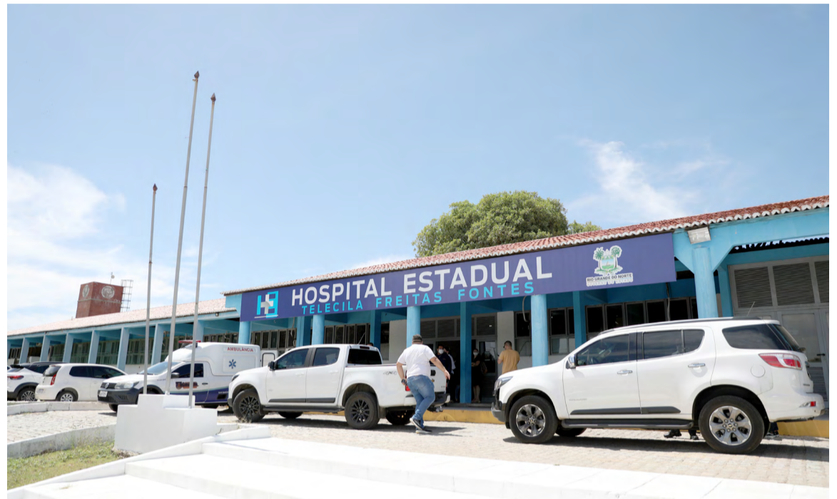
Pacote de obras na rede hospitalar pública estadual é organizado pelas secretarias de Estado da Infraestrutura (SIN) e da Saúde Pública (Sesap)

As emendas parlamentares são de bancada coletiva, inclusive de quando a governadora Fátima Bezerra ainda era senadora, mais emendas individuais do ex-senador Jean Paul Prates, do senador Styvenson Valentim e da deputada federal Natália Bonavides. O ex-senador Jean