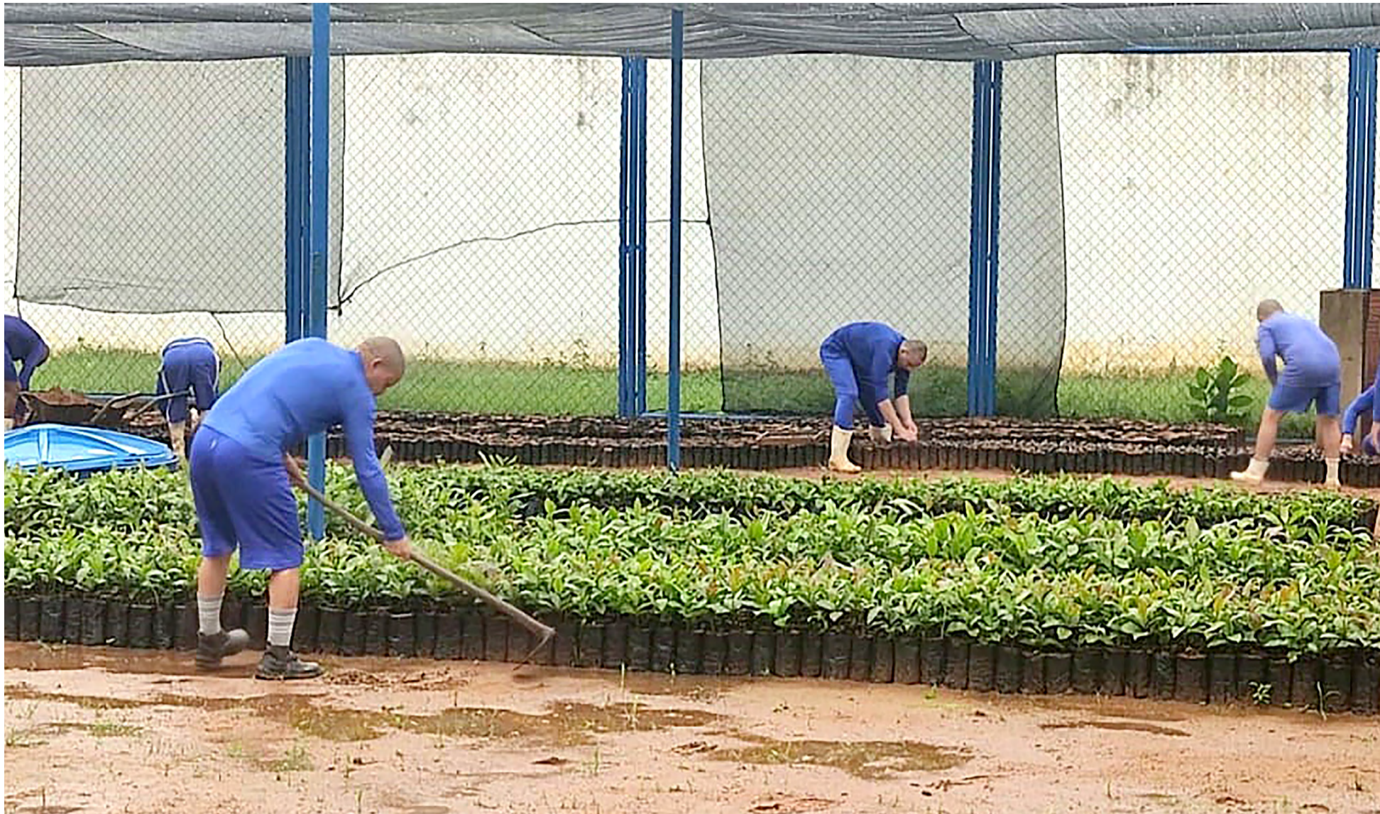
Projeto visa fortalecer a cadeia produtiva da cajucultura, melhorando a produção, a renda e a qualidade de vida dos agricultores e suas famílias