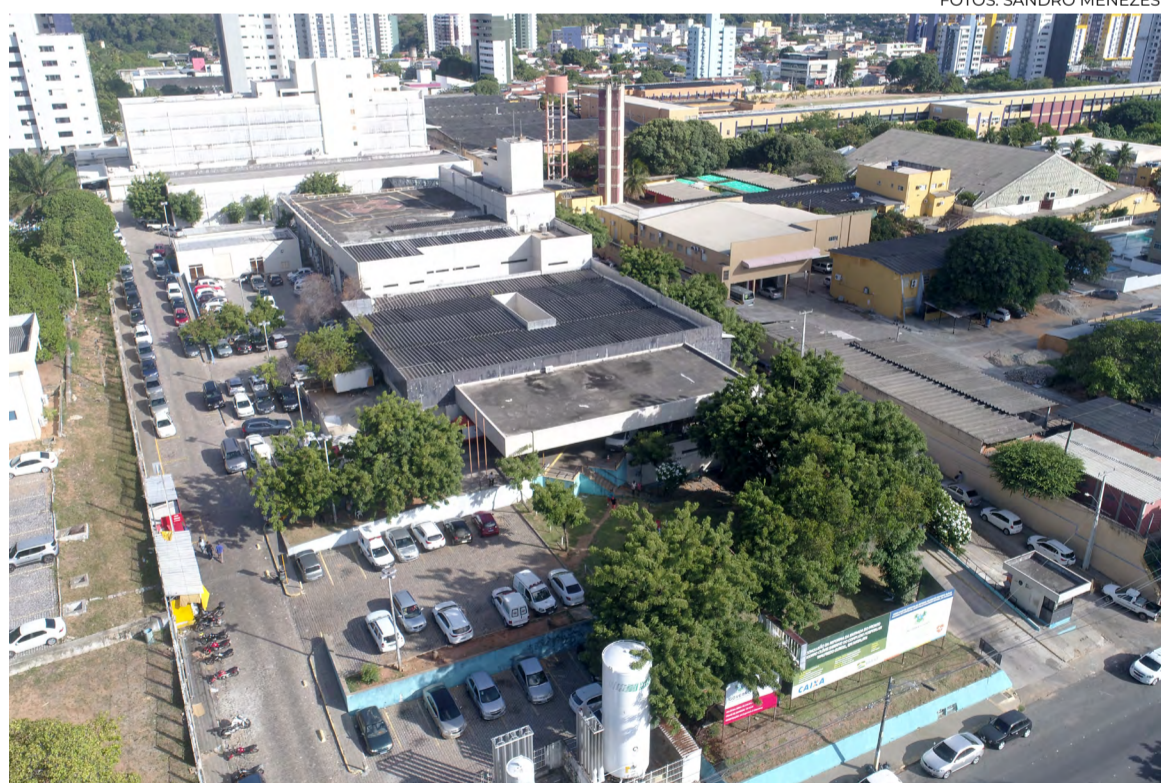
Hospital Monsenhor Walfredo Gurgel recebe melhorias estruturais e equipamentos

O Hospital Monsenhor Walfredo Gurgel, em Natal, vem recebendo melhorias na estrutura física e equipamentos. O Governo do RN entregou a re-