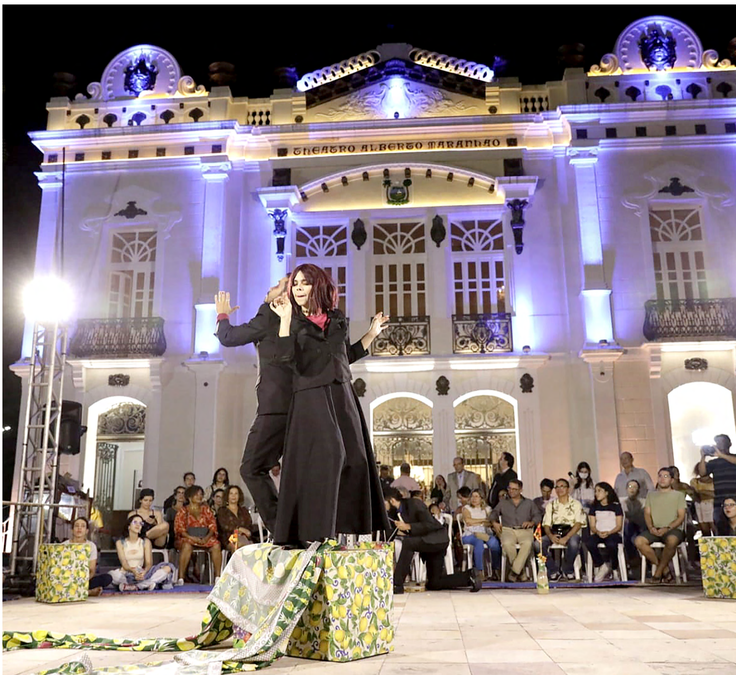
Espectadores foram convidados a se deslocarem pelo átrio do TAM por um trio circense da Tropa Trupe

Um dos grandes momentos da noite foi o tributo à vida e obra do ator e produtor cultural Jesiel Figueiredo (1942-1994), com a participação de artistas que trabalharam com o Teatrólogo, cuja data de nascimento (11 de abril) foi escolhida como O Dia Estadual do Teatro Potiguar, iniciativa do deputado estadual Francisco do PT, cuja Lei Nº 11.158, de 20 de junho de 2022.