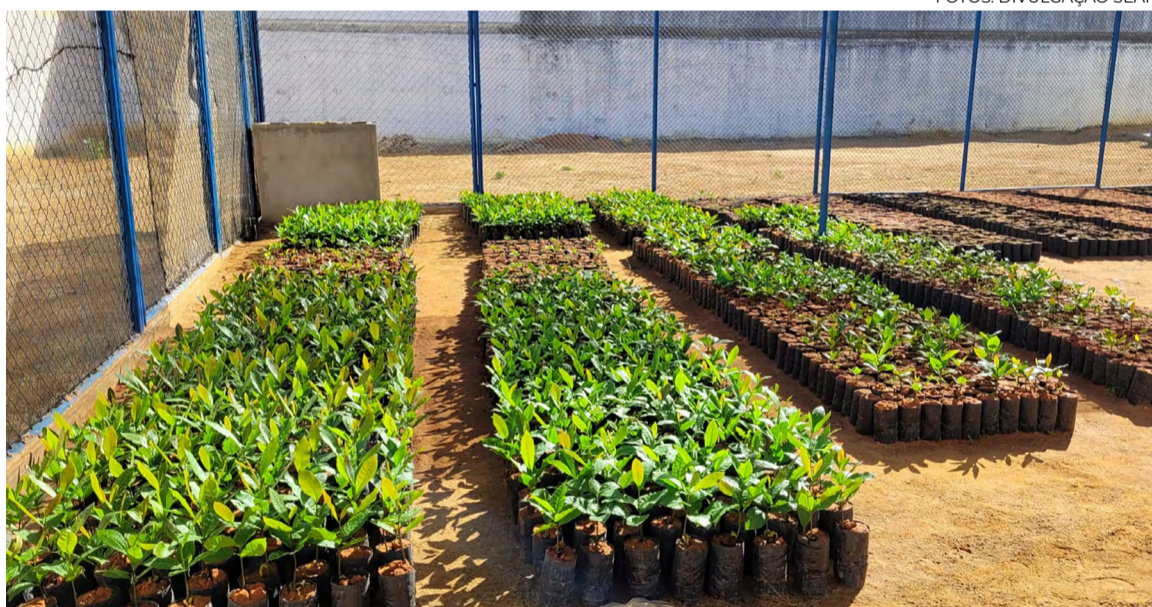
Os internos da Penitenciária de Mossoró já produziram 40 mil mudas em 2023