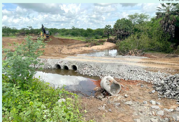
DER iniciou as obras de recuperação da rodovia

Uma equipe técnica fez o isolamento da rodovia para evitar acidentes e, em seguida, de forma emergencial, iniciou a construção de um desvio paralelo ao trecho que