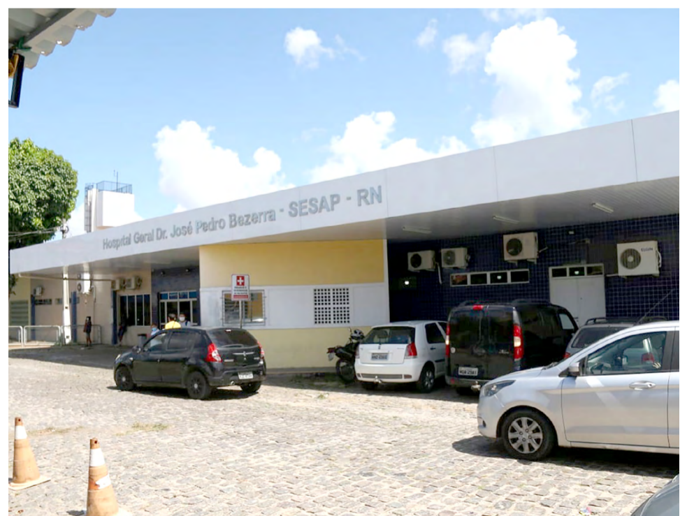
Entre os hospitais estão o Monsenhor Walfredo Gurgel (R$ 10,6 milhões), João Machado (R$ 1,4 milhão) e José Pedro Bezerra (R$ 6 milhões)