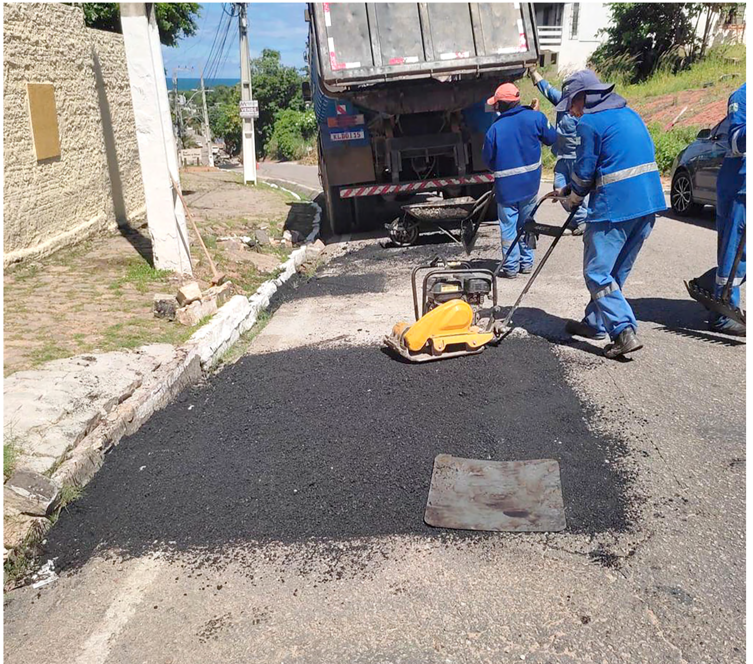
Planejamento da Secretaria de Infraestrutura é de recuperar casos mais urgentes e também investir na restauração de trechos críticos

Já a terceira fase contará com aporte de recursos federais e compreende a implantação de novas rodovias novas, além da readequação e do aumento da capacidade de rodovias já existentes.