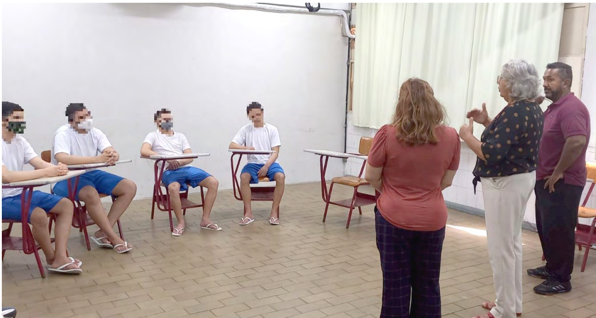
As aulas no Instituto de Educação Superior Presidente Kennedy foram realizadas de outubro a dezembro de 2022, duas vezes por semana